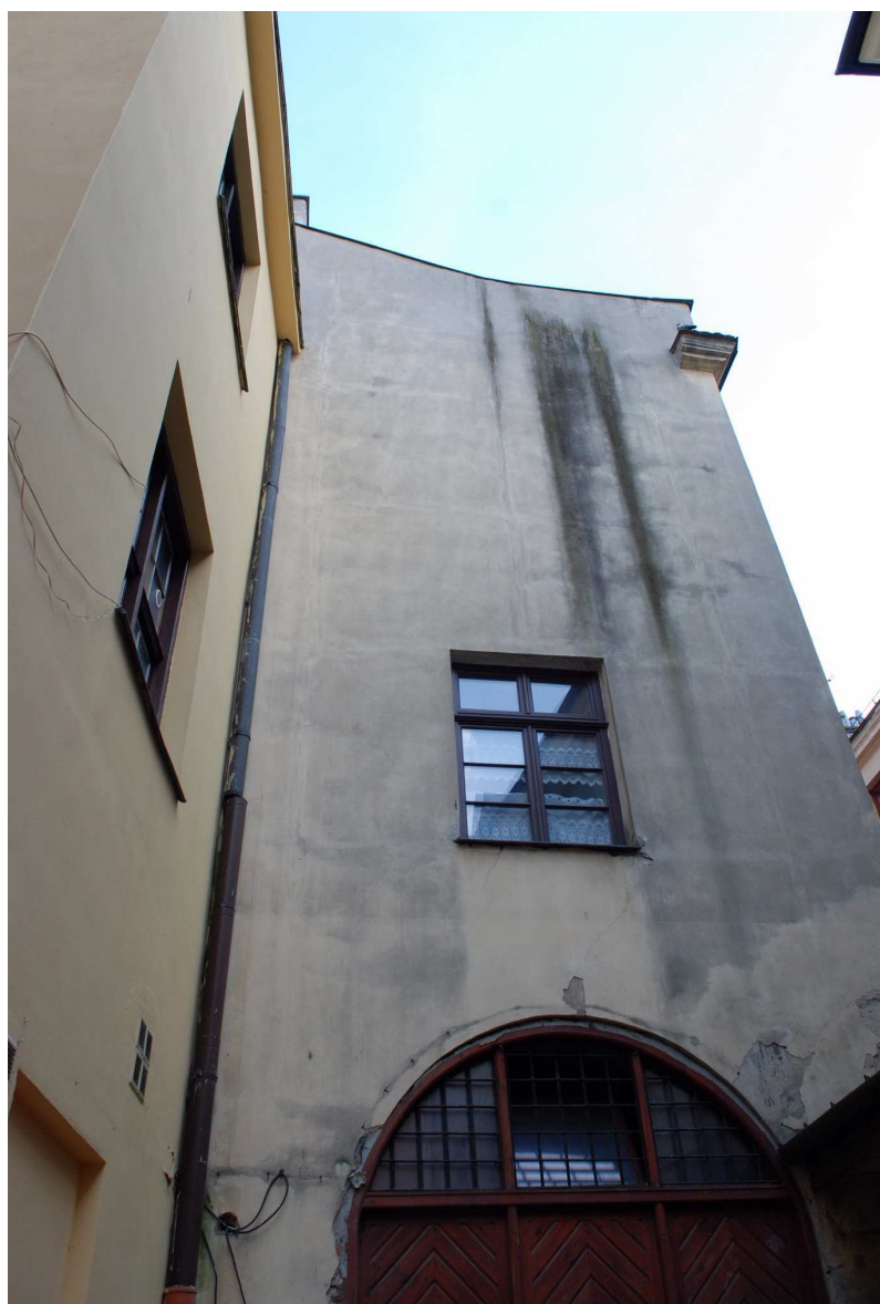
Podwórko, Rynek 18, 2010.