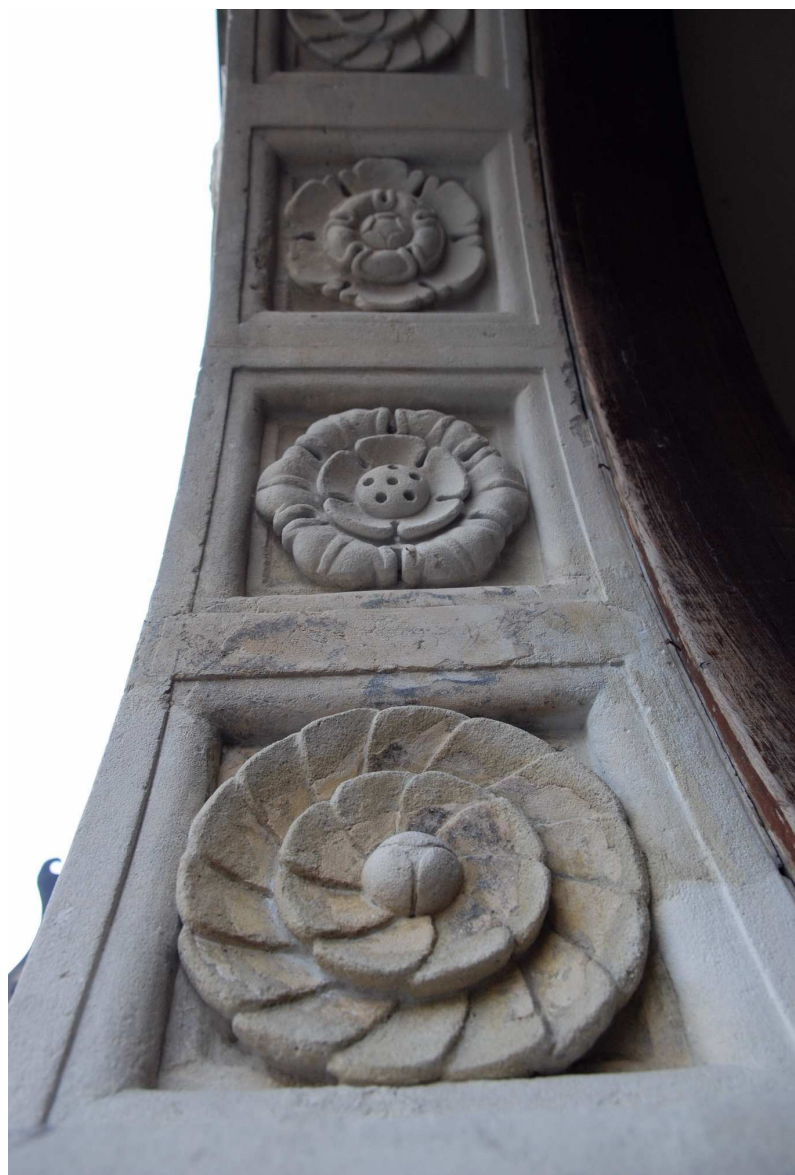
Detal, Rynek 18, fot. Marcin Moszyński, 2010.