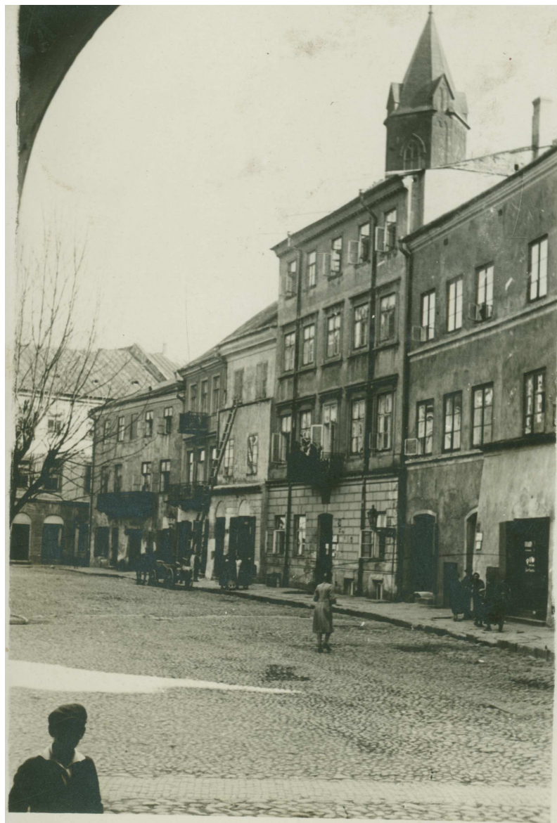
Rynek 18, kamienica pierwsza od prawej, kamienice przed odnowieniem.