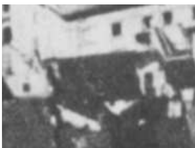
Fragment panoramy Lublina, lata 30., Rynek 18/A fragment of panorama of Lublin in the 1930s, Rynek 18,