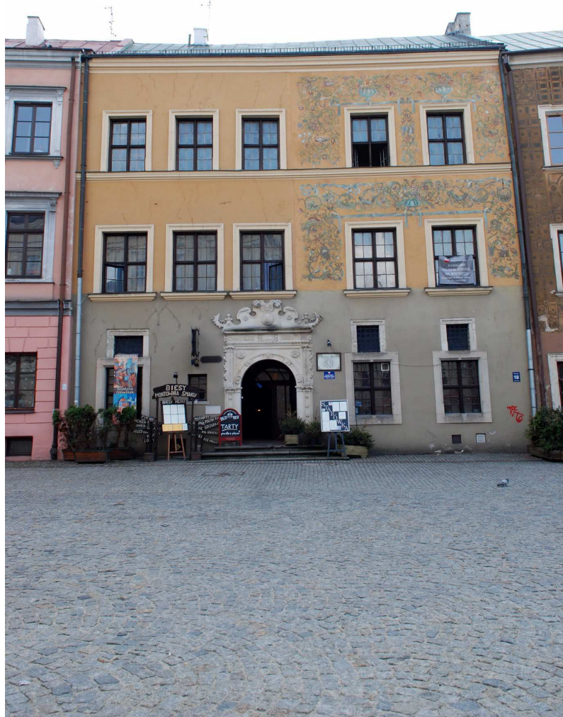
Fasada, Rynek 18, fot. Marcin Moszyński, 2010.