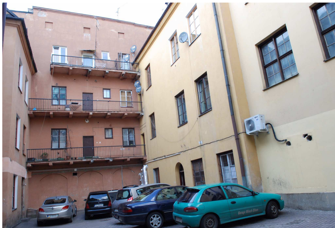
Podwórko, Rynek 18, fot. Marcin Moszyński, 2010.