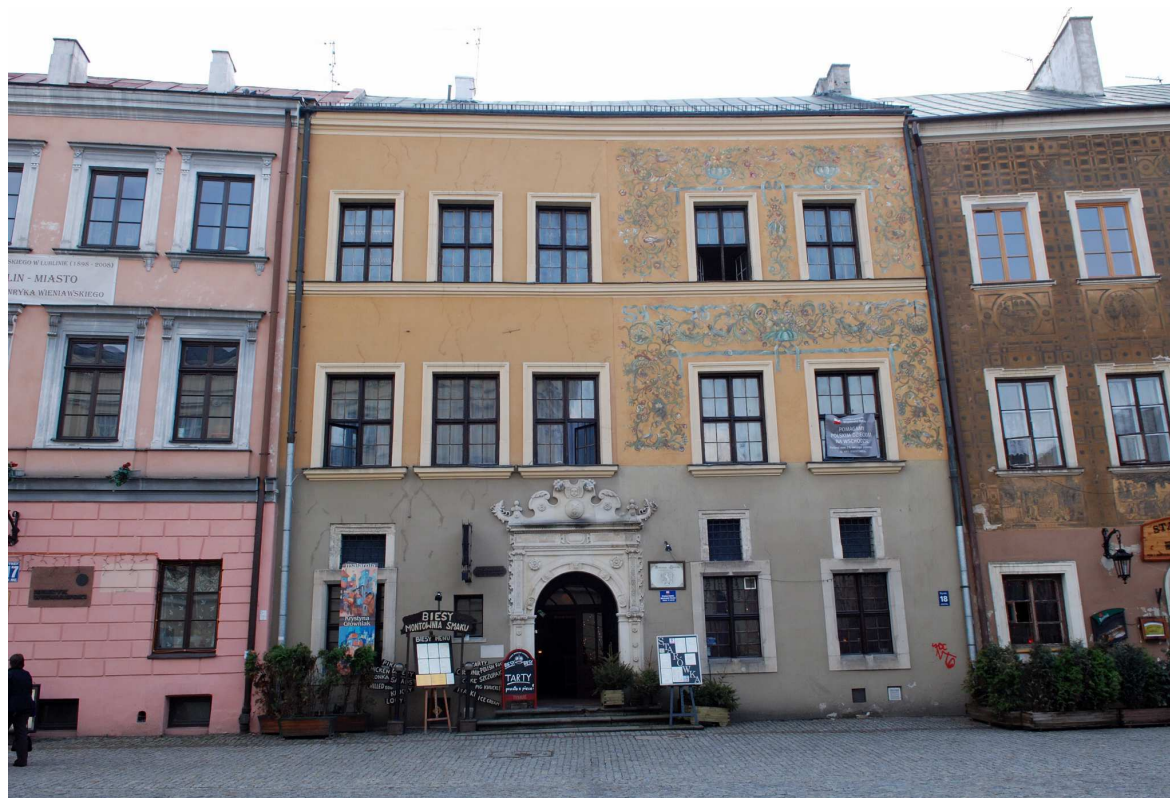
Fasada, Rynek 18, fot. Marcin Moszyński, 2010.