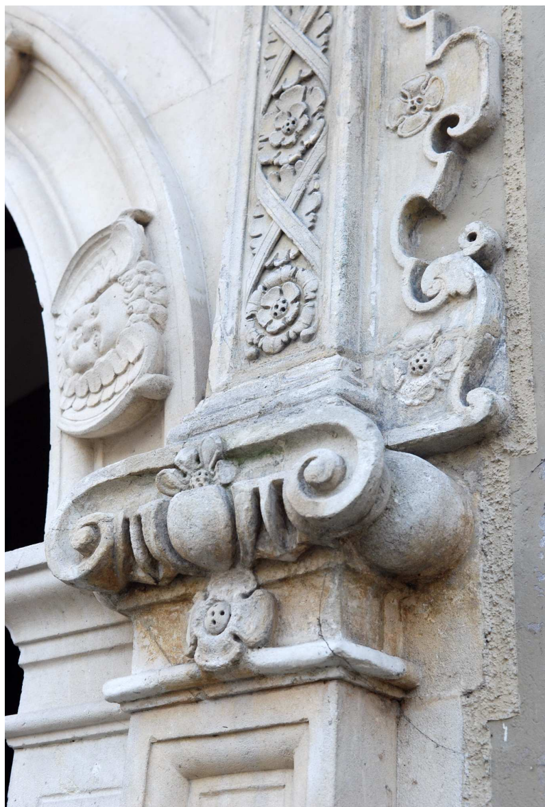
Detal, Rynek 18, fot. Marcin Moszyński, 2010.