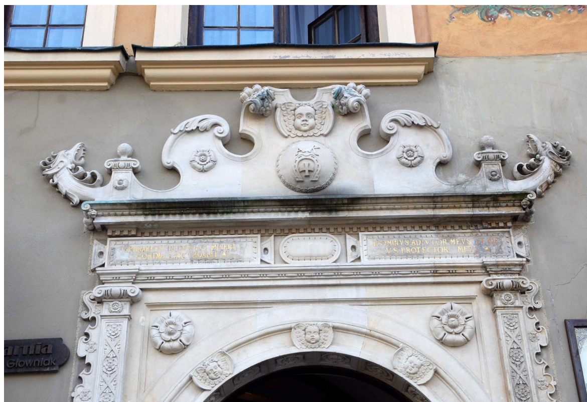
Detal, Rynek 18, fot. Marcin Moszyński, 2010.