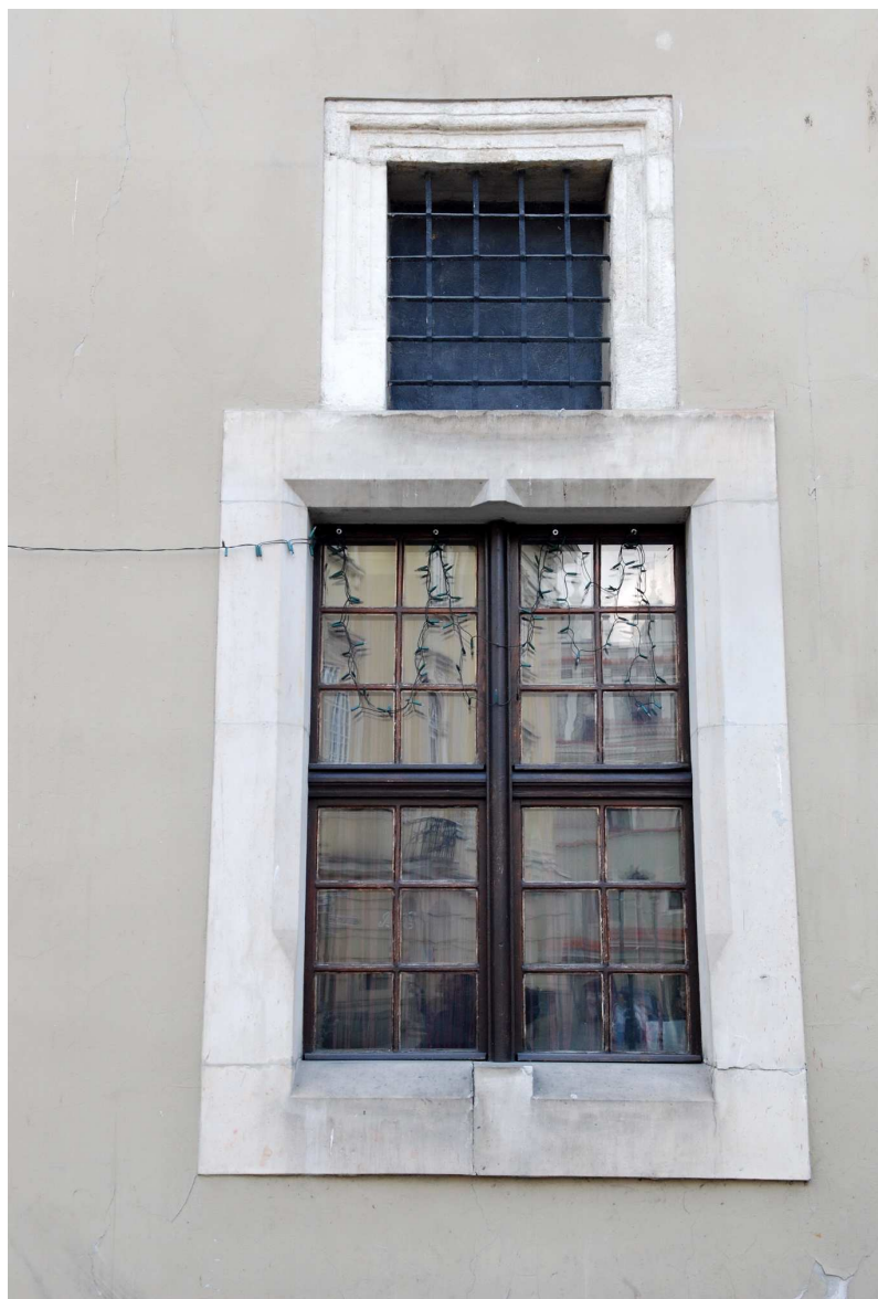
Detal, Rynek 18, fot. Marcin Moszyński, 2010.