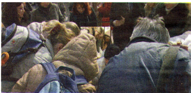
Nie dla wszystkich starczyło świec