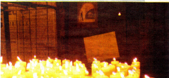
Na koniec powtórnie zapalono świece pamięci