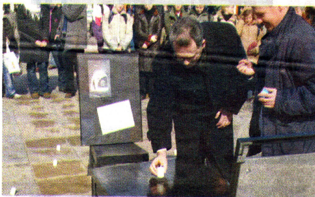
Lublin. Plac przed Galerią Centrum. 15 marca, godz. 12. Prezydent Andrzej Pruszkowski zapala świecę dla Czechowicza