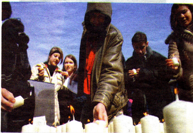
W 101 rocznicę urodzin poety zapłonęło 101 świec