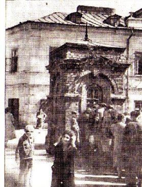
Róg ulicy Szerokiej, Krawieckiej i Kowalskiej. Rok 1943. Dziś w tym miejscu jest plac Zamkowy. Identyczna studnia stoi na terenach dworca PKS