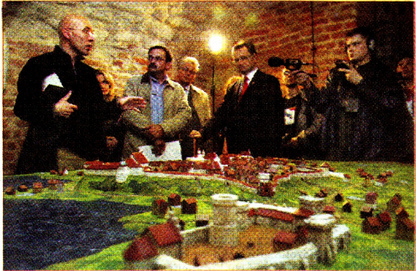
Od dzisiaj wszyscy będą mogli podziwiać makiety dawnego Lublina...

Uruchomienie Trasy Podziemnej kosztowało 111 tys. zł (z tego miasto wyłożyło 60 tys. zł). Data otwarcia trasy nie jest przypadkowa – płomienie ogarnęły miasto dokładnie 287 lat temu.