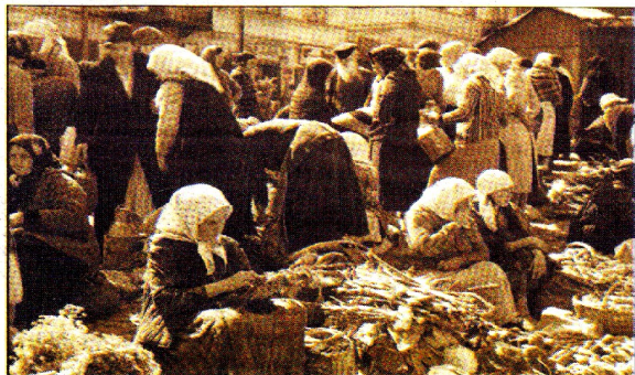
TARG PRZY UL. ŚWIĘTODUSKIEJ

Pierwszy spacer odbył się w setną rocznicę urodzin Czechowicza (2003 r.) i od razu było wiadomo, że stanie się jednym z najważniejszych wydarzeń literackich w Lublinie. Przyszło mnóstwo ludzi oczarowa-