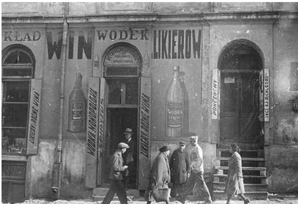
Lubartowska 1, autor Stefan Kielsznia, ok 1938, własność Jerzego Kielszni.