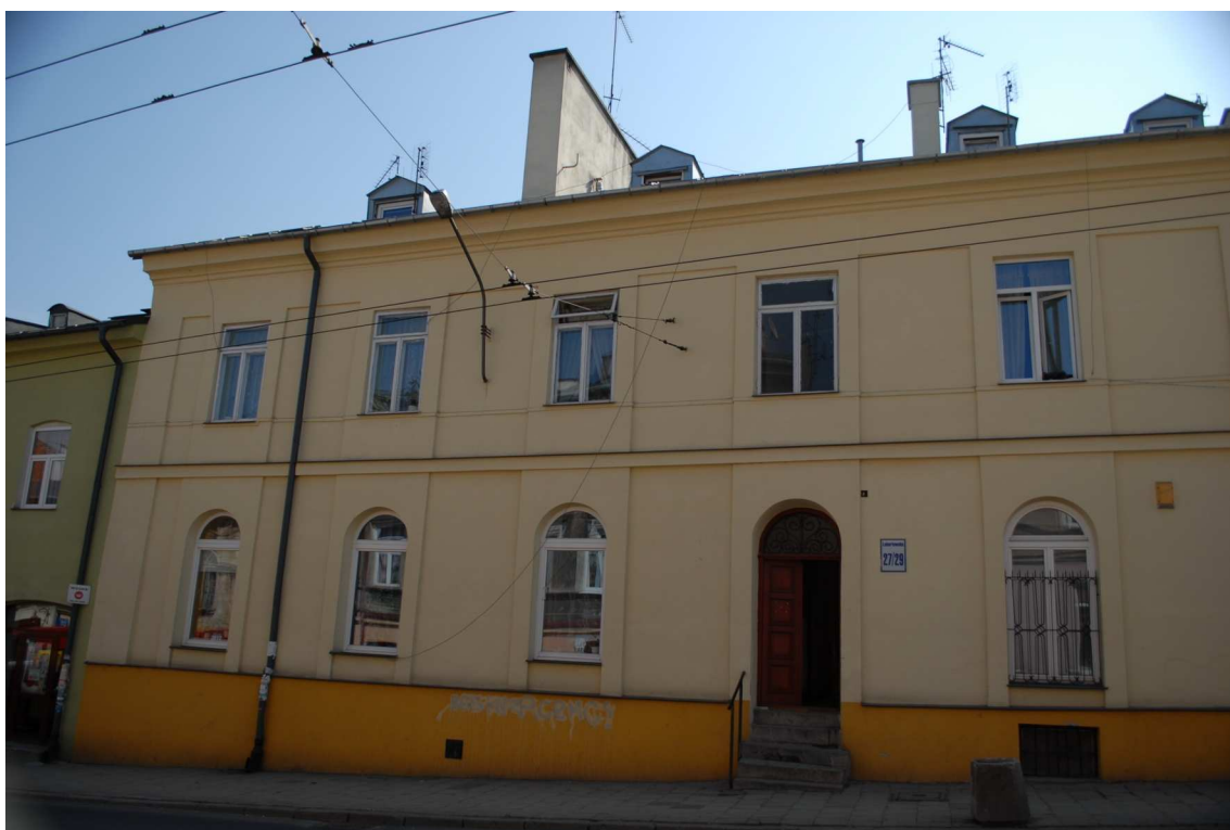
Fasada, Lubartowska 27_29, fot. Piotr Sztajdel, 2010.