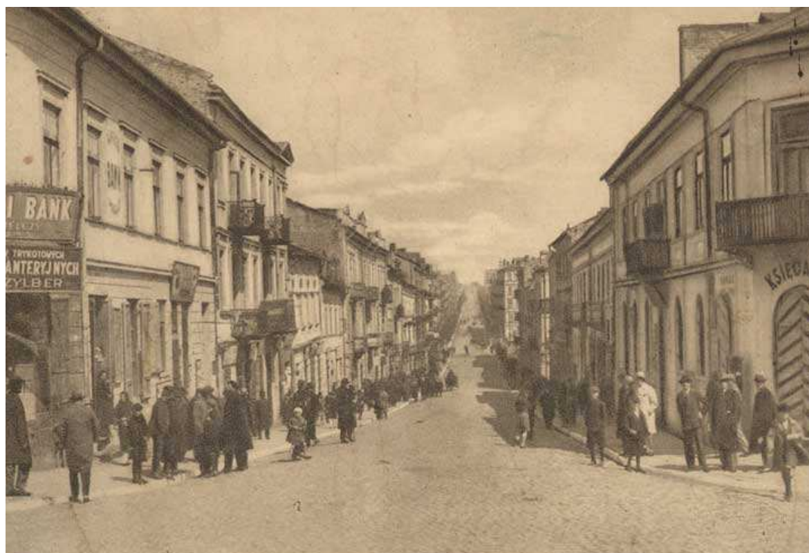
Lubartowska 1, fragment kamienicy pierwszej od prawej