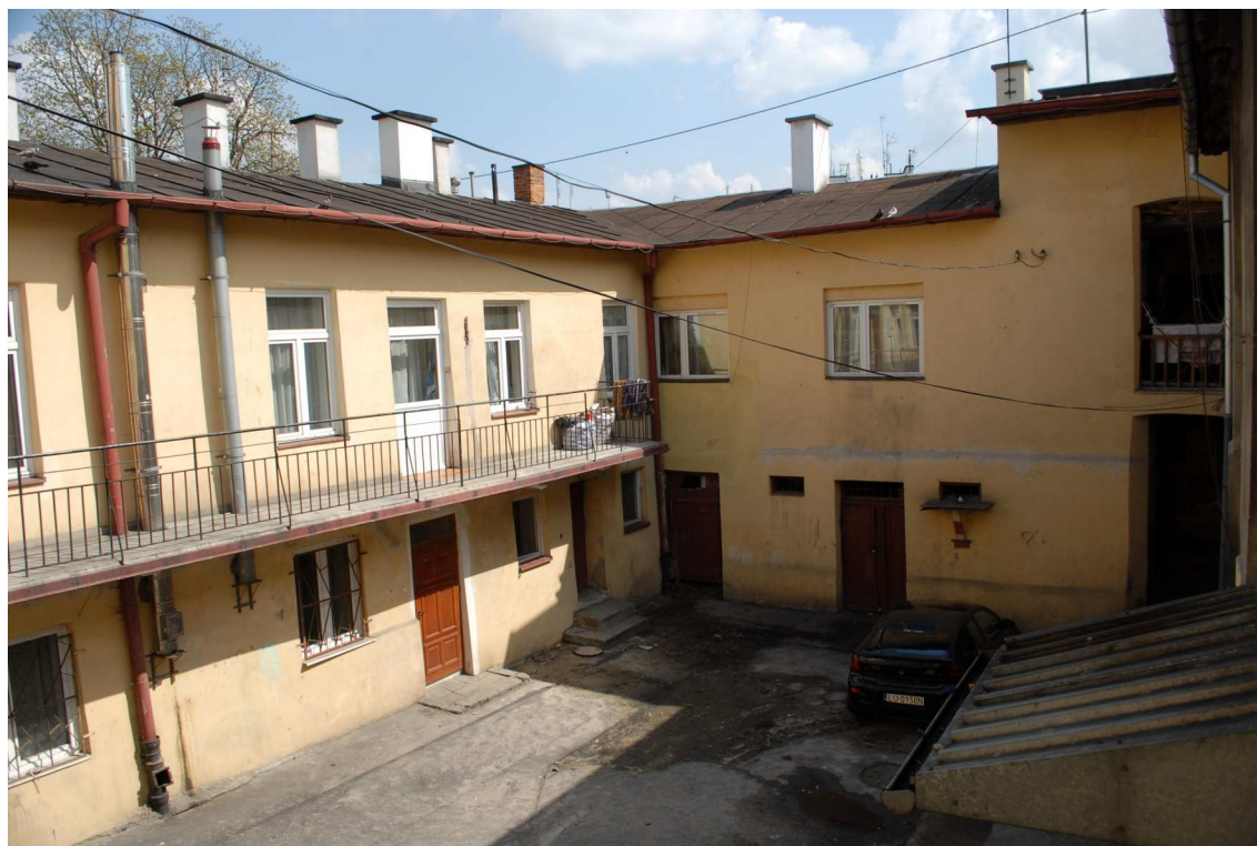
Podwórko, Lubartowska 27_29, fot. Piotr Sztajdel, 2010.