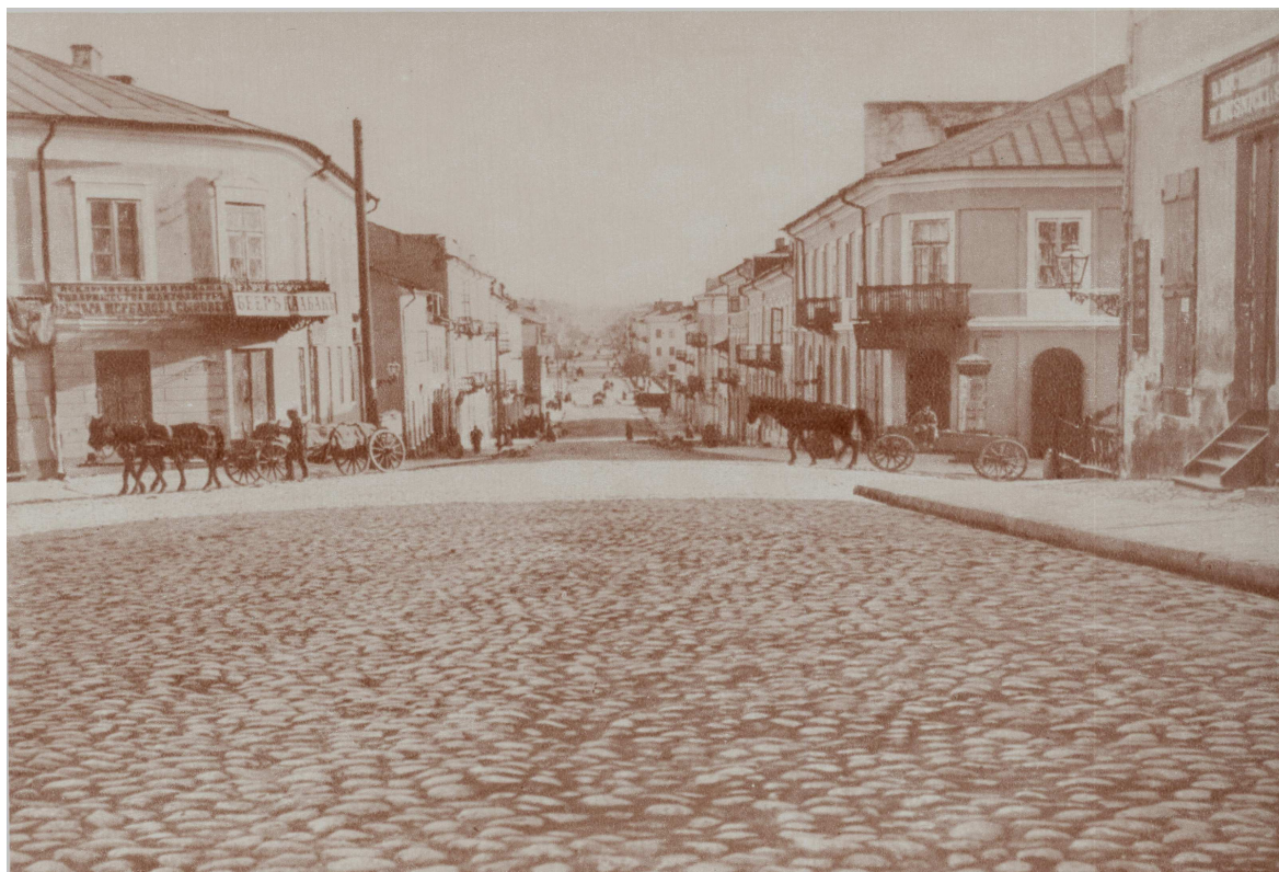
Lubartowska 1, kamienica pierwsza od prawej, autor nieznany, koniec XIX wieku.