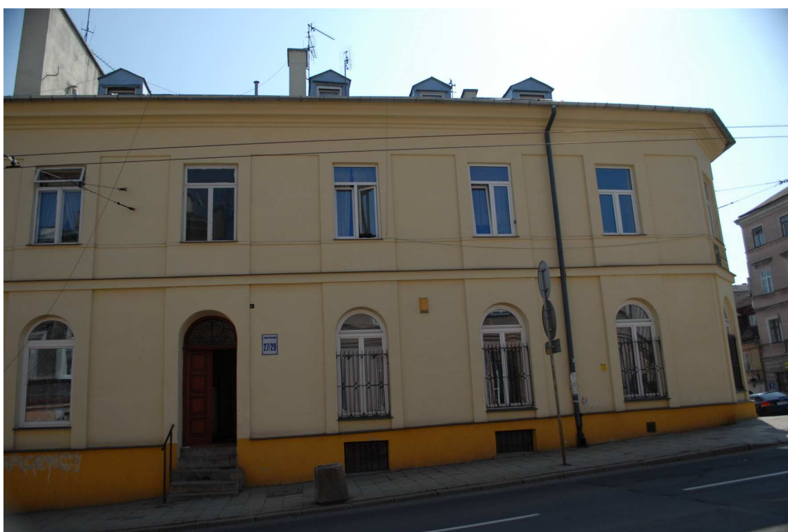
Fasada, Lubartowska 27_29, fot. Piotr Sztajdel, 2010.