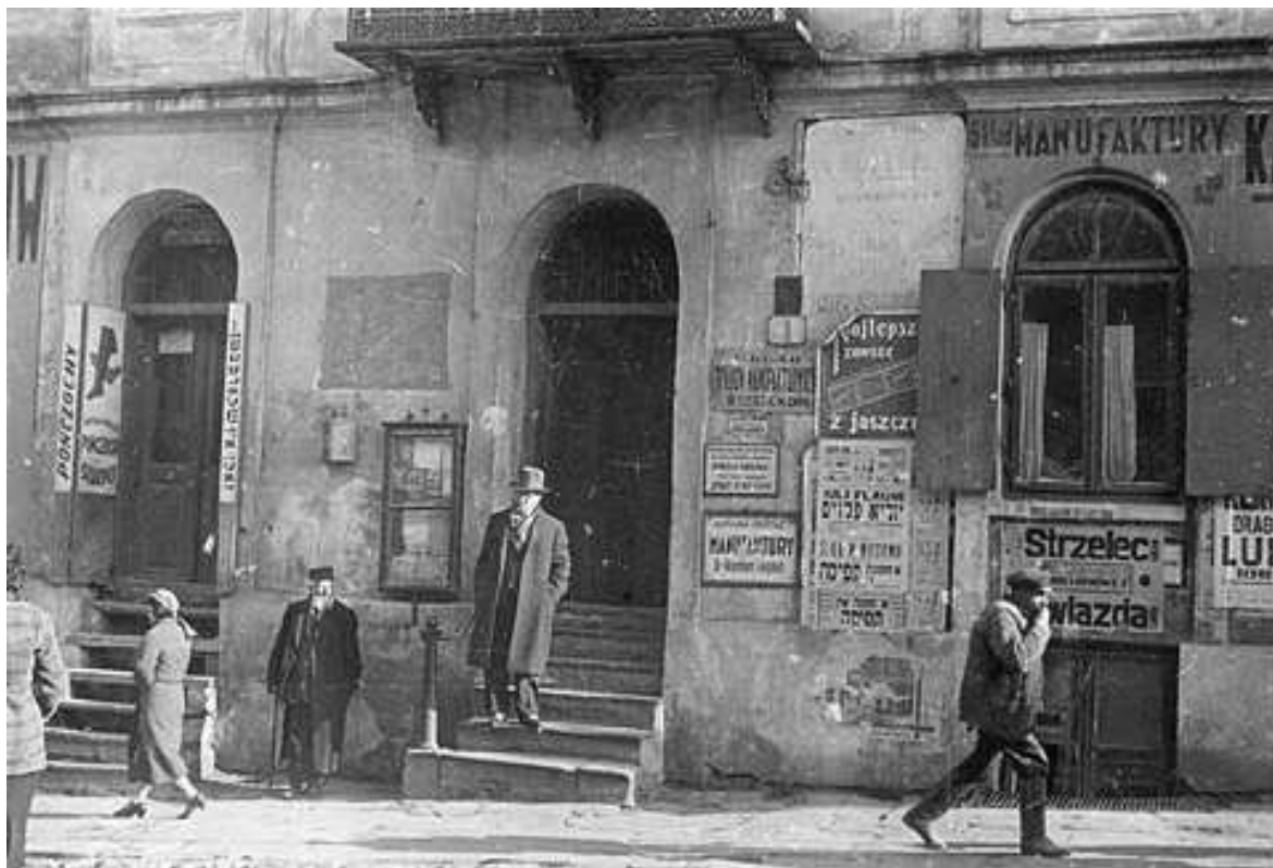
Lubartowska 1, autor Stefan Kielsznia, ok 1938, własność Jerzego Kielszni.