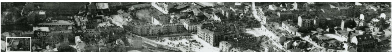
Fragment panoramy Lublina, lata 30., ul. Lubartowska/A fragment of panorama of Lublin in the 1930s, Lubartowska street,