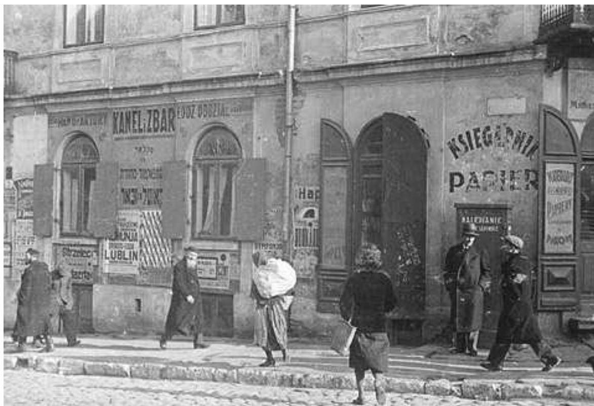
Lubartowska 1, autor Stefan Kielsznia, ok 1938, własność Jerzego Kielszni.