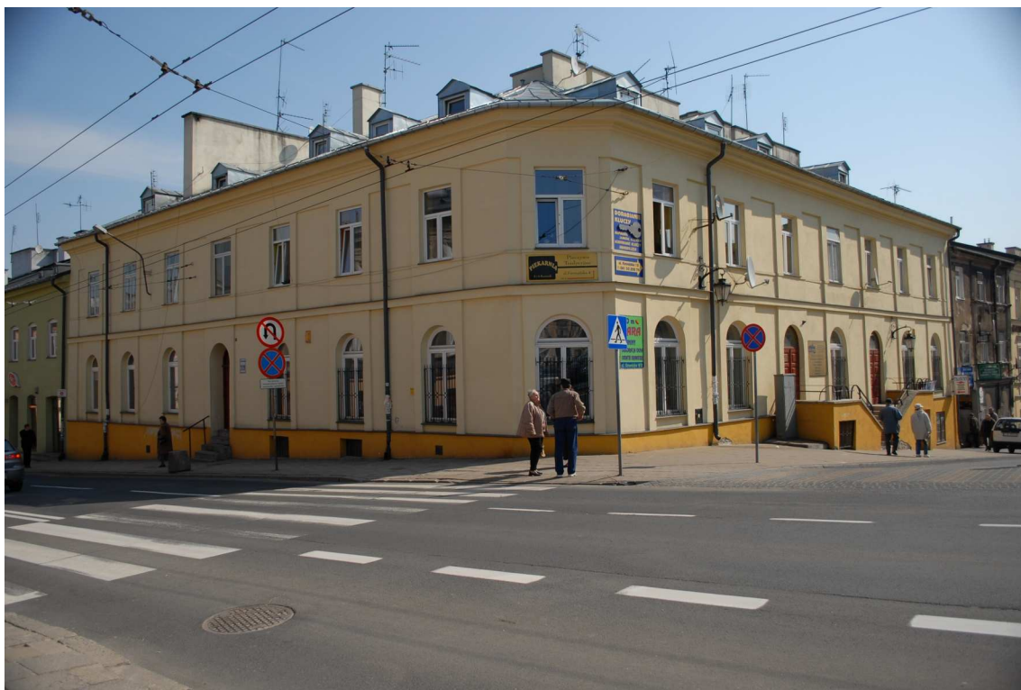
Fasada, Lubartowska 27_29, fot. Piotr Sztajdel, 2010.