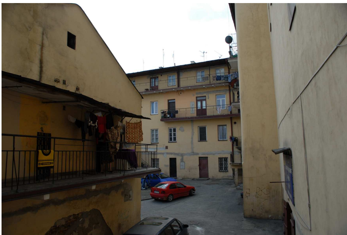
Podwórko, Lubartowska 27_29, fot. Piotr Sztajdel, 2010.