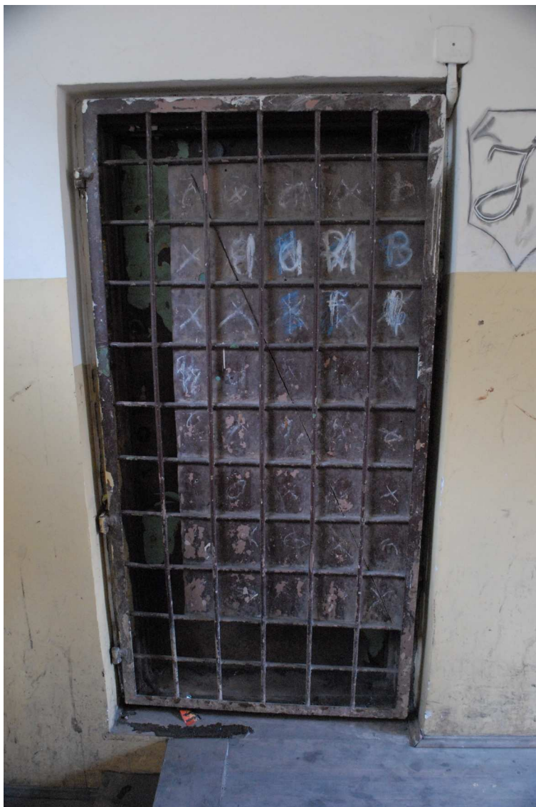
Klatka schodowa, Lubartowska 27_29, fot. Piotr Sztajdel, 2010.