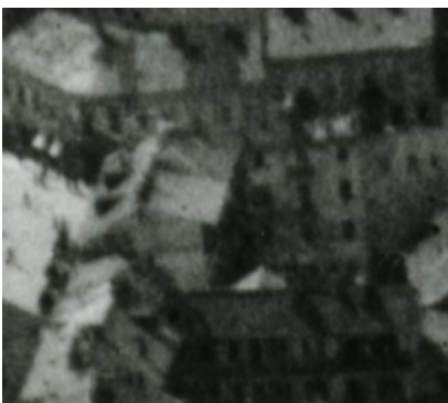
Fragment panoramy Lublina, lata 30., Lubartowska 1/A fragment of panorama of Lublin in the 1930s, Lubartowska 1,