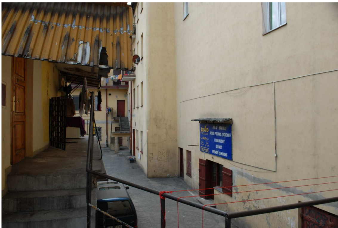
Podwórko, Lubartowska 27_29, fot. Piotr Sztajdel, 2010.