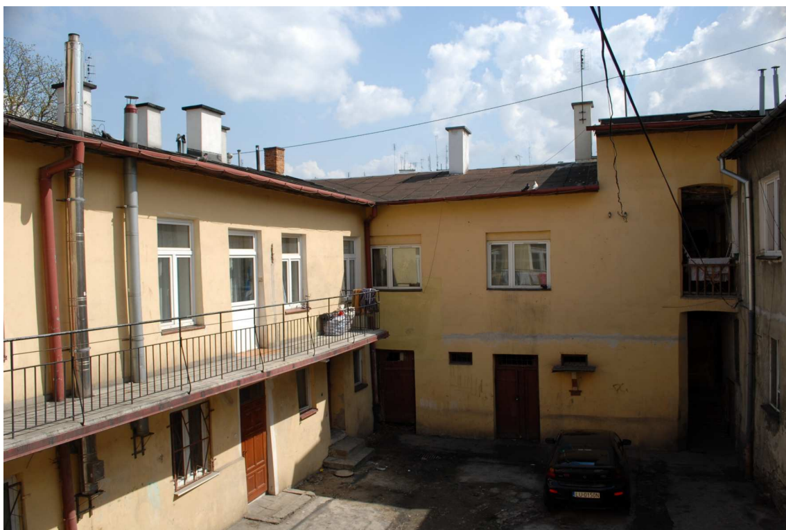
Podwórko, Lubartowska 27_29, fot. Piotr Sztajdel, 2010.