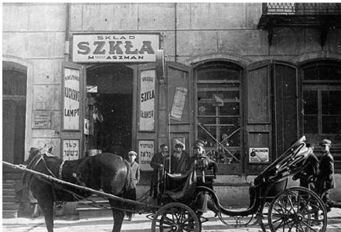
Lubartowska 3, autor Stefan Kielsznia, ok 1938, własność Jerzego Kielszni.