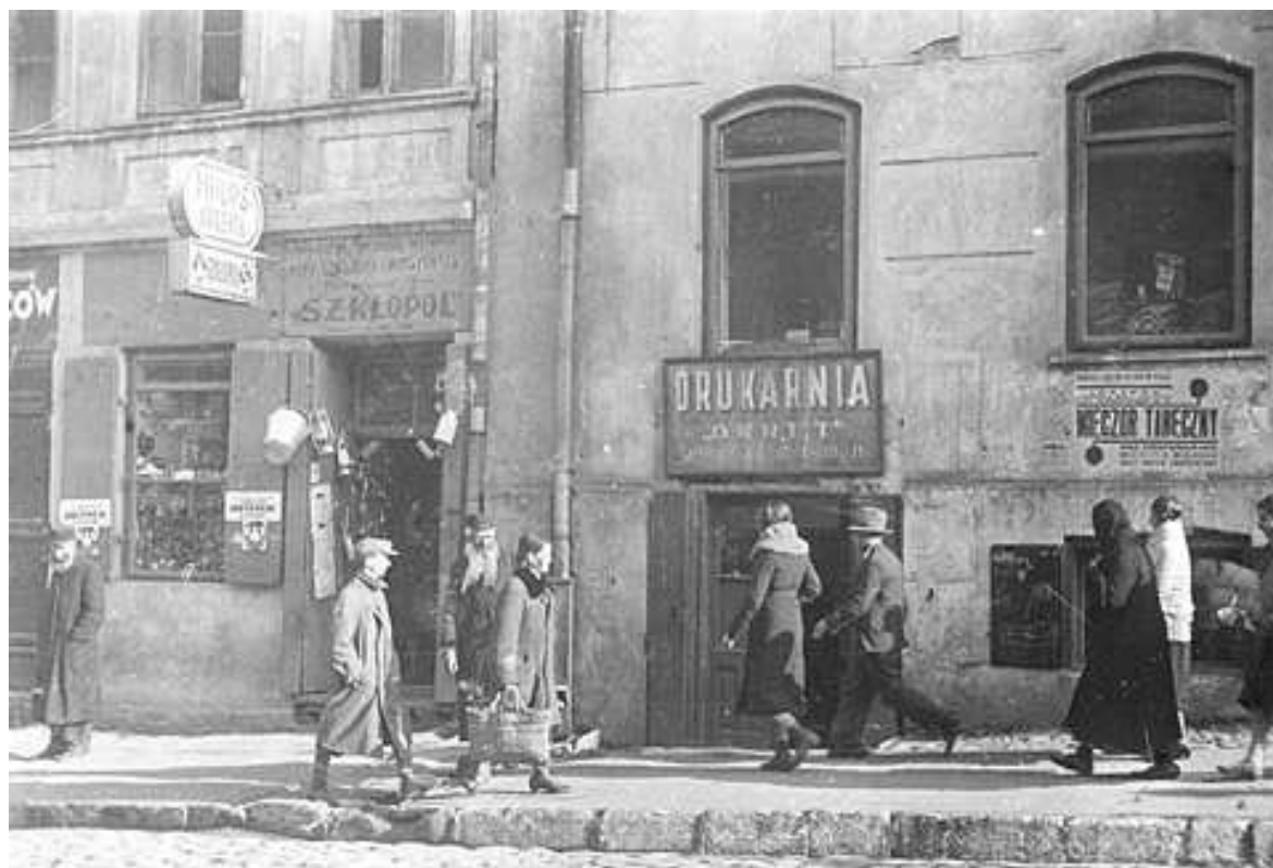
Lubartowska 3 i 5, autor Stefan Kielsznia, ok 1938, własność Jerzego Kielszni.