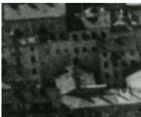
Fragment panoramy Lublina, lata 30., Lubartowska 3/A fragment of panorama of Lublin in the 1930s, Lubartowska 3,