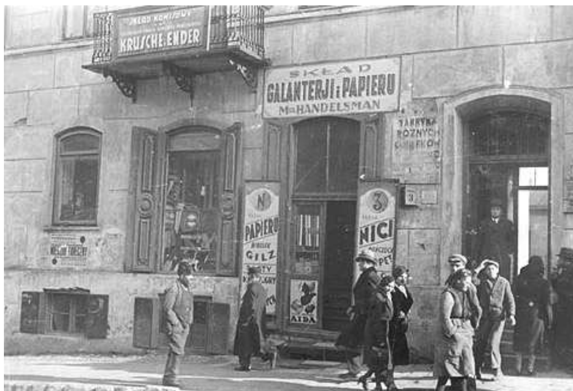
Lubartowska 3, autor Stefan Kielsznia, ok 1938, własność Jerzego Kielszni.