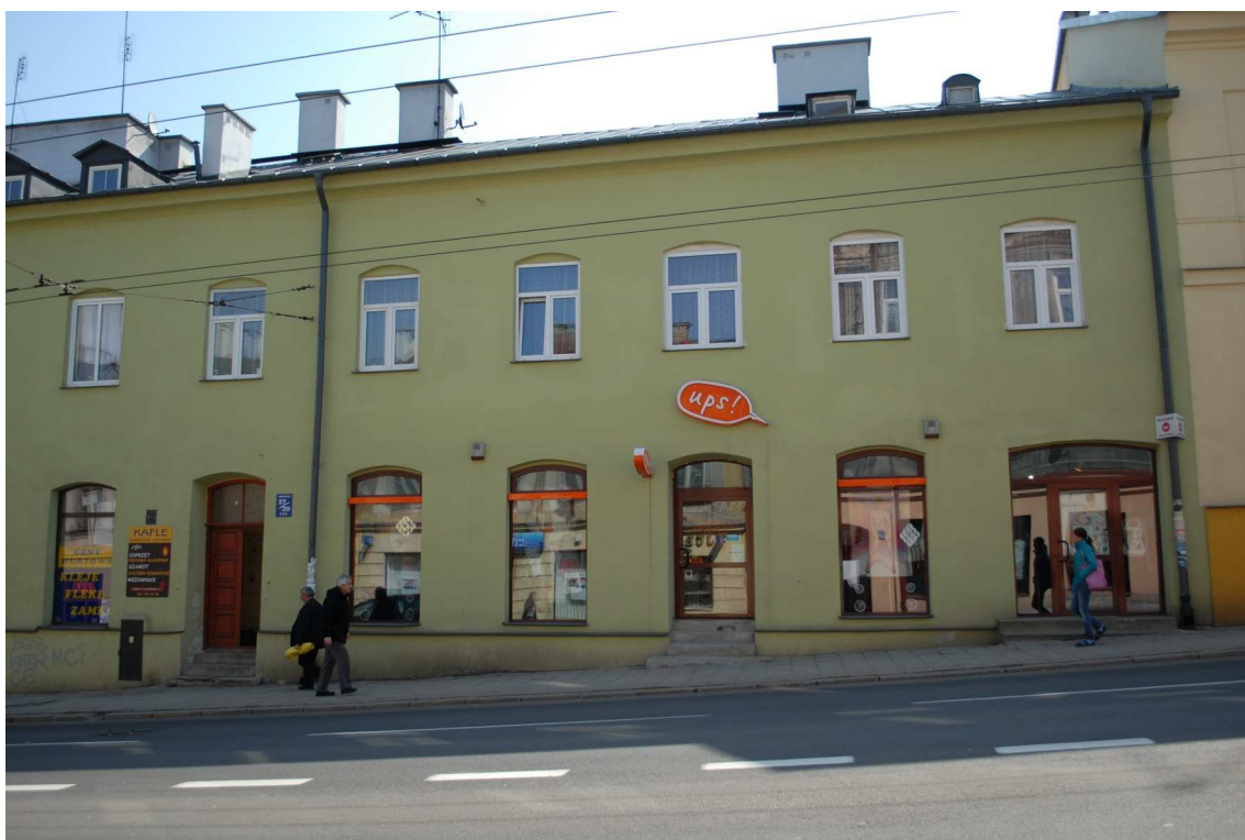
Fasada, Lubartowska 27/29 dawna Lubartowska 3, fot. Piotr Sztajdel, 2010.