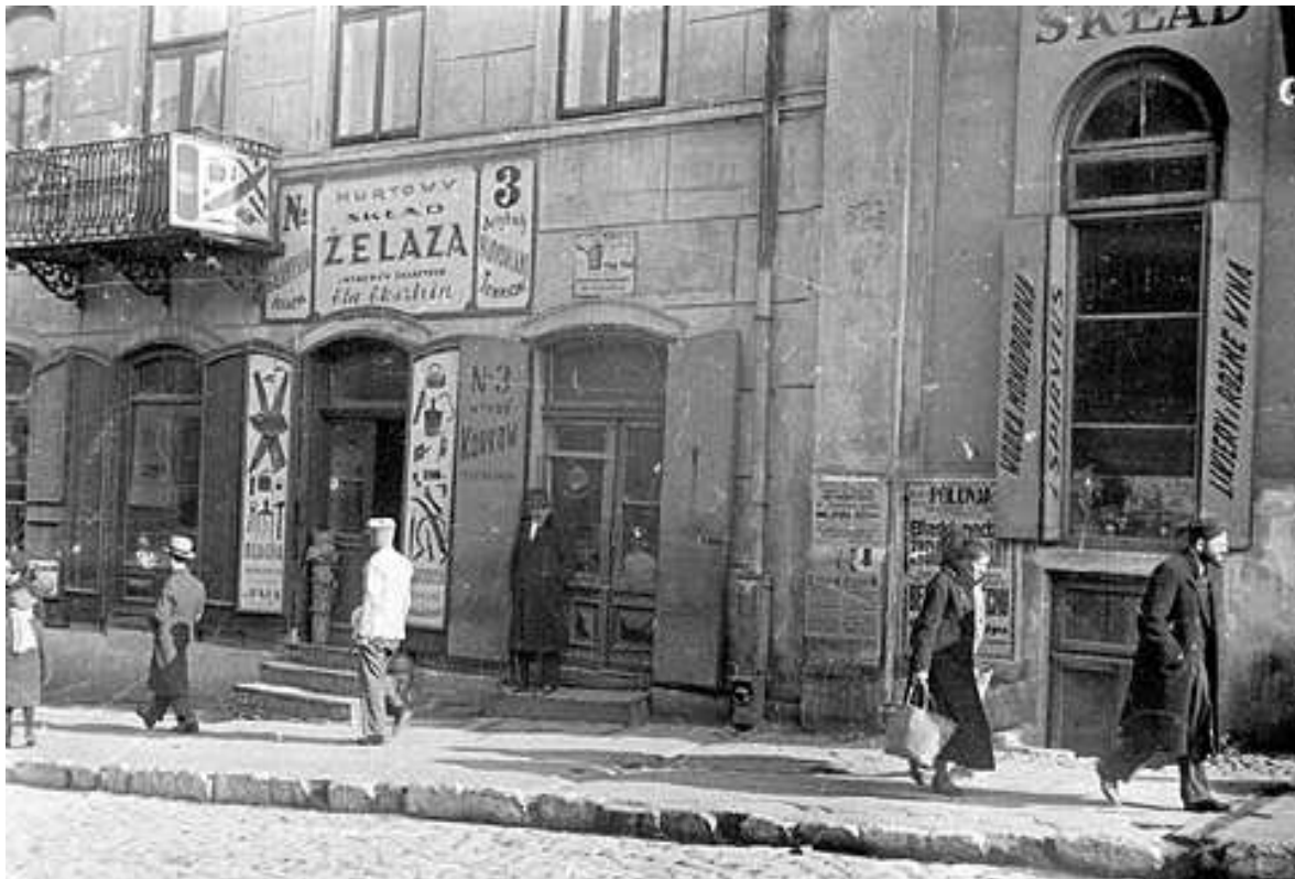
Lubartowska 3, autor Stefan Kielsznia, ok 1938, własność Jerzego Kielszni.