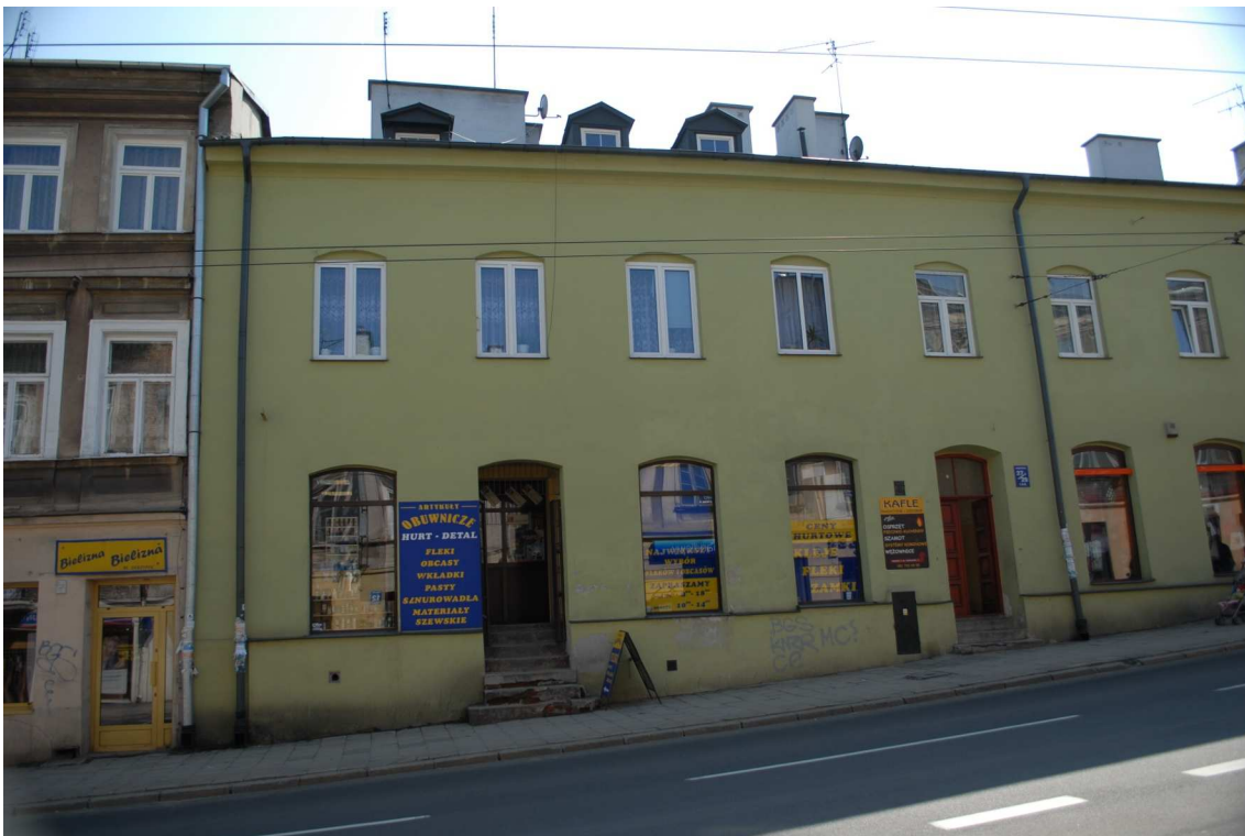
Fasada, Lubartowska 27/29 dawna Lubartowska 3, fot. Piotr Sztajdel, 2010.