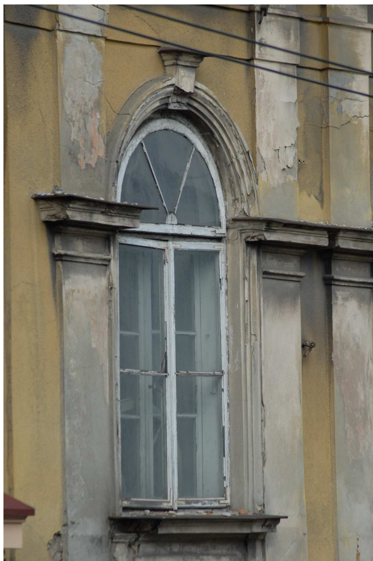
Detal, Lubartowska 10 dawna Lubartowska 4, fot. Piotr Sztajdel, 2010.