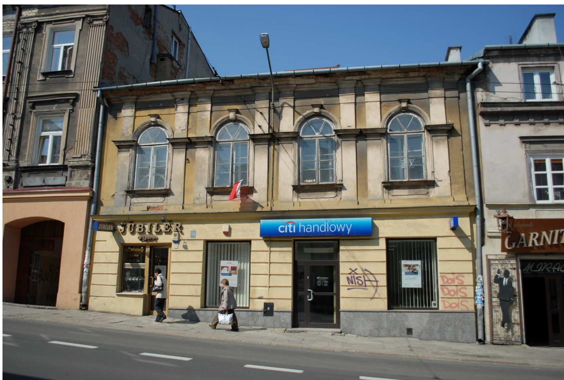
Fasada, Lubartowska 10 dawna Lubartowska 4, fot. Piotr Sztajdel, 2010.