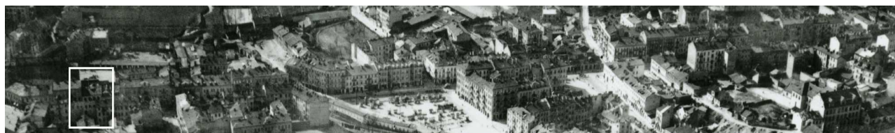
Fragment panoramy Lublina, lata 30., ul. Lubartowska/A fragment of panorama of Lublin in the 1930s, Lubartowska street,