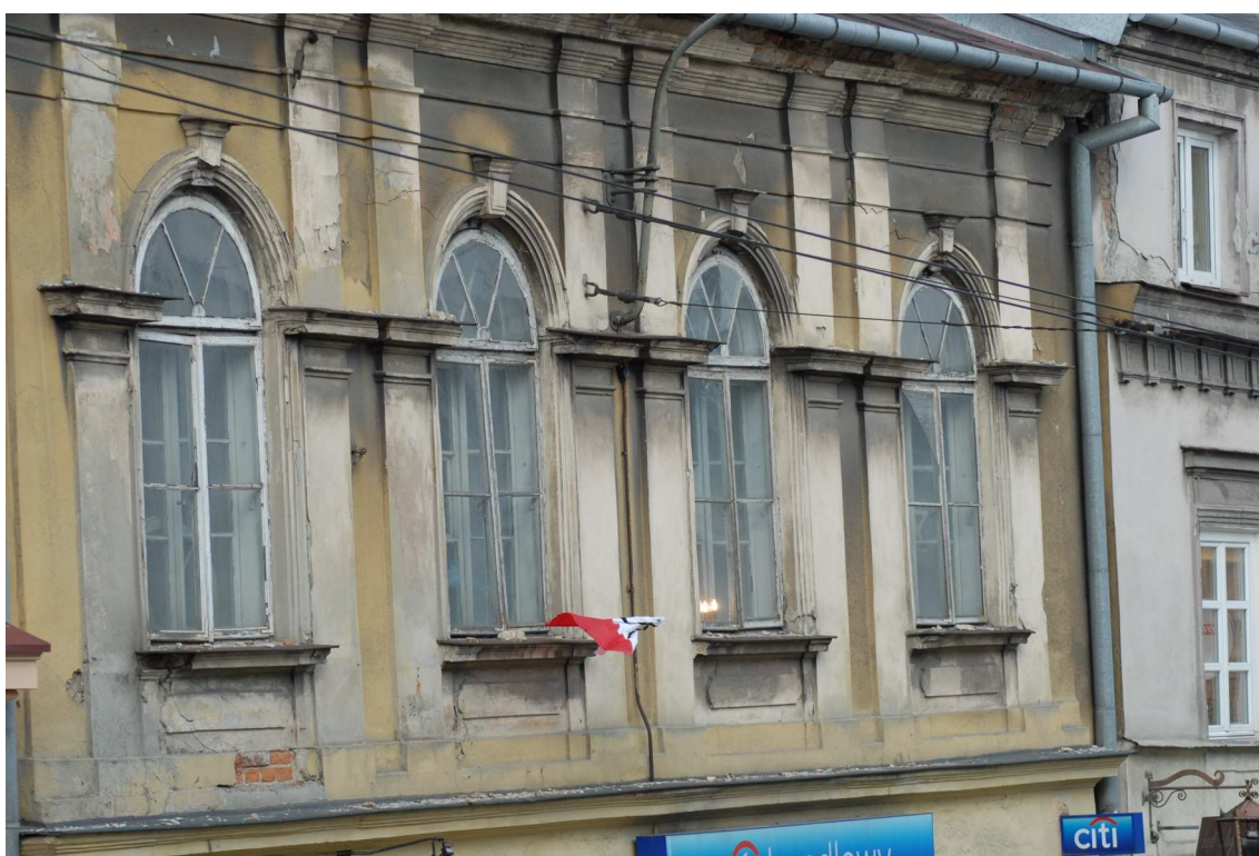
Fasada fragment, Lubartowska 10 dawna Lubartowska 4 , fot. Piotr Sztajdel, 2010.