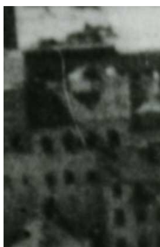
Fragment panoramy Lublina, lata 30., Lubartowska 4/A fragment of panorama of Lublin in the 1930s, Lubartowska 4,