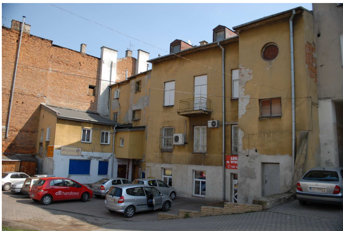
Podwórko, Lubartowska 10 dawna Lubartowska 4, fot. Piotr Sztajdel, 2010.