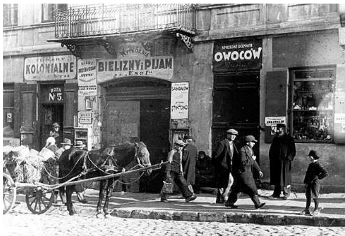
Lubartowska 5, autor Stefan Kielsznia, ok 1938, własność Jerzego Kielszni.