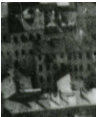
Fragment panoramy Lublina, lata 30., Lubartowska 5/A fragment of panorama of Lublin in the 1930s, Lubartowska 5,