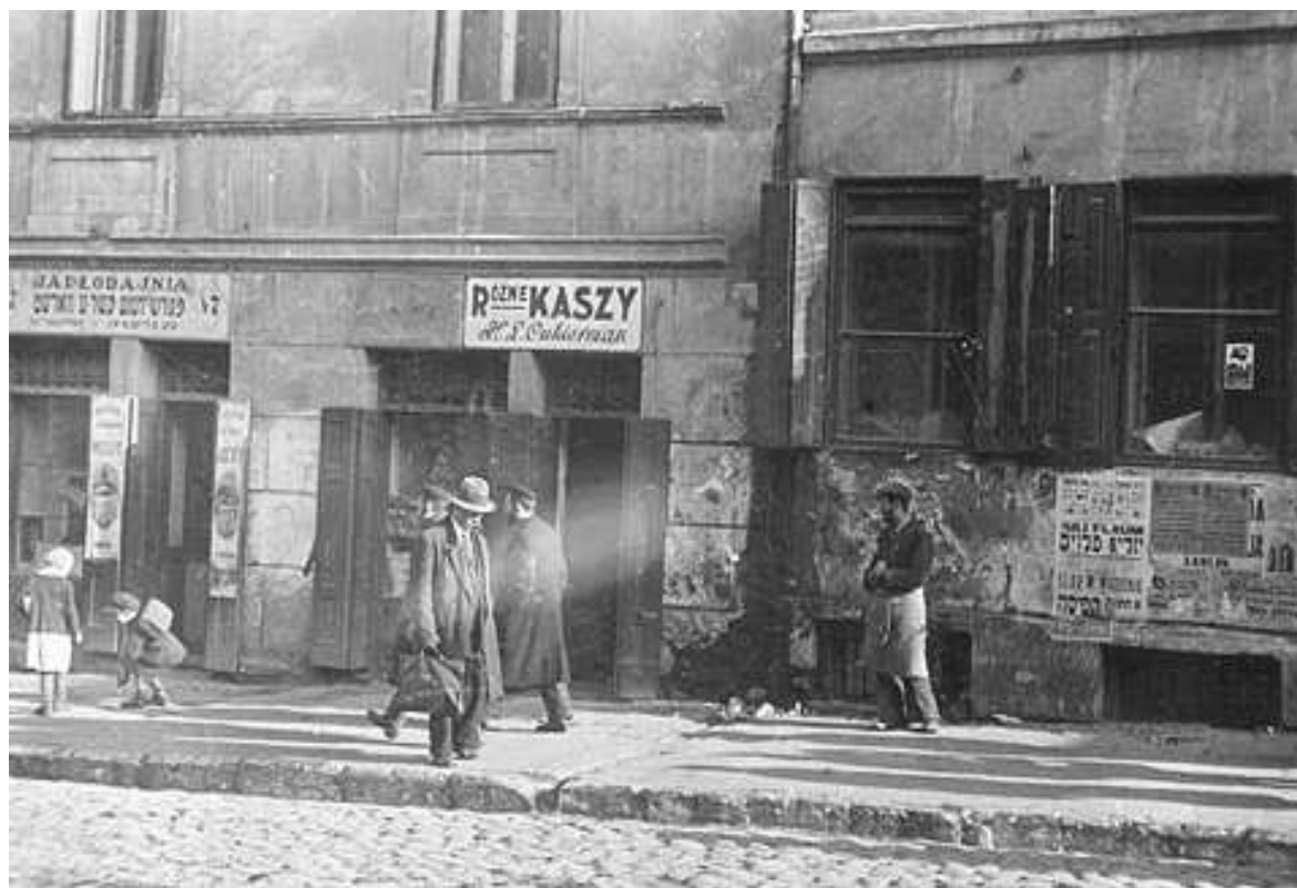
Ulica Lubartowska 5 i 7, autor Stefan Kielsznia, ok 1938, własność Jerzego Kielszni.