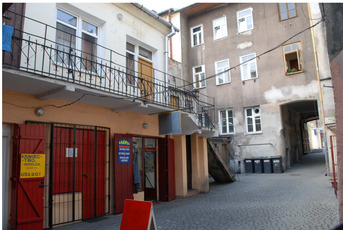
Podwórko, Lubartowska 31 dawna Lubartowska 5, fot. Piotr Sztajdel, 2010.