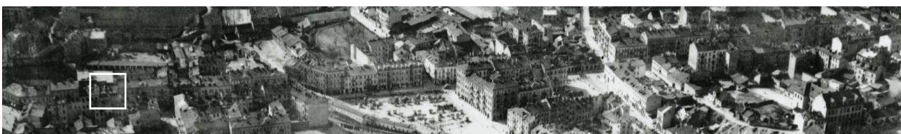
Fragment panoramy Lublina, lata 30., ul. Lubartowska/A fragment of panorama of Lublin in the 1930s, Lubartowska street,