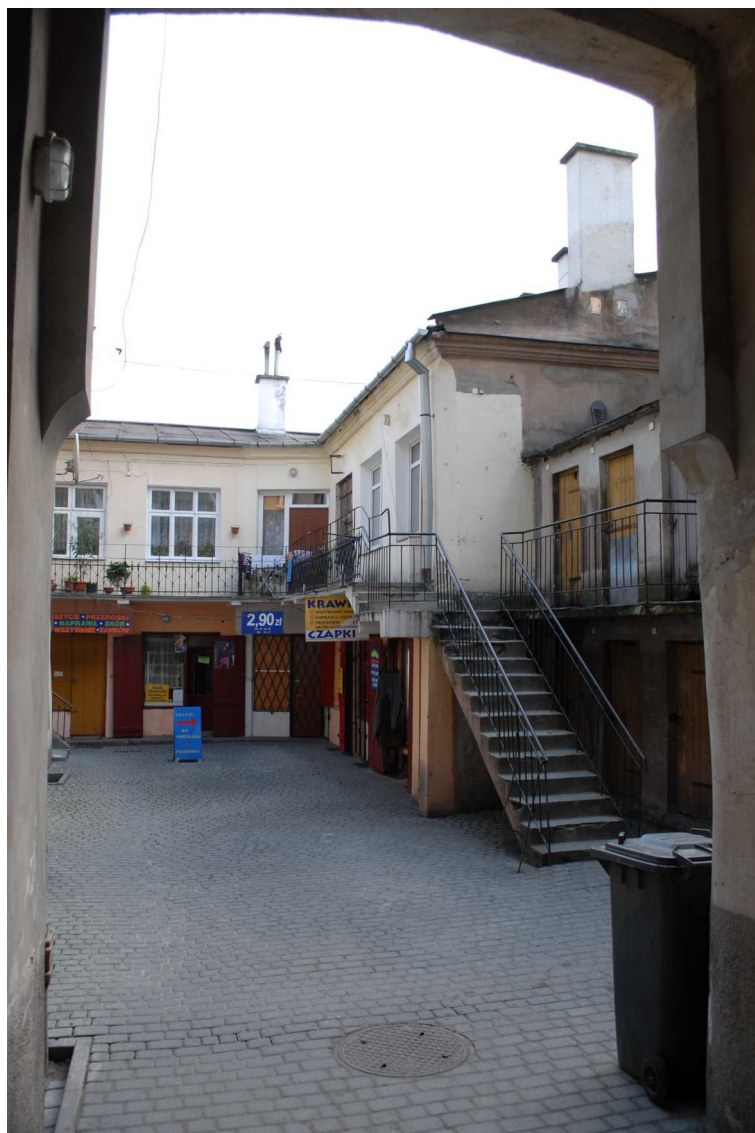
Podwórko, Lubartowska 31 dawna Lubartowska 5, fot. Piotr Sztajdel, 2010.