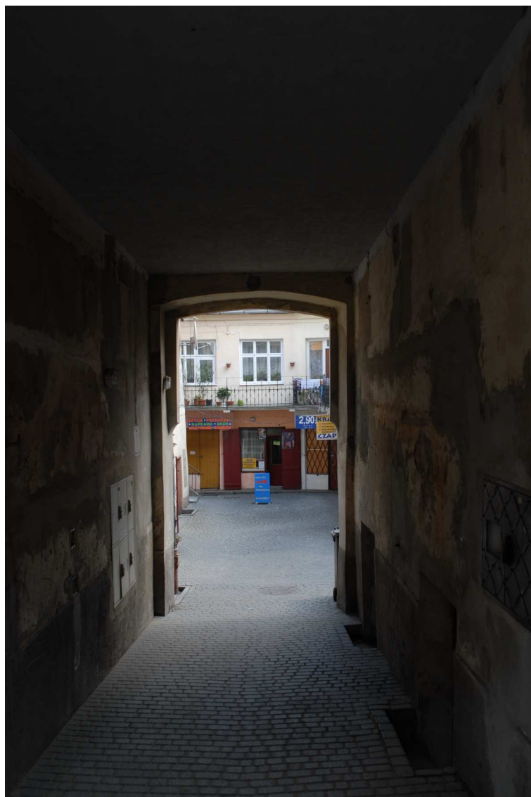
Podwórko, Lubartowska 31 dawna Lubartowska 5, fot. Piotr Sztajdel, 2010.