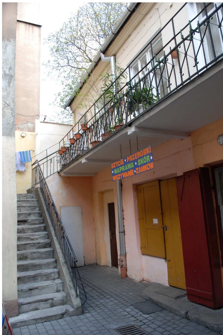
Podwórko, Lubartowska 31 dawna Lubartowska 5, fot. Piotr Sztajdel, 2010.