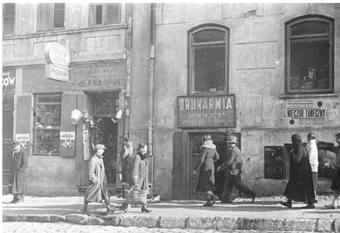
Lubartowska 3 i 5, autor Stefan Kielsznia, ok 1938, własność Jerzego Kielszni.