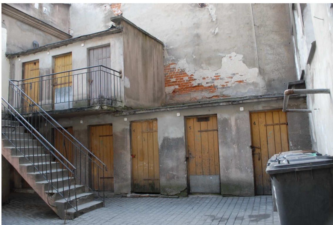
Podwórko, Lubartowska 31 dawna Lubartowska 5, fot. Piotr Sztajdel, 2010.