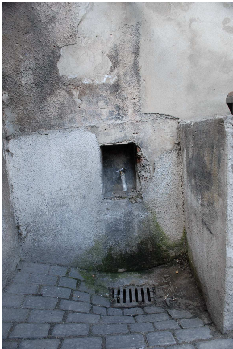
Podwórko, Lubartowska 31 dawna Lubartowska 5, fot. Piotr Sztajdel, 2010.