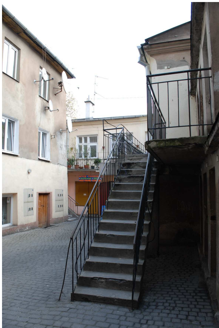
Podwórko, Lubartowska 31 dawna Lubartowska 5, fot. Piotr Sztajdel, 2010.