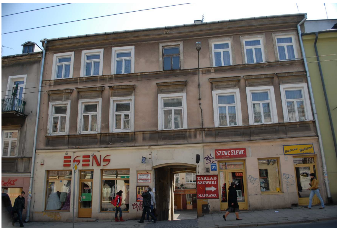
Fasada, Lubartowska 31 dawna Lubartowska 5, 2010.