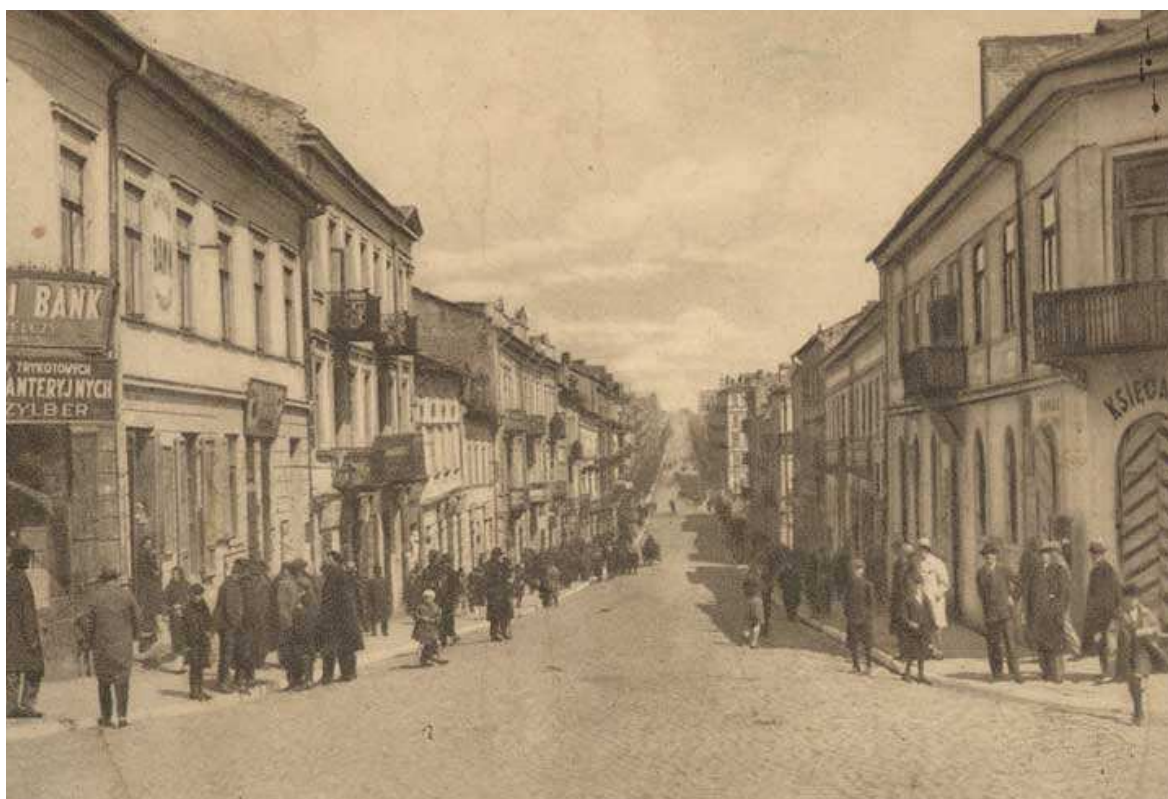
Lubartowska 6, kamienica czwarta od lewej, autor Ludwik Hartwig, ok. 1930, kolekcja Zbigniewa Lemiecha.