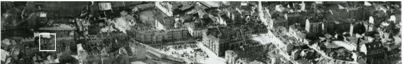
Fragment panoramy Lublina, lata 30., ul. Lubartowska/A fragment of panorama of Lublin in the 1930s, Lubartowska street,