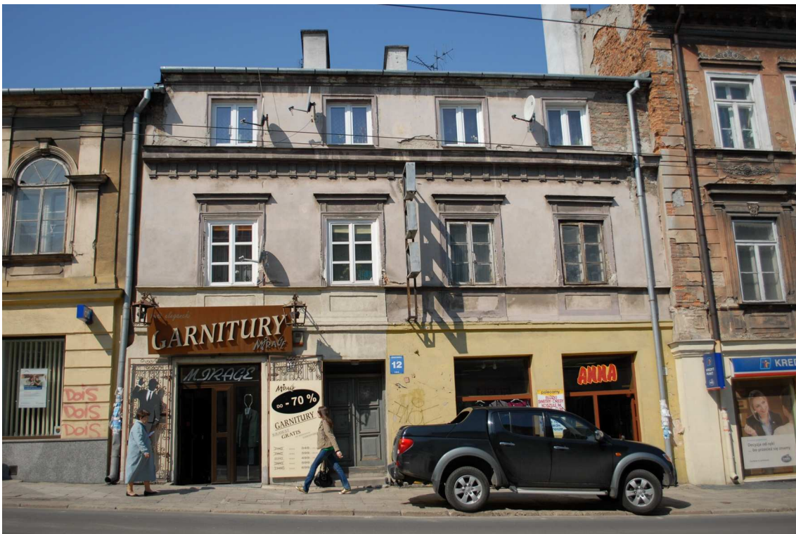
Fasada, Lubartowska 12 dawna Lubartowska 6, fot. Piotr Sztajdel, 2010.