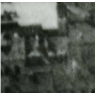
Fragment panoramy Lublina, lata 30., Lubartowska 6/A fragment of panorama of Lublin in the 1930s, Lubartowska 6,