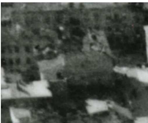
Fragment panoramy Lublina, lata 30., Lubartowska 7/A fragment of panorama of Lublin in the 1930s, Lubartowska 7,