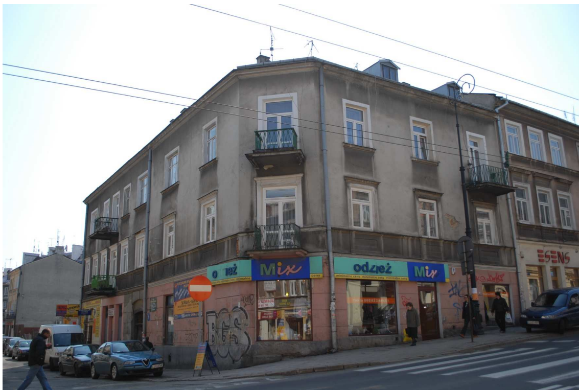
Fasada, Lubartowska 33 dawna Lubartowska 7, 2010.