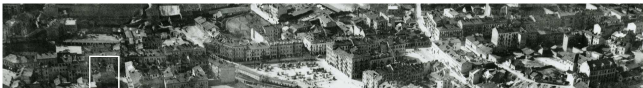
Fragment panoramy Lublina, lata 30., ul. Lubartowska/A fragment of panorama of Lublin in the 1930s, Lubartowska street,