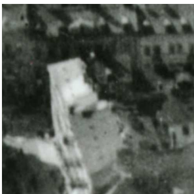
Fragment panoramy Lublina, lata 30., Lubartowska 9/A fragment of panorama of Lublin in the 1930s, Lubartowska 9,