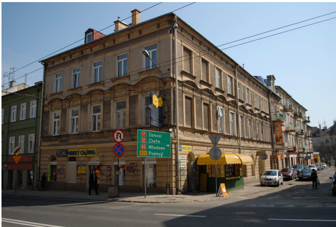
Fasada, Lubartowska 35 dawna Lubartowska 35, fot. Piotr Sztajdel, 2010.