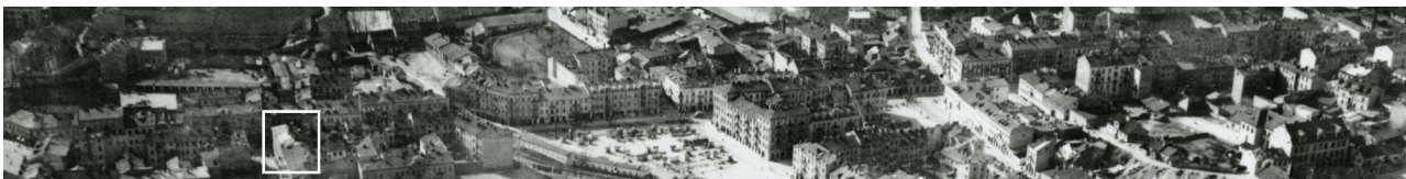
Fragment panoramy Lublina, lata 30., ul. Lubartowska/A fragment of panorama of Lublin in the 1930s, Lubartowska street,