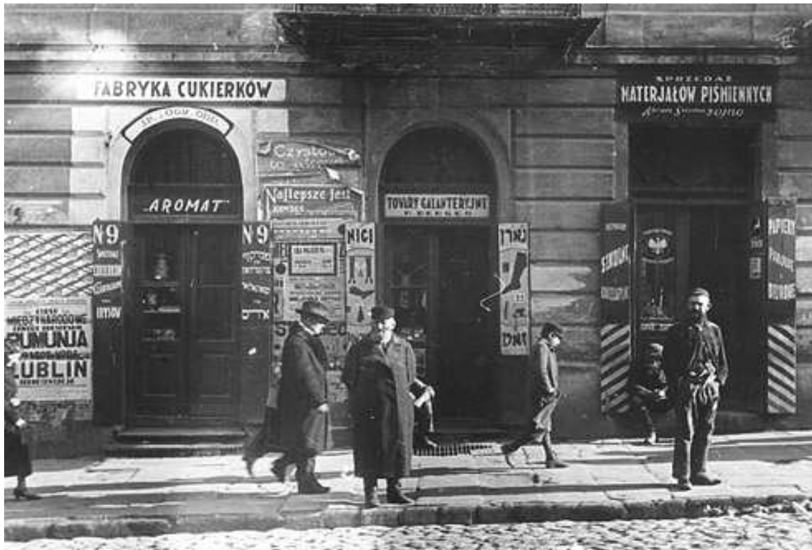
Lubartowska 9, autor Stefan Kielsznia, ok 1938, własność Jerzego Kielszni.