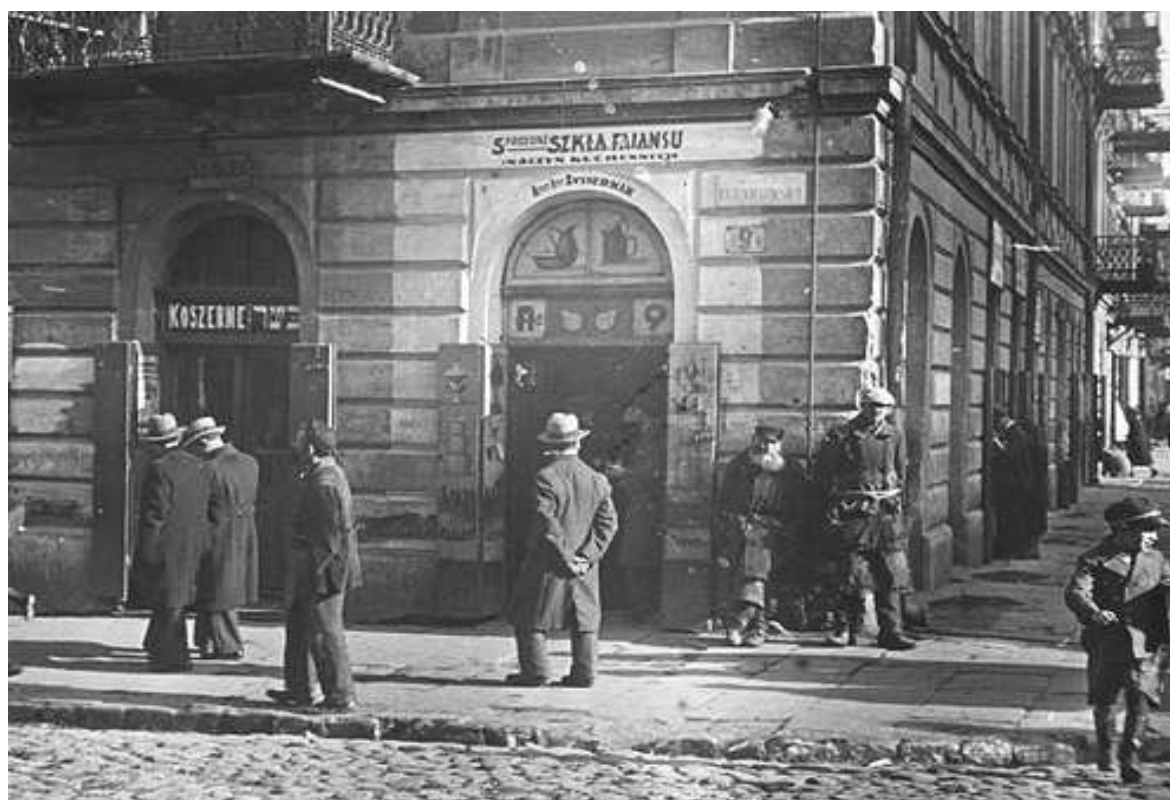
Róg Lubartowskiej 9 i Cyrulicznej 2, autor Stefan Kielsznia, ok 1938, własność Jerzego Kielszni.