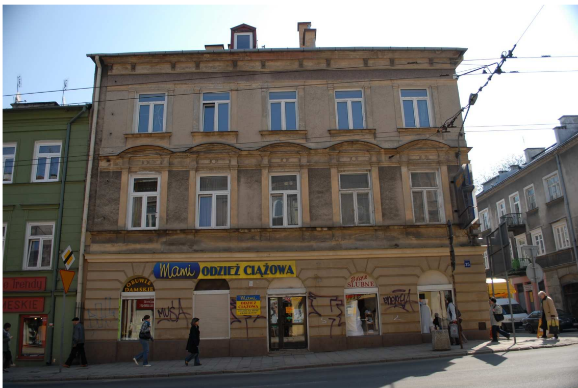
Fasada, Lubartowska 35 dawna Lubartowska 35, 2010.