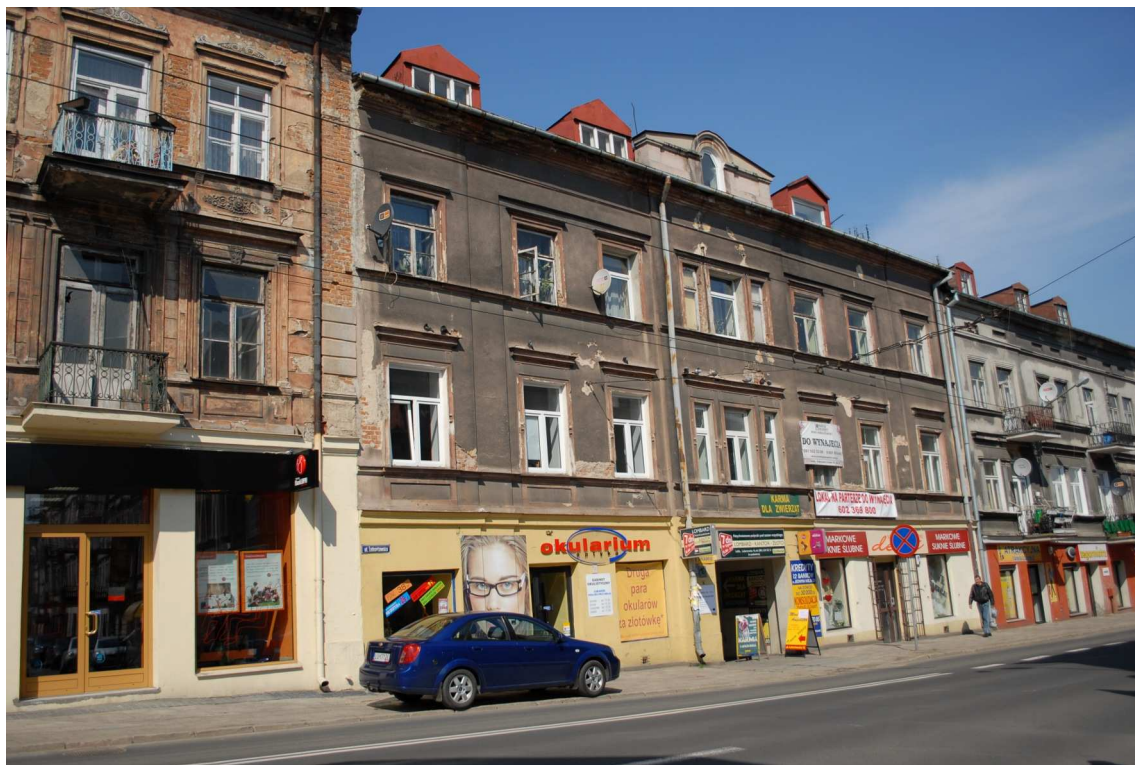
Fasada, Lubartowska 16 dawna Lubartowska 10, fot. Piotr Sztajdel, 2010.