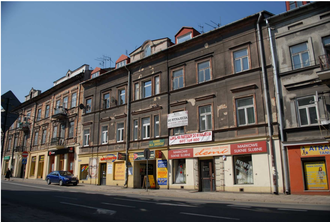
Fasada, Lubartowska 16 dawna Lubartowska 10, 2010.