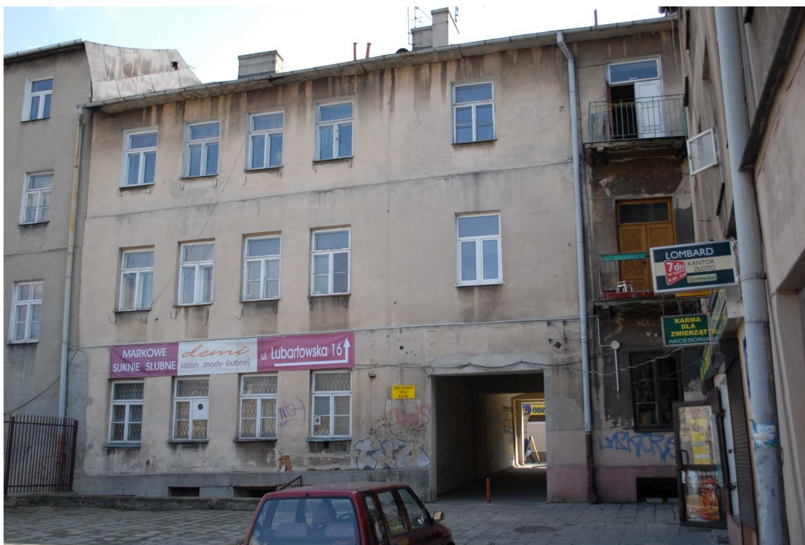
Podwórko, Lubartowska 16 dawna Lubartowska 10, fot. Piotr Sztajdel, 2010.