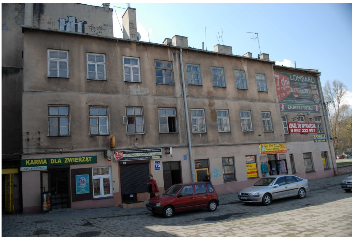
Podwórko, Lubartowska 16 dawna Lubartowska 10, fot. Piotr Sztajdel, 2010.