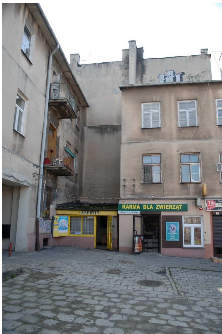
Podwórko, Lubartowska 16 dawna Lubartowska 10, 2010.