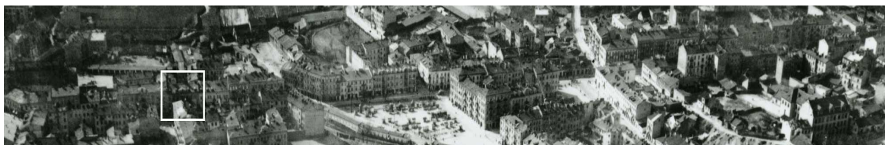
Fragment panoramy Lublina, lata 30., ul. Lubartowska/A fragment of panorama of Lublin in the 1930s, Lubartowska street,