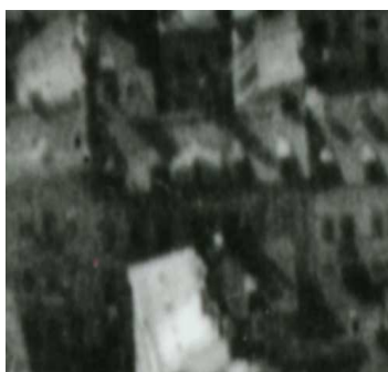
Fragment panoramy Lublina, lata 30., Lubartowska 10/A fragment of panorama of Lublin in the 1930s, Lubartowska 10,