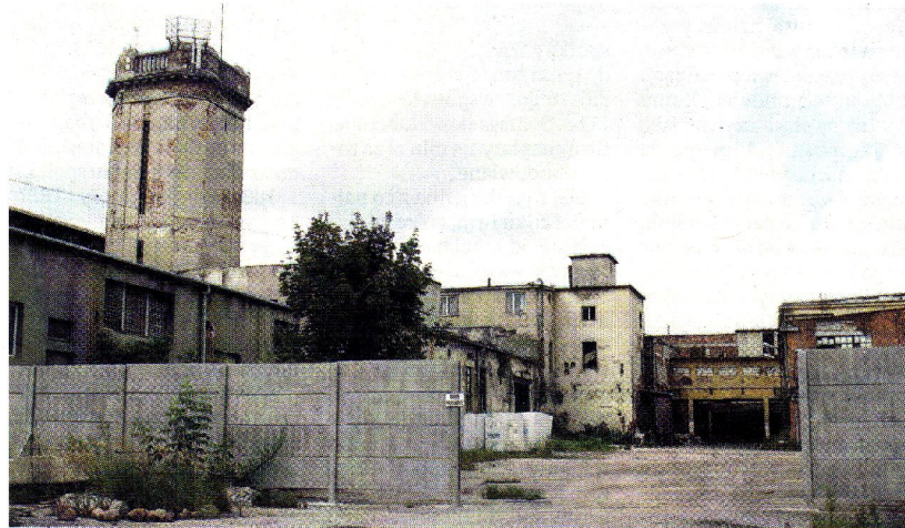
Ul. Zimna 3a. W 1942 roku wywieziono stąd lubelskich Żydów do obozu zagłady