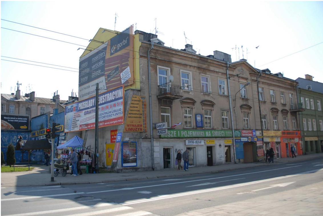
Fasada, Lubartowska 39 dawna Lubartowska 13, fot. Piotr Sztajdel, 2010.