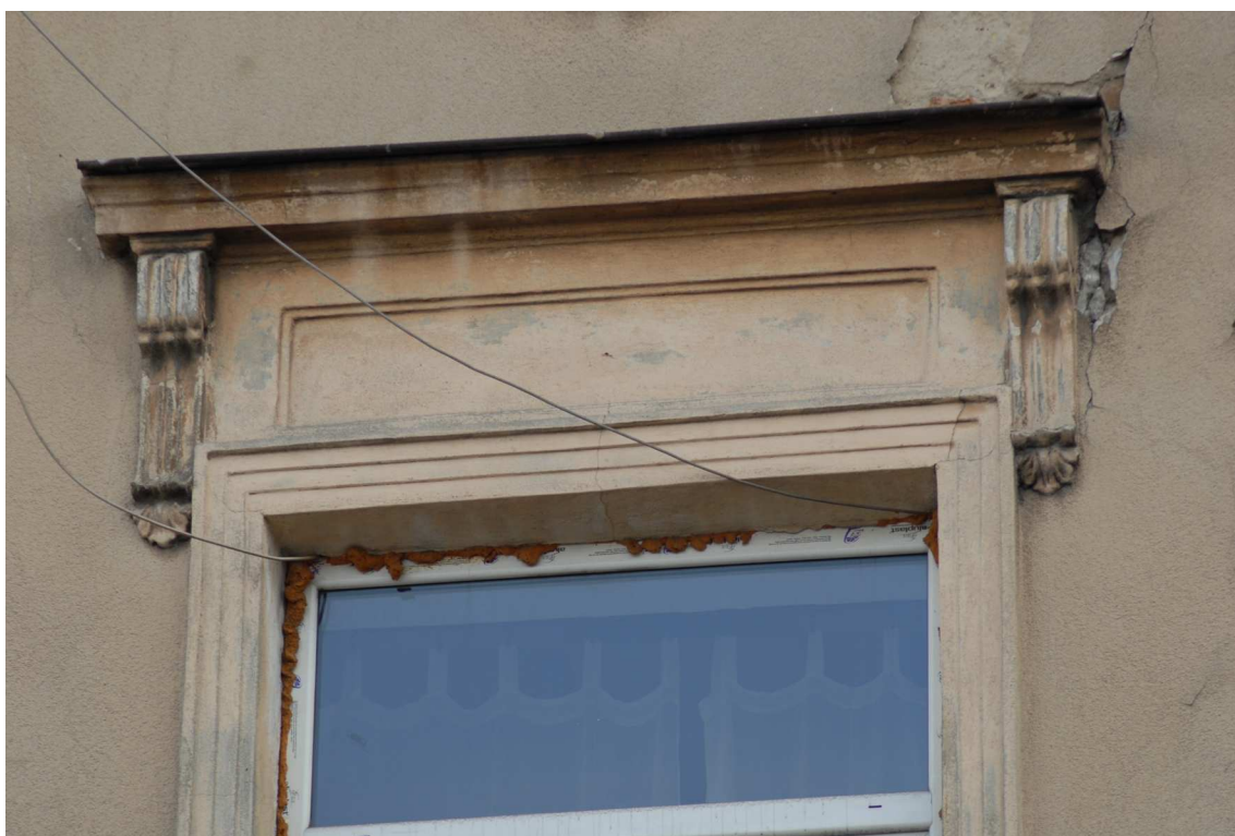
Fasada detale, Lubartowska 39 dawna Lubartowska 13, fot. Piotr Sztajdel, 2010.