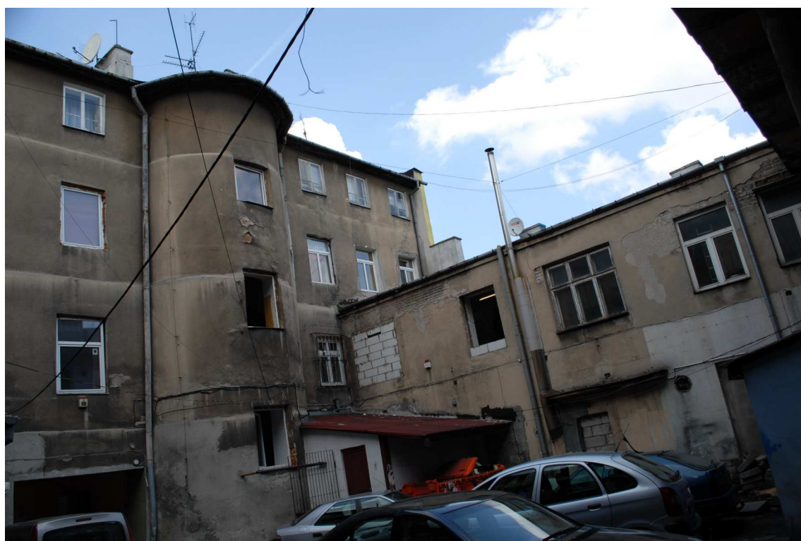
Podwórko, Lubartowska 39 dawna Lubartowska 13, fot. Piotr Sztajdel, 2010.