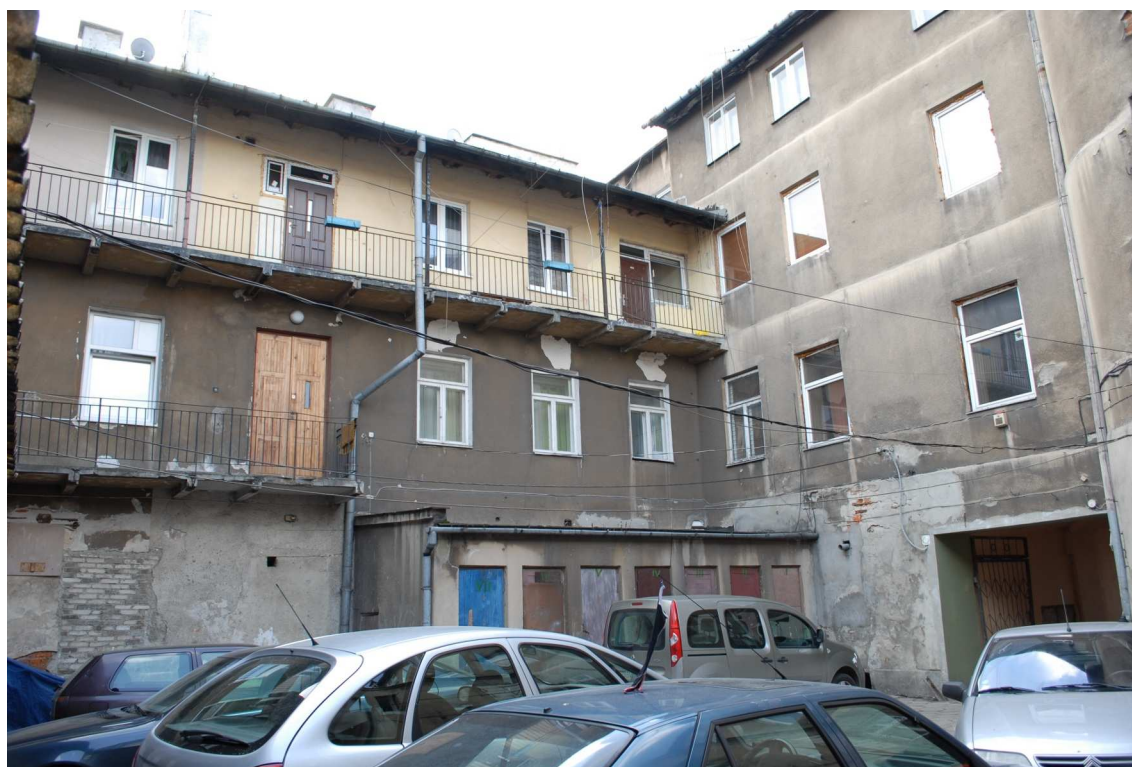
Podwórko, Lubartowska 39 dawna Lubartowska 13, fot. Piotr Sztajdel, 2010.