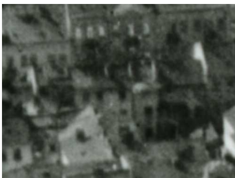
Fragment panoramy Lublina, lata 30., Lubartowska 13/A fragment of panorama of Lublin in the 1930s, Lubartowska 13,