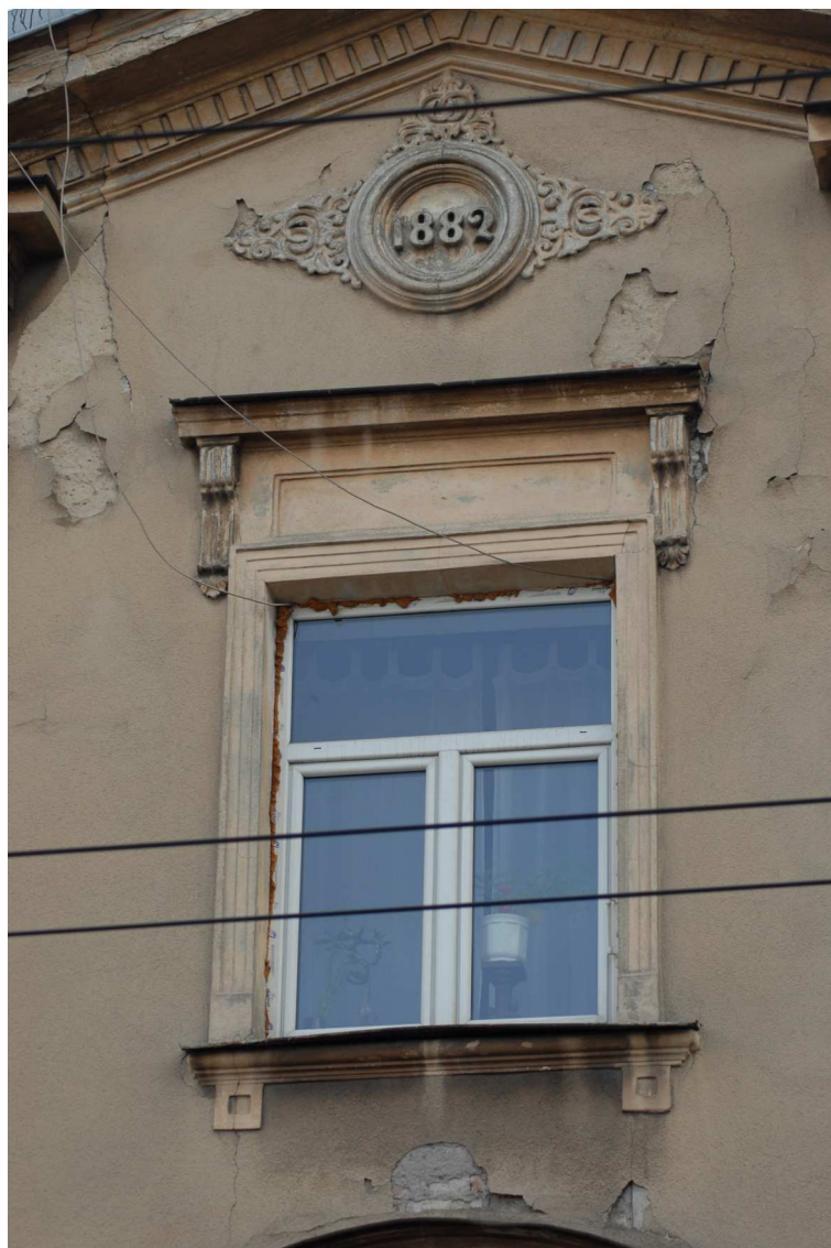
Fasada detale, Lubartowska 39 dawna Lubartowska 13, fot. Piotr Sztajdel, 2010.