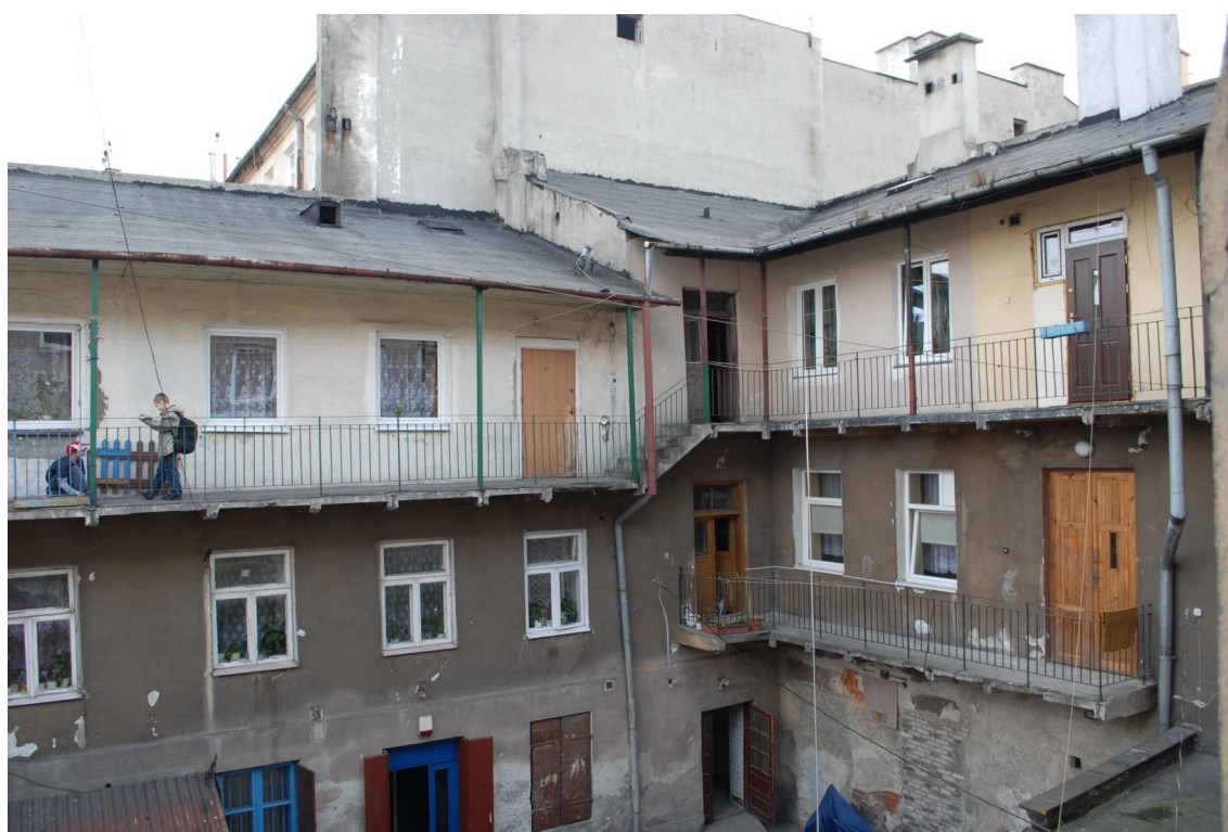
Podwórko, Lubartowska 39 dawna Lubartowska 13, fot. Piotr Sztajdel, 2010.