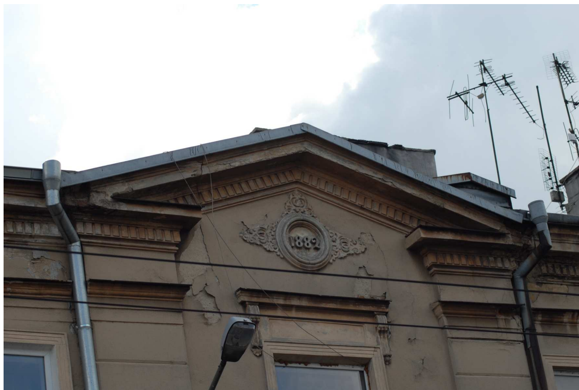
Fasada detale, Lubartowska 39 dawna Lubartowska 13, fot. Piotr Sztajdel, 2010.