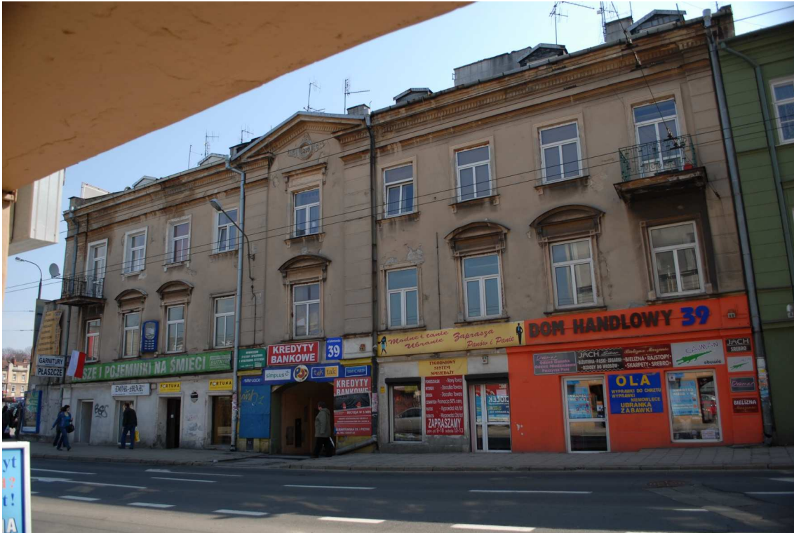
Fasada, Lubartowska 39 dawna Lubartowska 13, fot. Piotr Sztajdel, 2010.