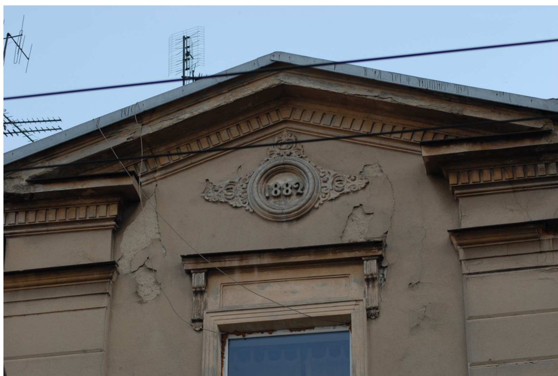
Fasada detale, Lubartowska 39 dawna Lubartowska 13, fot. Piotr Sztajdel, 2010.