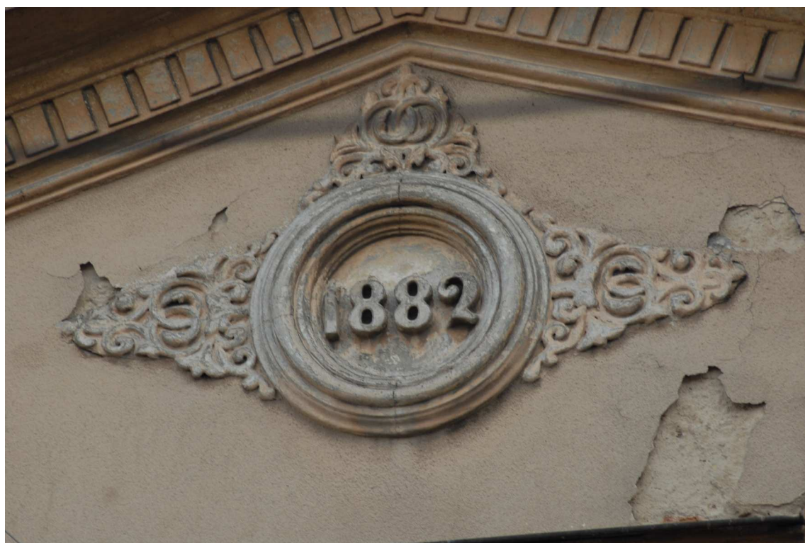
Fasada detale, Lubartowska 39 dawna Lubartowska 13, fot. Piotr Sztajdel, 2010.