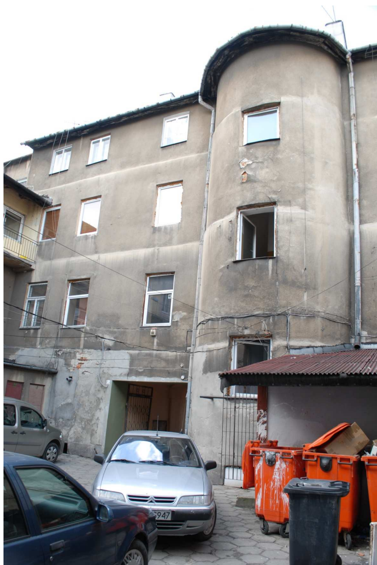
Podwórko, Lubartowska 39 dawna Lubartowska 13, fot. Piotr Sztajdel, 2010.