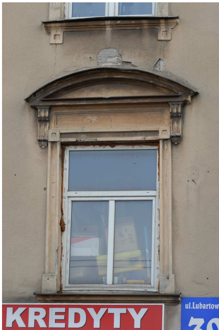
Fasada detale, Lubartowska 39 dawna Lubartowska 13, fot. Piotr Sztajdel, 2010.