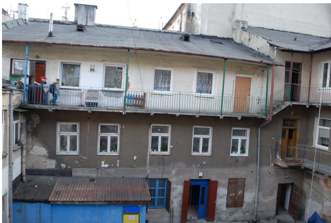
Podwórko, Lubartowska 39 dawna Lubartowska 13, fot. Piotr Sztajdel, 2010.