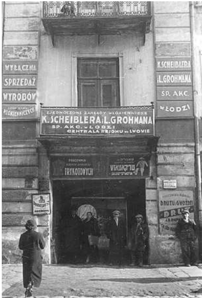
Lubartowska 13, autor Stefan Kielsznia, ok 1938, własność Jerzego Kielszni.