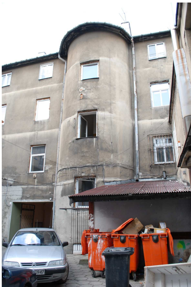
Podwórko, Lubartowska 39 dawna Lubartowska 13, fot. Piotr Sztajdel, 2010.