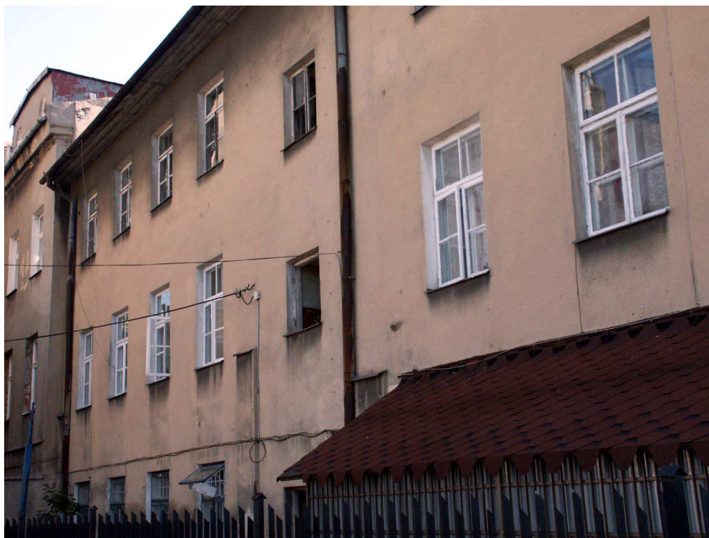
Podwórko, Lubartowska 16 dawna Lubartowska 22, fot. Piotr Sztajdel, 2003.