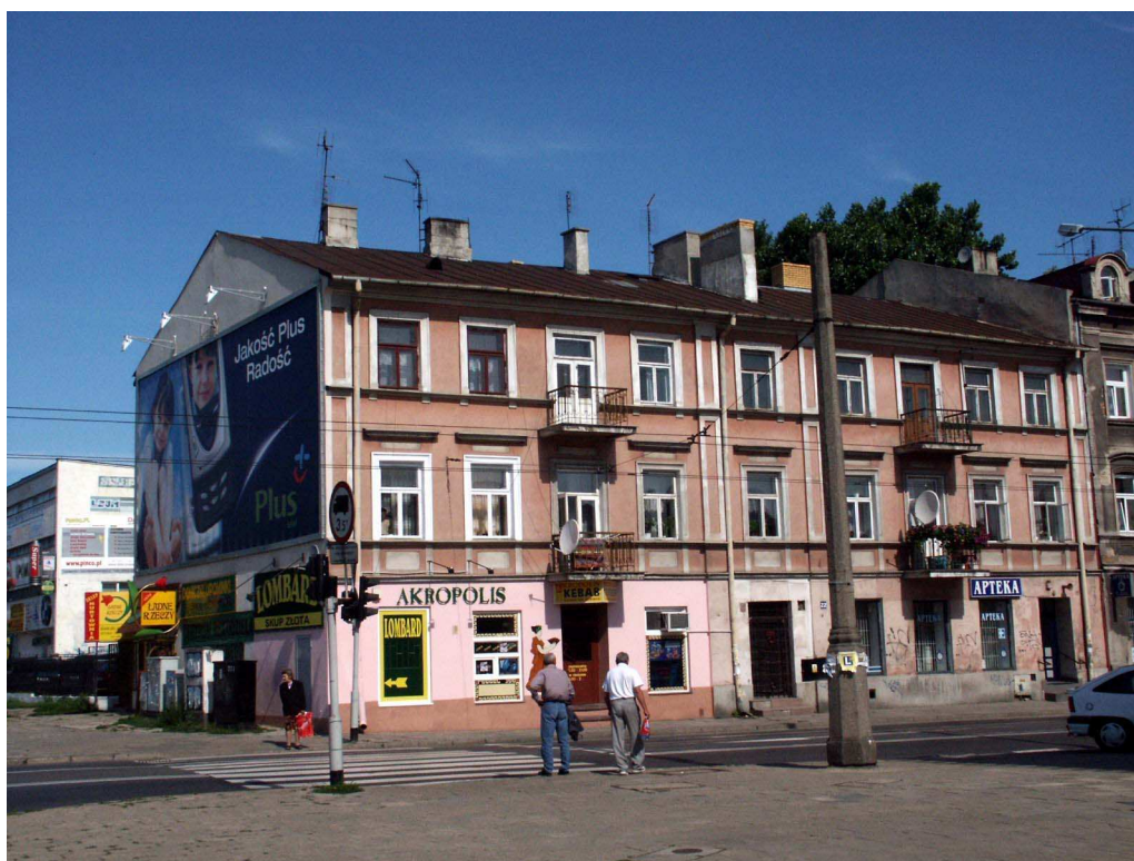
Fasada, Lubartowska 16 dawna Lubartowska 22 fot. Piotr Sztajdel, 2003.