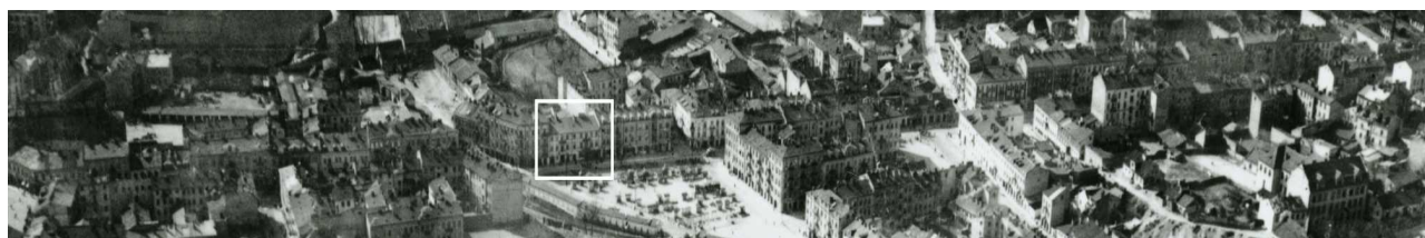
Fragment panoramy Lublina, lata 30., ul. Lubartowska/A fragment of panorama of Lublin in the 1930s, Lubartowska street,