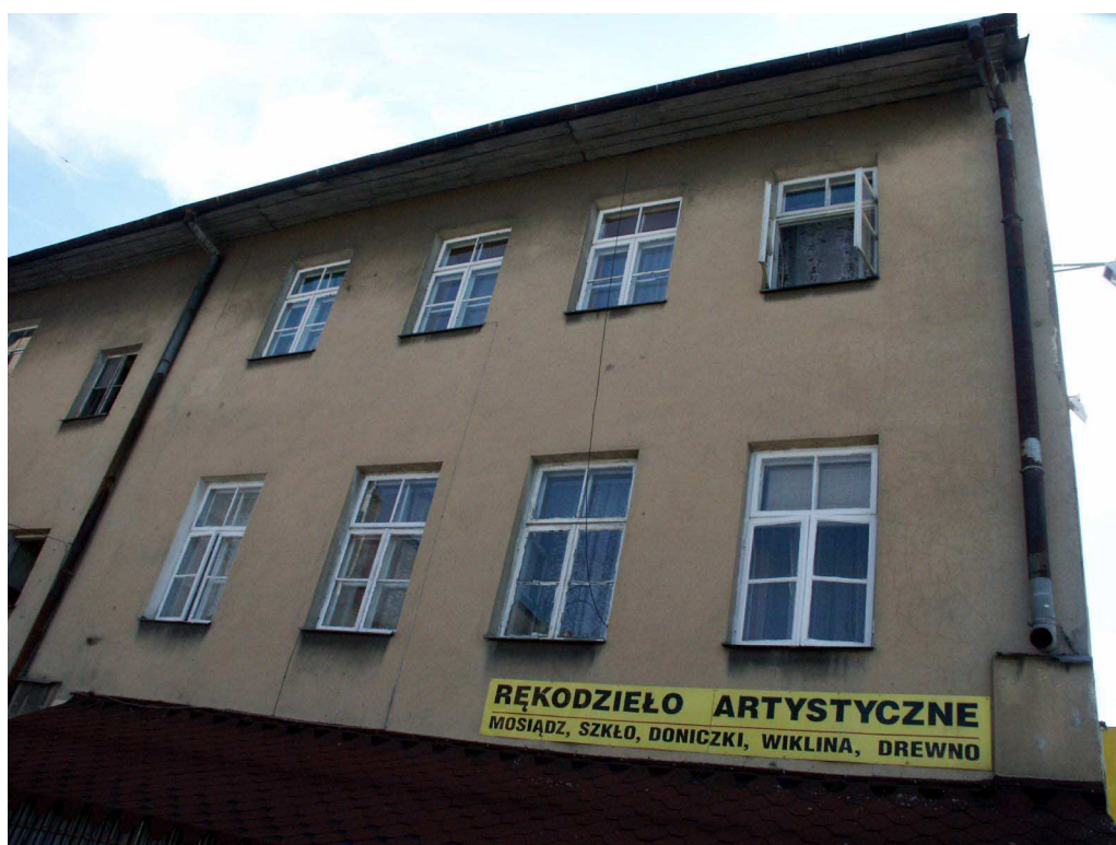
Podwórko, Lubartowska 16 dawna Lubartowska 22, fot. Piotr Sztajdel, 2003.