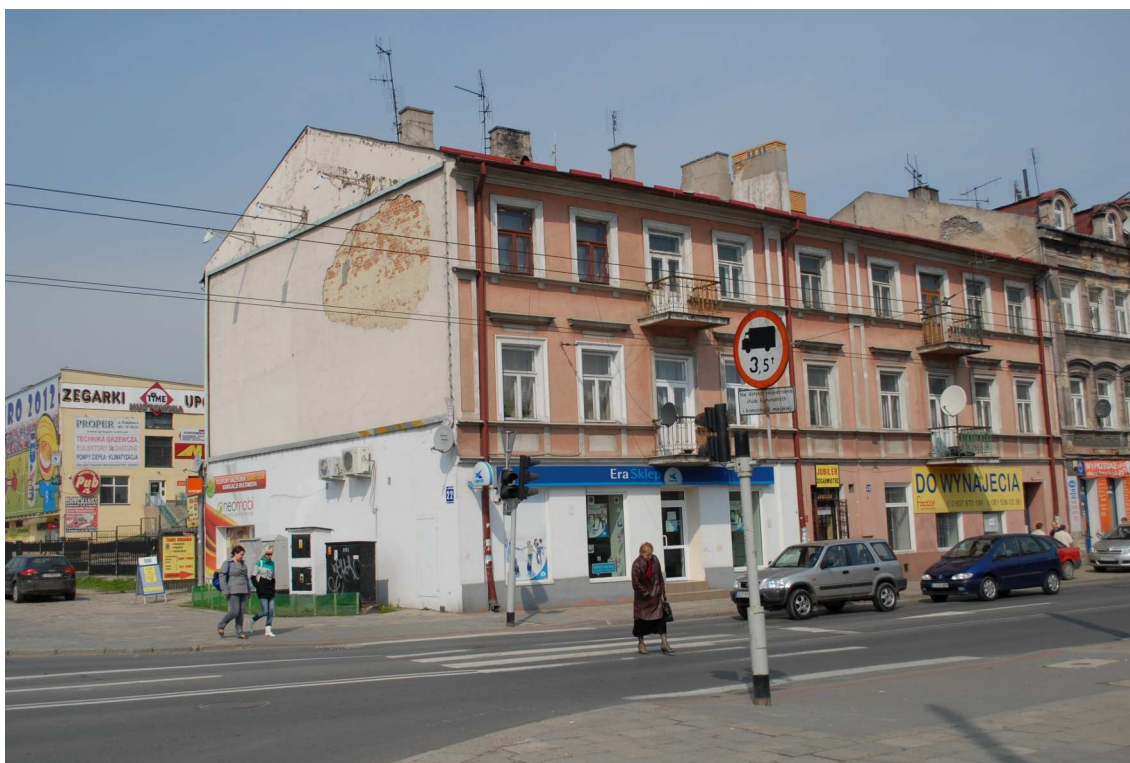
Fasada, Lubartowska 16 dawna Lubartowska 22, fot. Piotr Sztajdel, 2010.