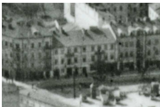
Fragment panoramy Lublina, lata 30., Lubartowska 16/A fragment of panorama of Lublin in the 1930s, Lubartowska 16,