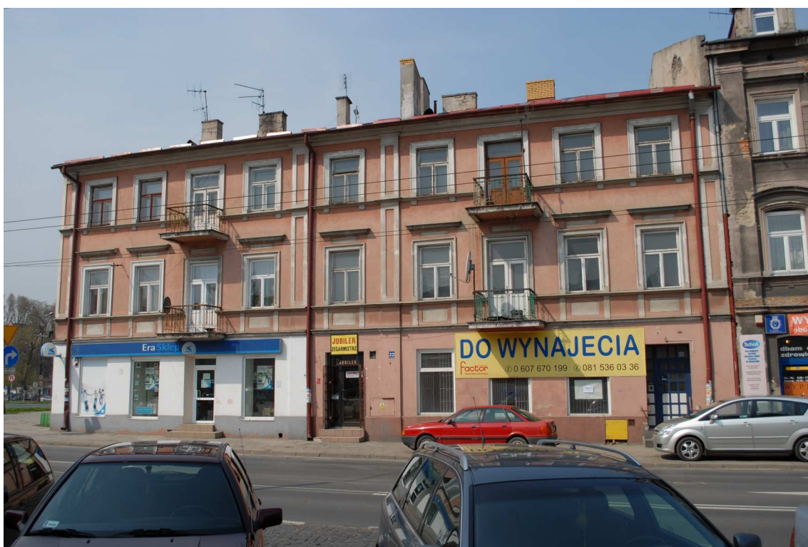
Fasada, Lubartowska 16 dawna Lubartowska 22, fot. Piotr Sztajdel, 2010.