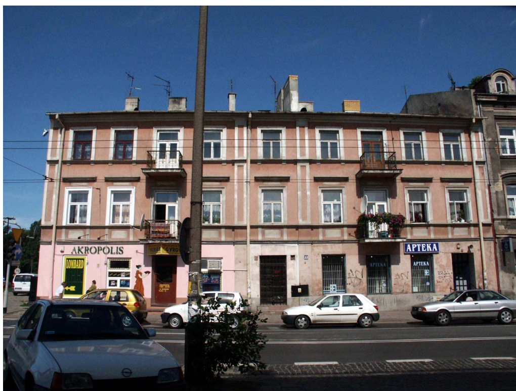
Fasada, Lubartowska 16 dawna Lubartowska 22, fot. Piotr Sztajdel, 2003.