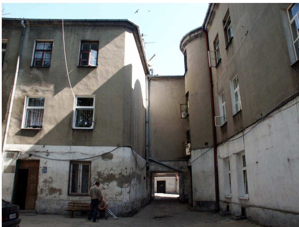
Podwórko, Lubartowska 24 dawna Lubartowska 18, fot. Piotr Sztajdel, 2003.