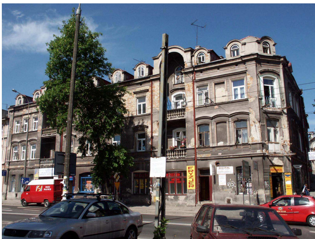
Fasada, Lubartowska 24 dawna Lubartowska 18 , fot. Piotr Sztajdel, 2003.