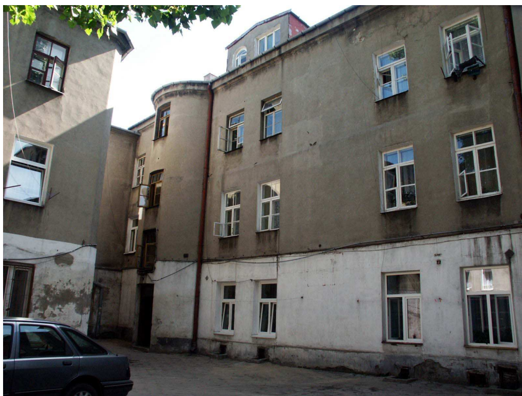
Podwórko, Lubartowska 24 dawna Lubartowska 18, fot. Piotr Sztajdel, 2003.