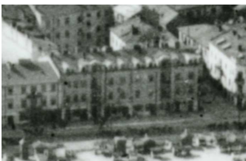
Fragment panoramy Lublina, lata 30., Lubartowska 18/A fragment of panorama of Lublin in the 1930s, Lubartowska 18,