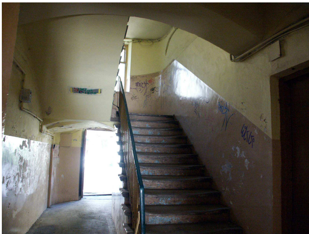
Klatka schodowa, Lubartowska 24 dawna Lubartowska 18, fot. Piotr Sztajdel, 2003.