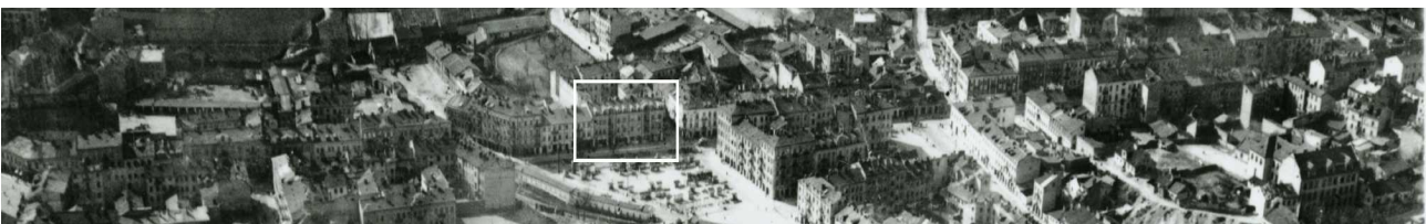
Fragment panoramy Lublina, lata 30., ul. Lubartowska/A fragment of panorama of Lublin in the 1930s, Lubartowska street,