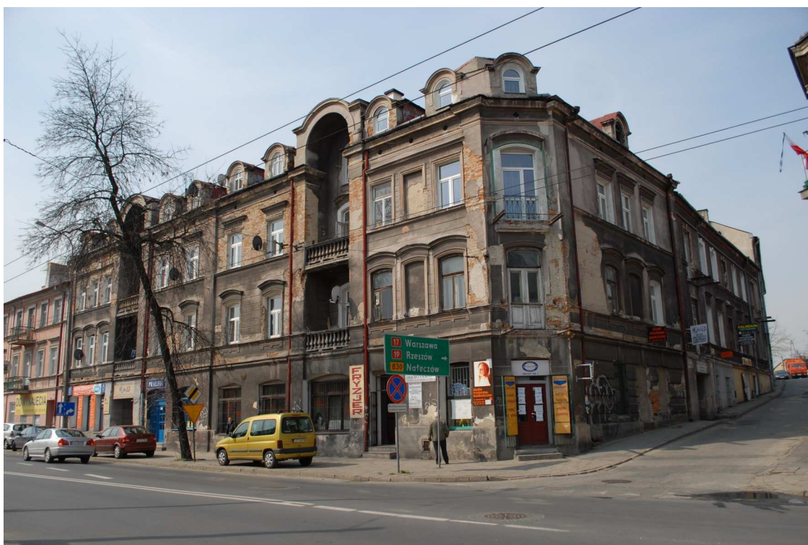
Fasada, Lubartowska 24 dawna Lubartowska 18, fot. Piotr Sztajdel, 2010.