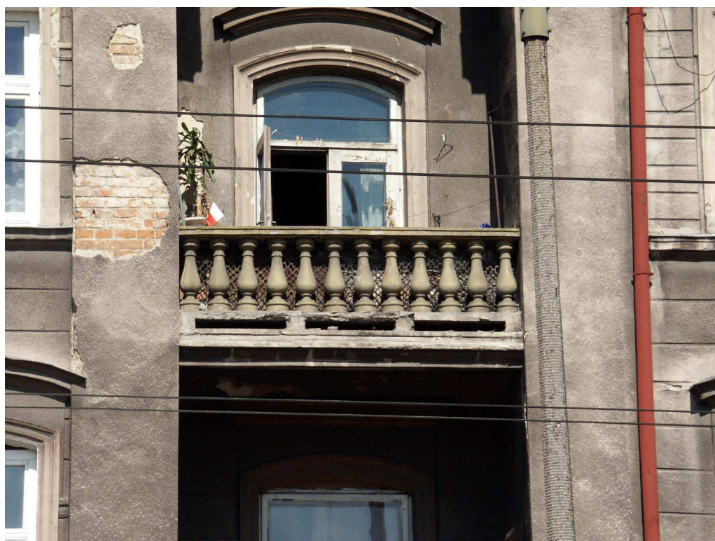
Fasada, Lubartowska 24 dawna Lubartowska 18, fot. Piotr Sztajdel, 2003.