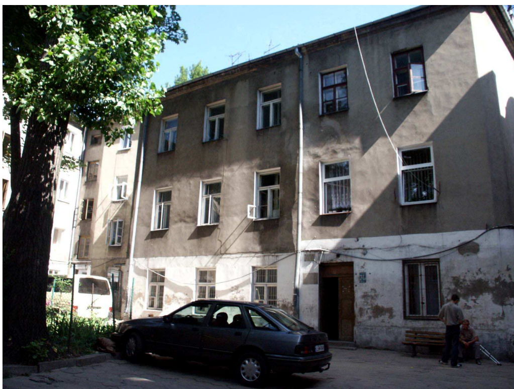
Podwórko, Lubartowska 24 dawna Lubartowska 18, fot. Piotr Sztajdel, 2003.