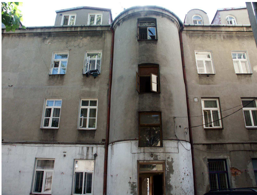
Podwórko, Lubartowska 24 dawna Lubartowska 18, fot. Piotr Sztajdel, 2003.