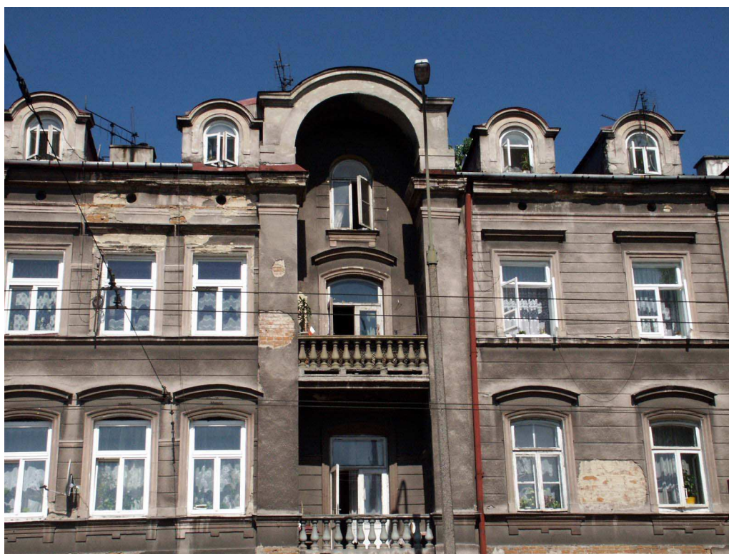
Fasada, Lubartowska 24 dawna Lubartowska 18 , fot. Piotr Sztajdel, 2003.