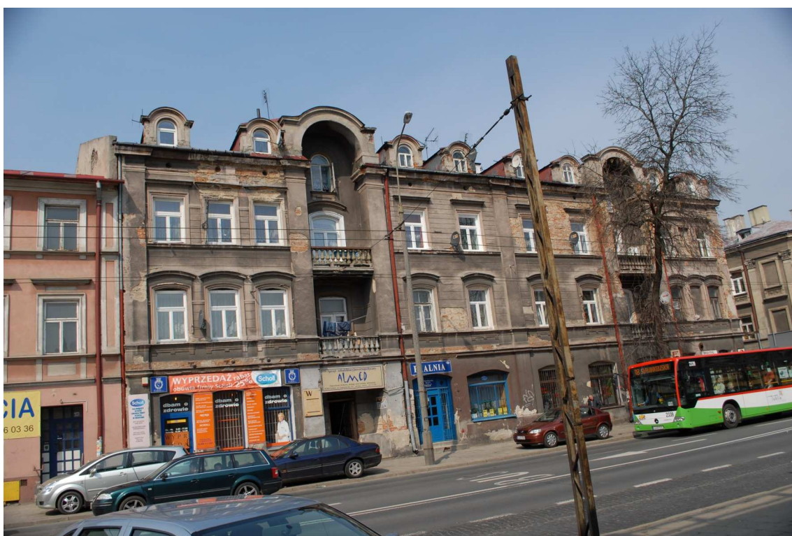
Fasada, Lubartowska 24 dawna Lubartowska 18, fot. Piotr Sztajdel, 2010.