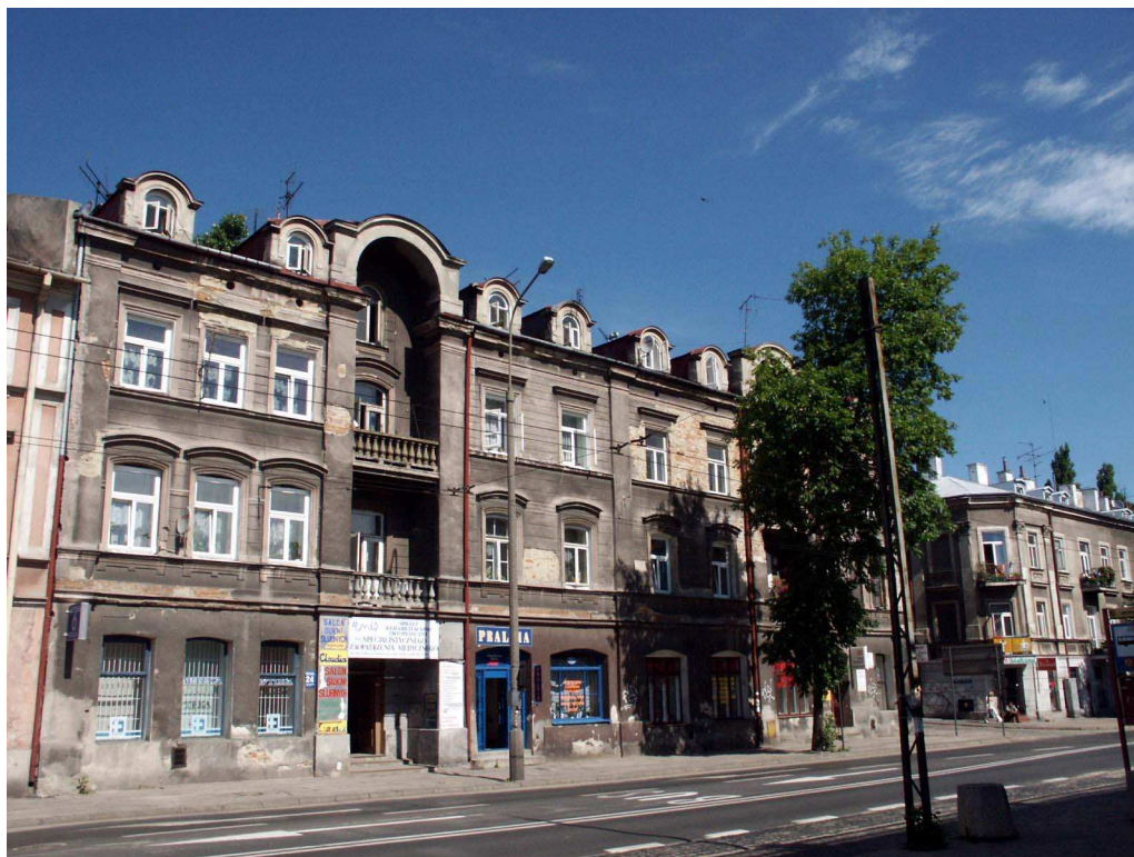
Fasada, Lubartowska 24 dawna Lubartowska 18, fot. Piotr Sztajdel, 2003.