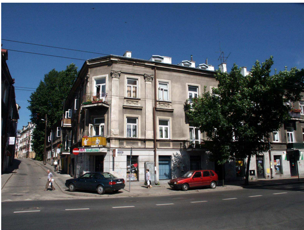
Fasada (róg ul. Probostwo), Lubartowska 26 dawna Lubartowska 20, 2003.