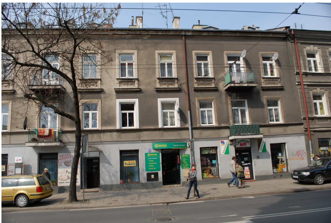
Fasada, Lubartowska 26 dawna Lubartowska 20, fot. Piotr Sztajdel, 2010.