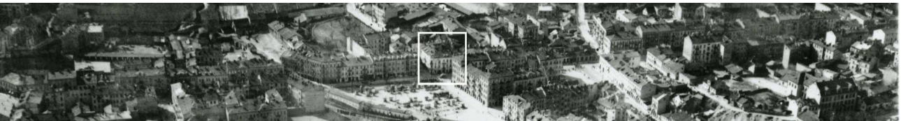
Fragment panoramy Lublina, lata 30., ul. Lubartowska/A fragment of panorama of Lublin in the 1930s, Lubartowska street,