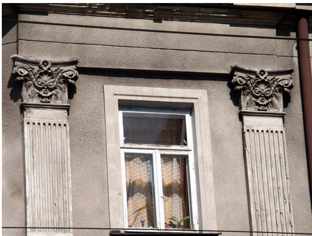
Detale, Lubartowska 26 dawna Lubartowska 20, fot. Piotr Sztajdel, 2003.