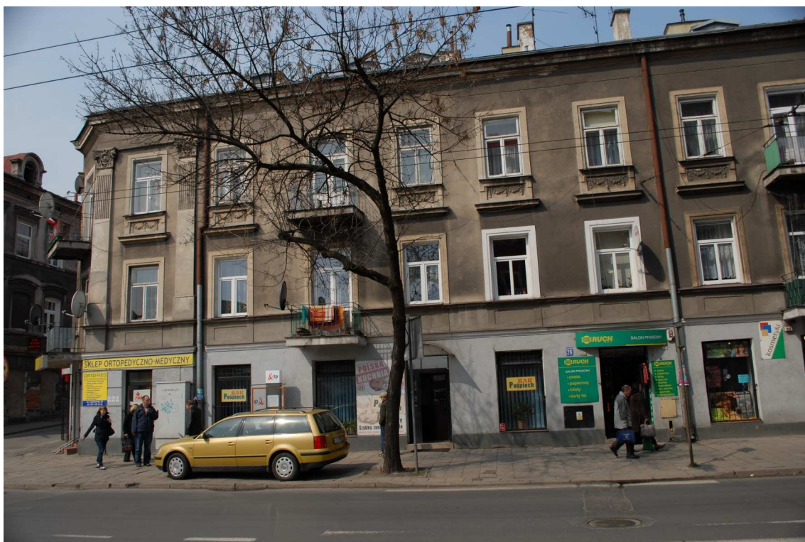
Fasada, Lubartowska 26 dawna Lubartowska 20, 2010.