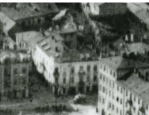
Fragment panoramy Lublina, lata 30., Lubartowska 20/A fragment of panorama of Lublin in the 1930s, Lubartowska 20,