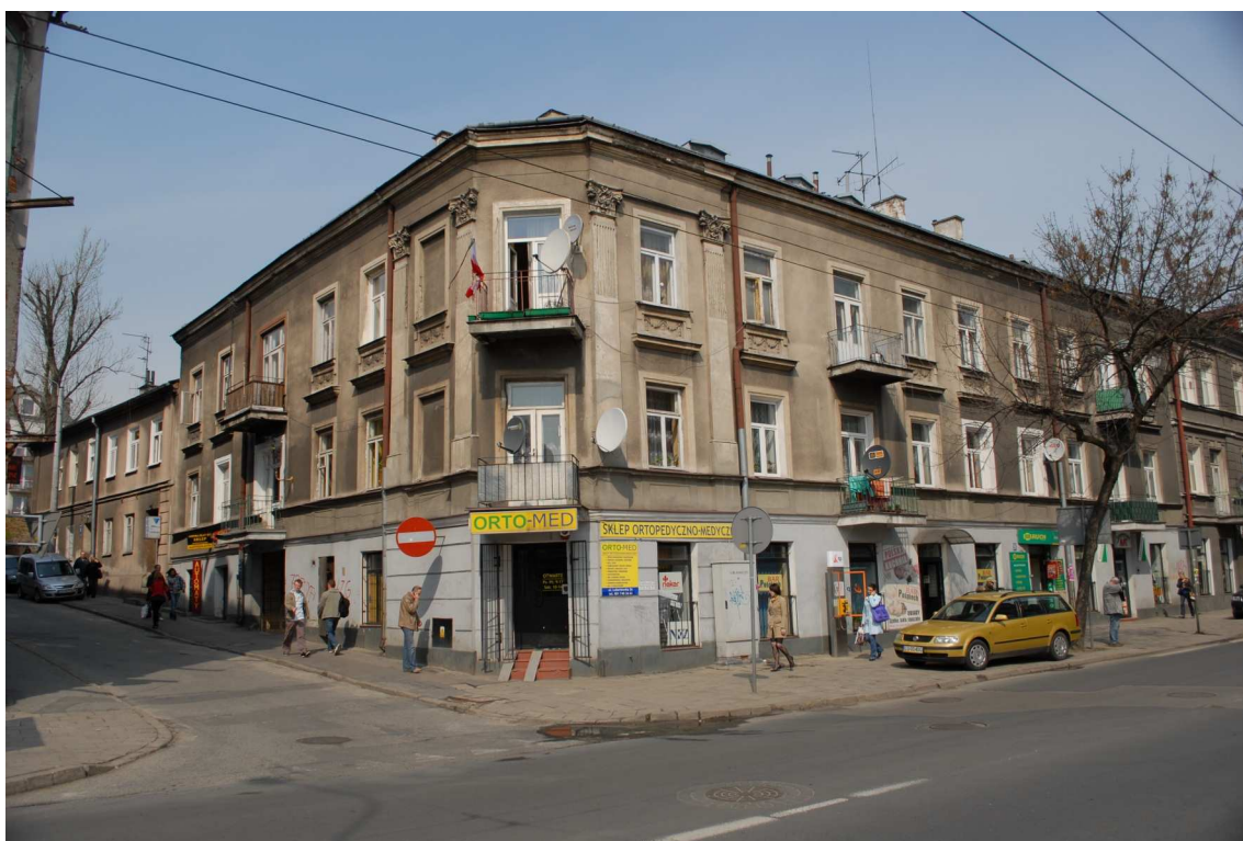
Fasada, Lubartowska 26 dawna Lubartowska 20, fot. Piotr Sztajdel, 2010.