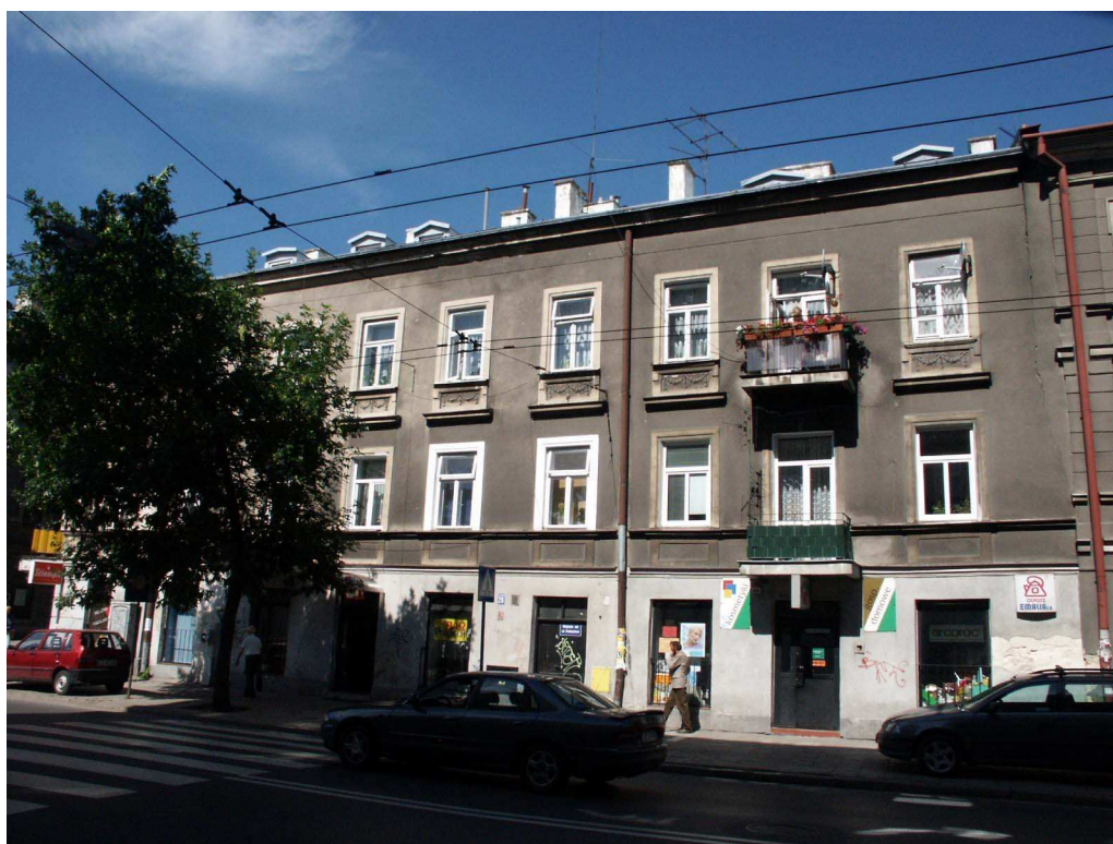
Fasada, Lubartowska 26 dawna Lubartowska 20, fot. Piotr Sztajdel, 2003.