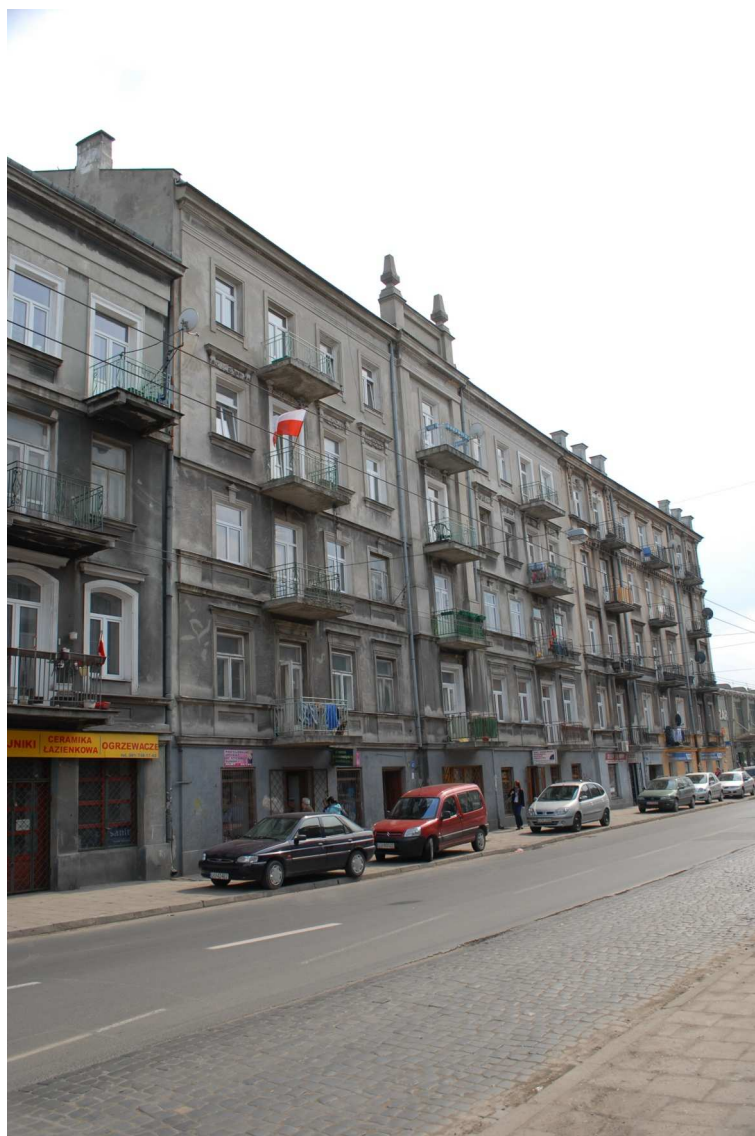
Fasada, Lubartowska 47 dawna Lubartowska 21, fot. Piotr Sztajdel, 2010.