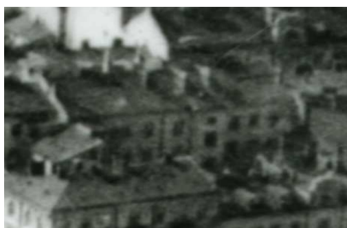
Fragment panoramy Lublina, lata 30., Lubartowska 21/A fragment of panorama of Lublin in the 1930s, Lubartowska 21,