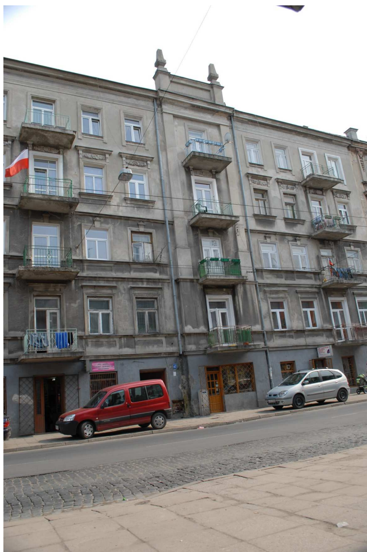
Fasada, Lubartowska 47 dawna Lubartowska 21, 2010.