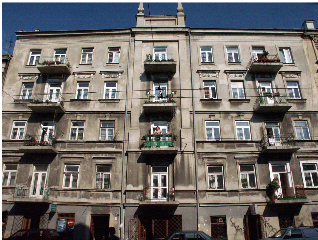
Fasada, Lubartowska 47 dawna Lubartowska 21, fot. Piotr Sztajdel, 2003.