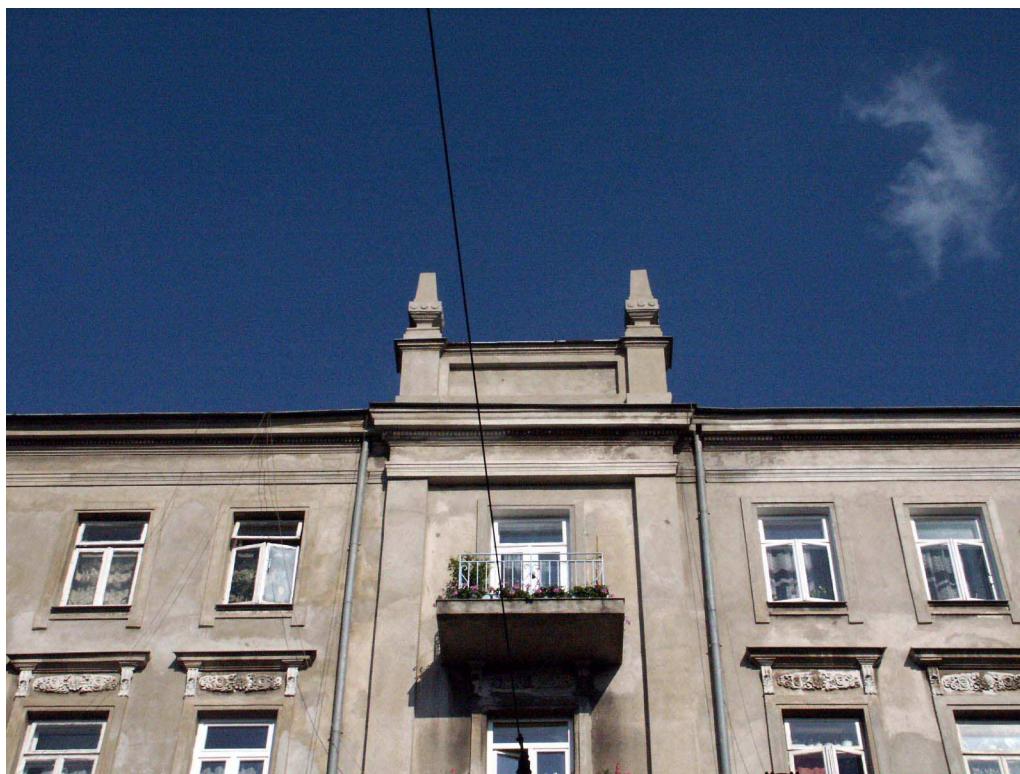
Fasada fragment, Lubartowska 47 dawna Lubartowska 21, fot. Piotr Sztajdel, 2003.