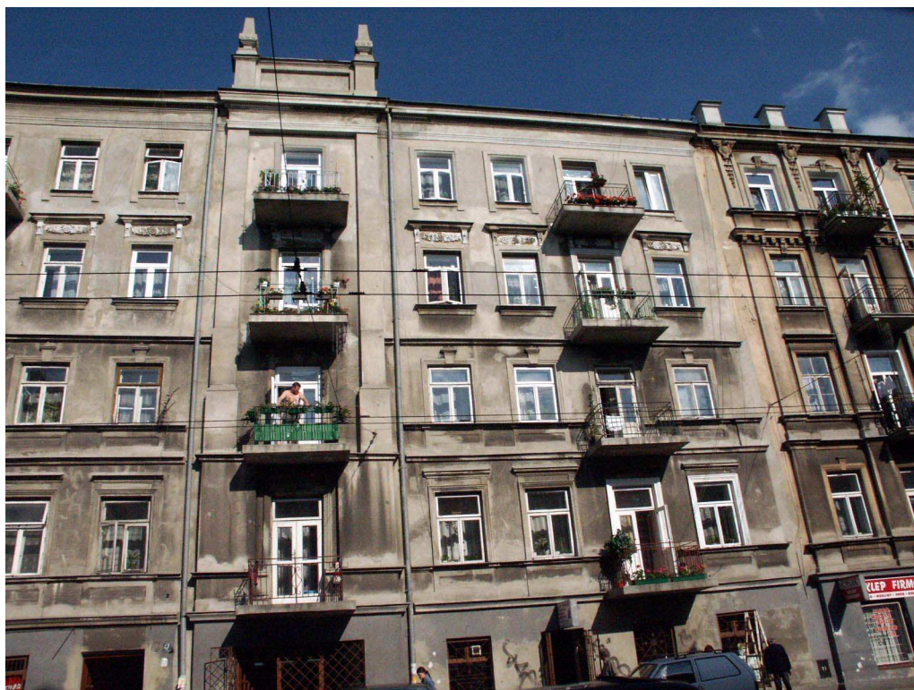
Fasada, Lubartowska 47 dawna Lubartowska 21, fot. Piotr Sztajdel, 2003.