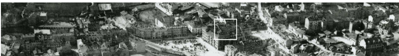
Fragment panoramy Lublina, lata 30., ul. Lubartowska/A fragment of panorama of Lublin in the 1930s, Lubartowska street,