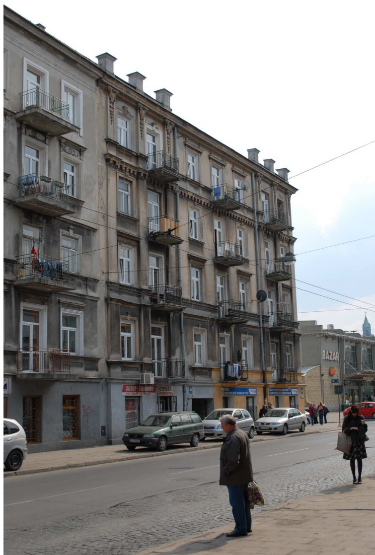
Fasada, Lubartowska 47 dawna Lubartowska 21, fot. Piotr Sztajdel, 2010.