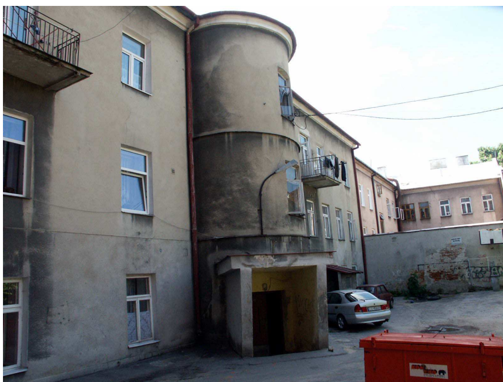
Podwórko, Lubartowska 28 dawna Lubartowska 22, fot. Piotr Sztajdel, 2003.