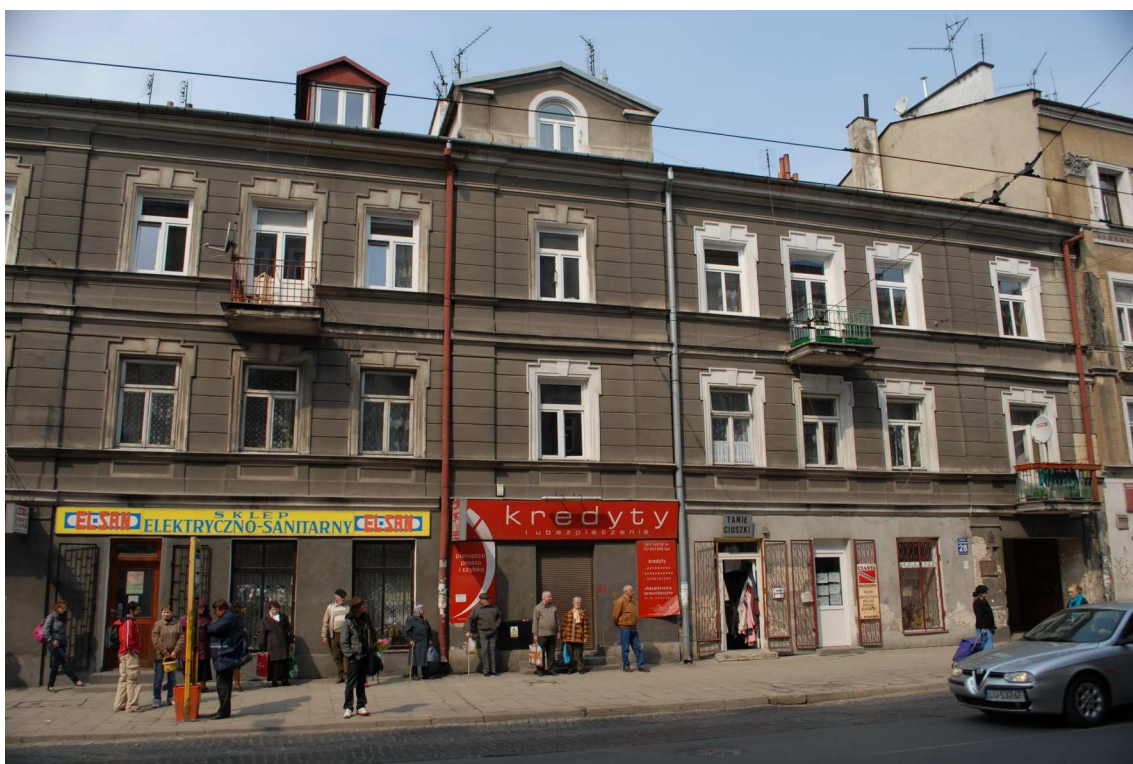
Fasada, Lubartowska 28 dawna Lubartowska 22, fot. Piotr Sztajdel, 2010.