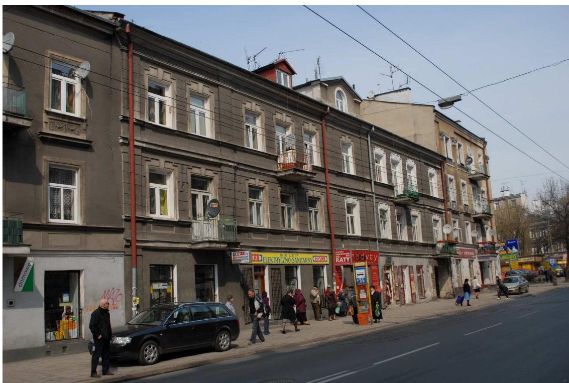
Fasada, Lubartowska 28 dawna Lubartowska 22, fot. Piotr Sztajdel, 2010.