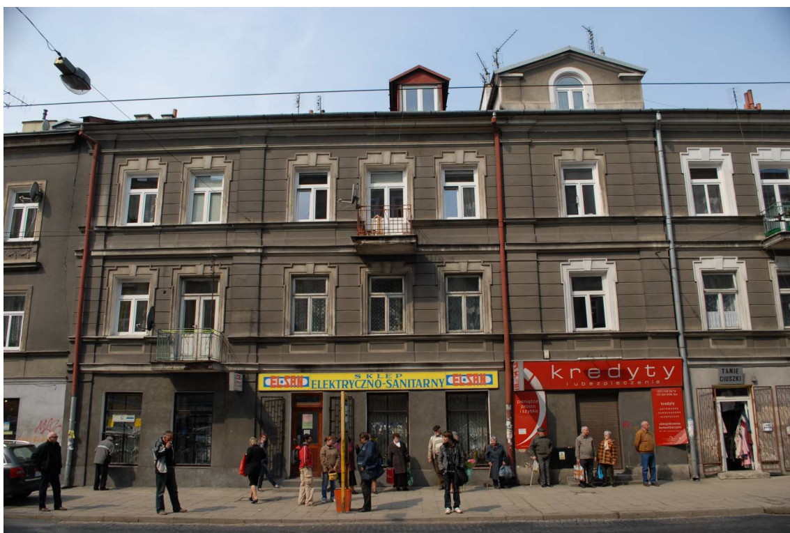
Fasada, Lubartowska 28 dawna Lubartowska 22, fot. Piotr Sztajdel, 2010.