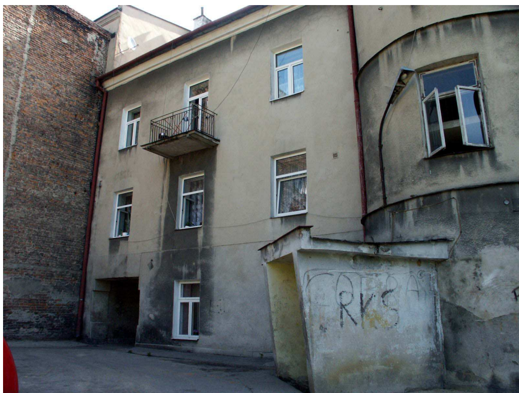
Podwórko, Lubartowska 28 dawna Lubartowska 22, fot. Piotr Sztajdel, 2003.