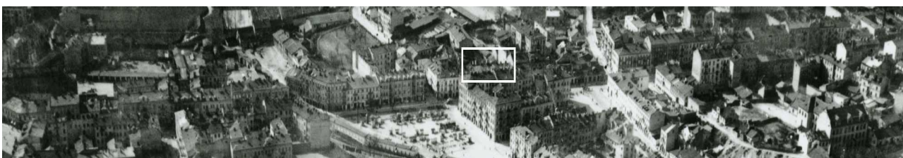
Fragment panoramy Lublina, lata 30., ul. Lubartowska/A fragment of panorama of Lublin in the 1930s, Lubartowska street,