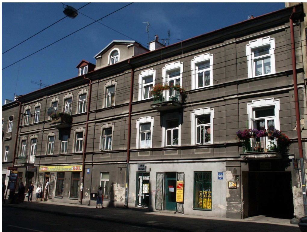
Fasada, Lubartowska 28 dawna Lubartowska 22, fot. Piotr Sztajdel, 2003.