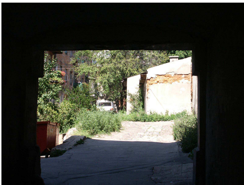
Podwórko, Lubartowska 28 dawna Lubartowska 22, fot. Piotr Sztajdel, 2003.