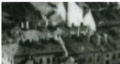
Fragment panoramy Lublina, lata 30., Lubartowska 22/A fragment of panorama of Lublin in the 1930s, Lubartowska 22,