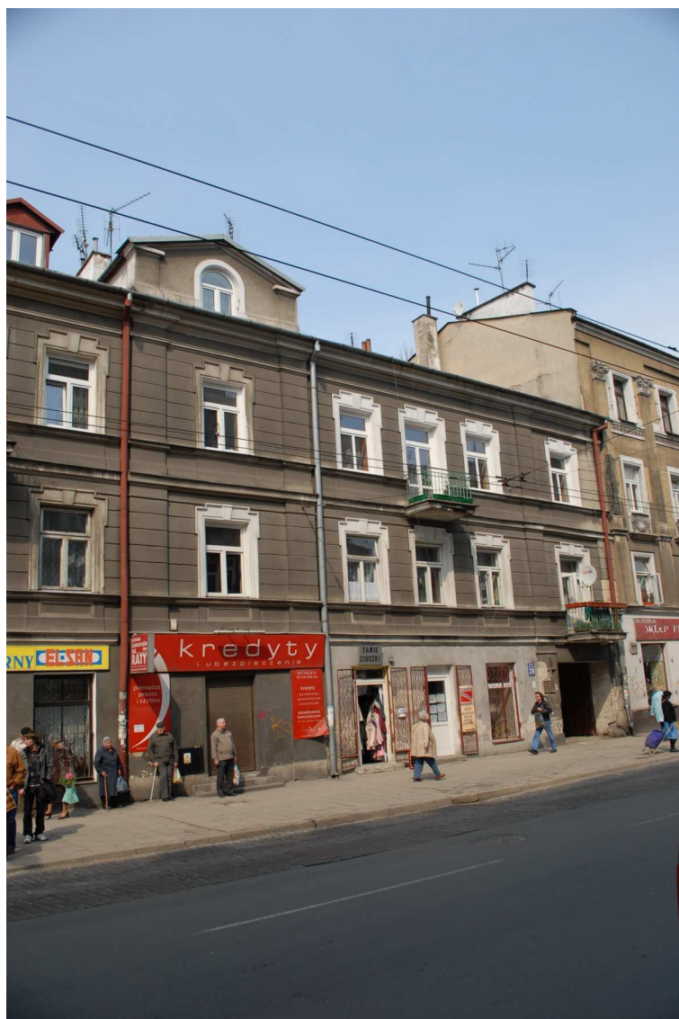
Fasada, Lubartowska 28 dawna Lubartowska 22, 2010.