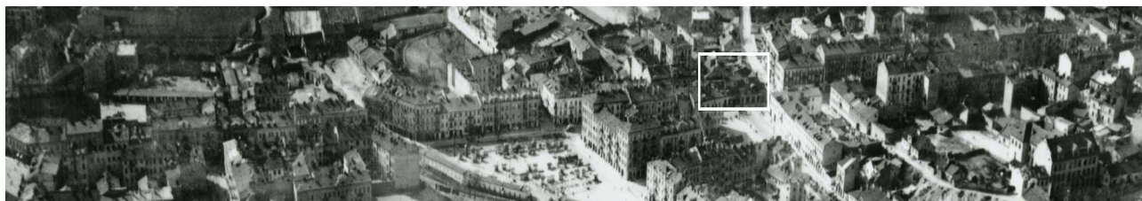
Fragment panoramy Lublina, lata 30., ul. Lubartowska/A fragment of panorama of Lublin in the 1930s, Lubartowska street,