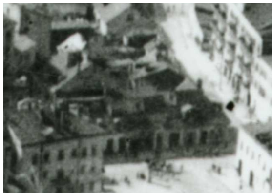
Fragment panoramy Lublina, lata 30., Lubartowska 26/A fragment of panorama of Lublin in the 1930s, Lubartowska 26,