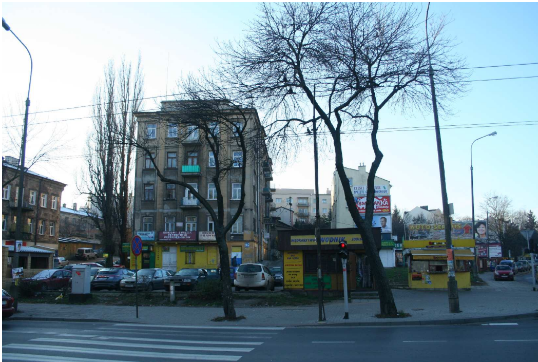
Lokalizacja dawnej nieruchomości Lubartowska 15, obecnie Lubartowska 32, fot. Marcin Fedorowicz, 2010.