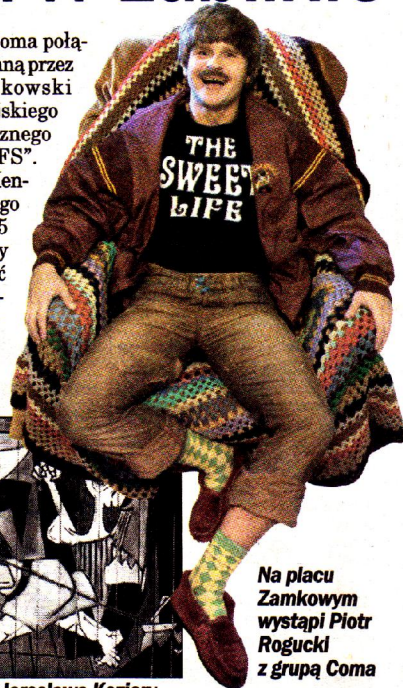
Na placu Zamkowym wystąpi Piotr Rogucki z grupą Coma