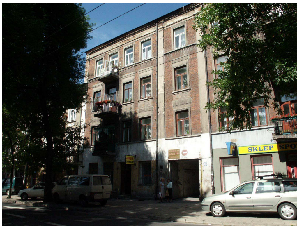
Fasada, Lubartowska 36 dawna Lubartowska 30, 2003.