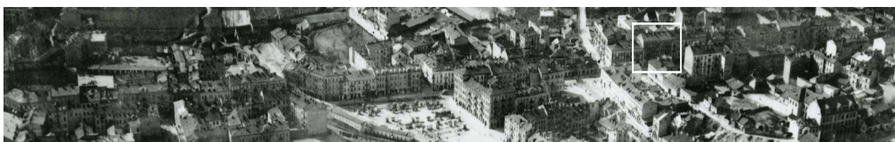
Fragment panoramy Lublina, lata 30., ul. Lubartowska/A fragment of panorama of Lublin in the 1930s, Lubartowska street,