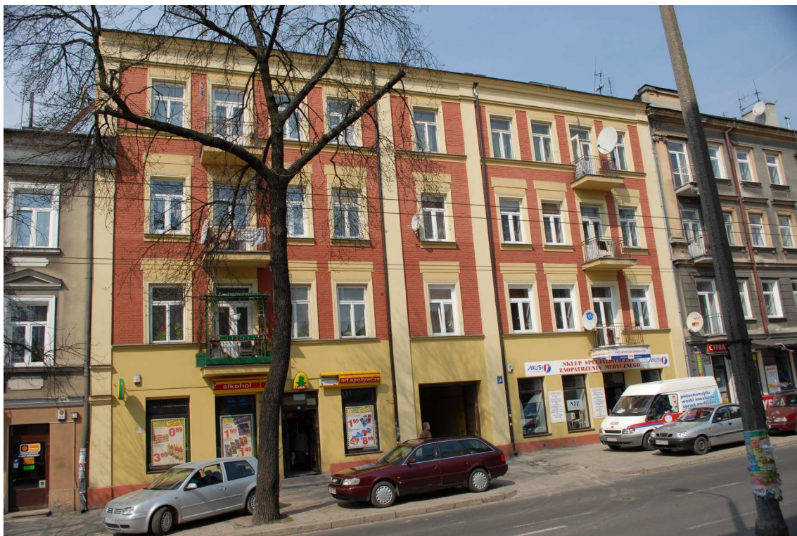
Fasada, Lubartowska 36 dawna Lubartowska 30, fot. Piotr Sztajdel, 2010.