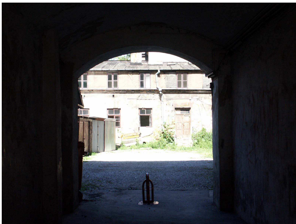
Podwórko, Lubartowska 36 dawna Lubartowska 30, fot. Piotr Sztajdel, 2003.