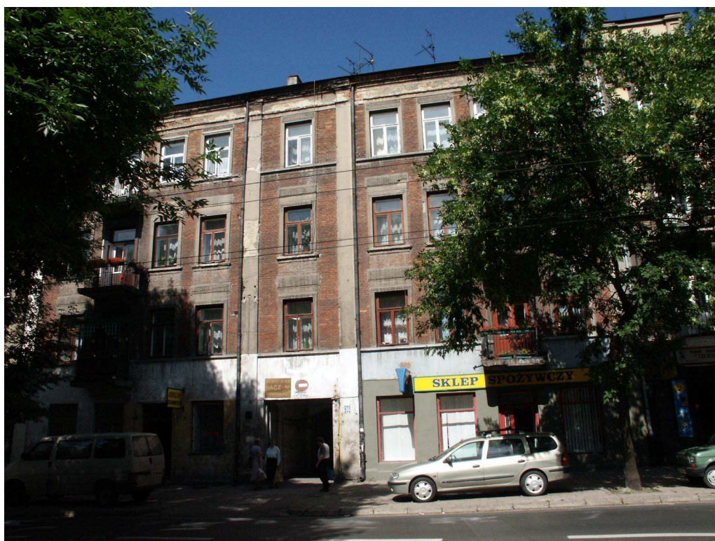
Fasada, Lubartowska 36 dawna Lubartowska 30, fot. Piotr Sztajdel, 2003.