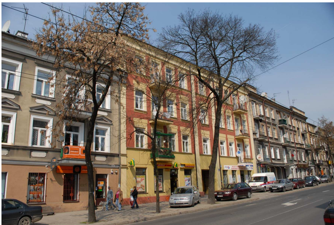
Fasada, Lubartowska 36 dawna Lubartowska 30, fot. Piotr Sztajdel, 2010.