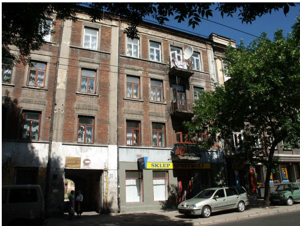
Fasada, Lubartowska 36dawna Lubartowska 30, fot. Piotr Sztajdel, 2003.