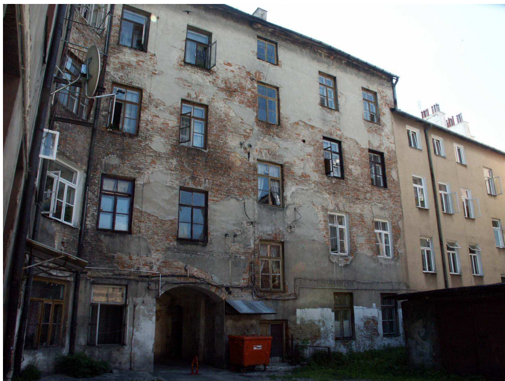
Podwórko, Lubartowska 36 dawna Lubartowska 30, fot. Piotr Sztajdel, 2003.