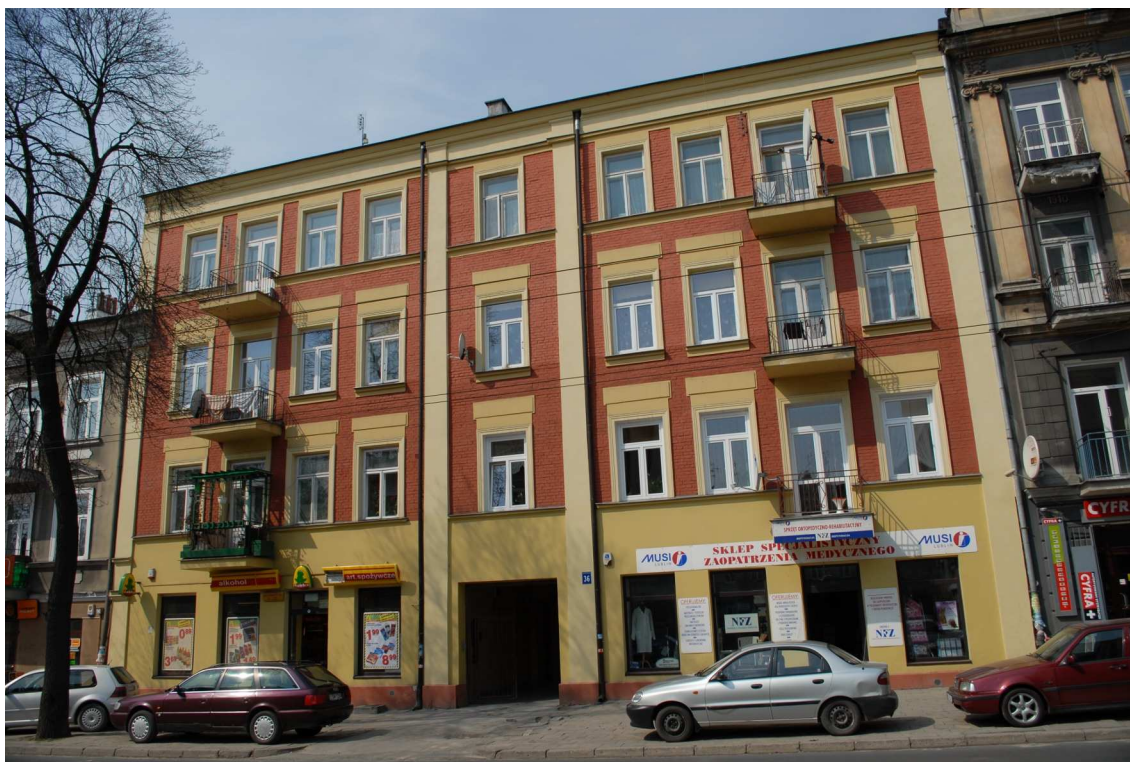
Fasada, Lubartowska 36 dawna Lubartowska 30, fot. Piotr Sztajdel, 2010.