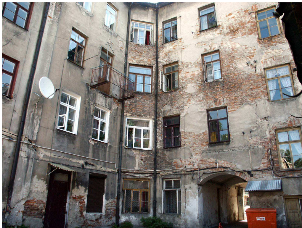
Podwórko, Lubartowska 36 dawna Lubartowska 30, fot. Piotr Sztajdel, 2003.