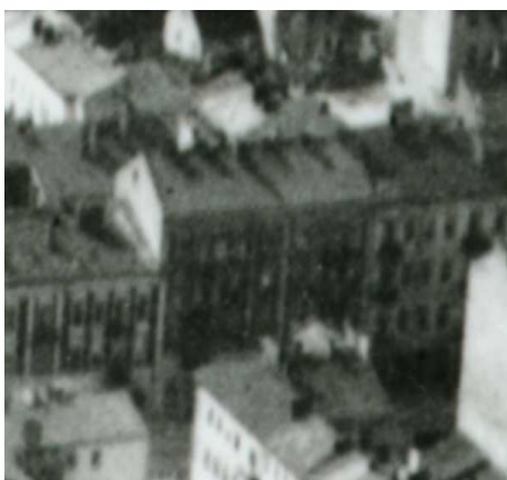
Fragment panoramy Lublina, lata 30., Lubartowska 30/A fragment of panorama of Lublin in the 1930s, Lubartowska 30,