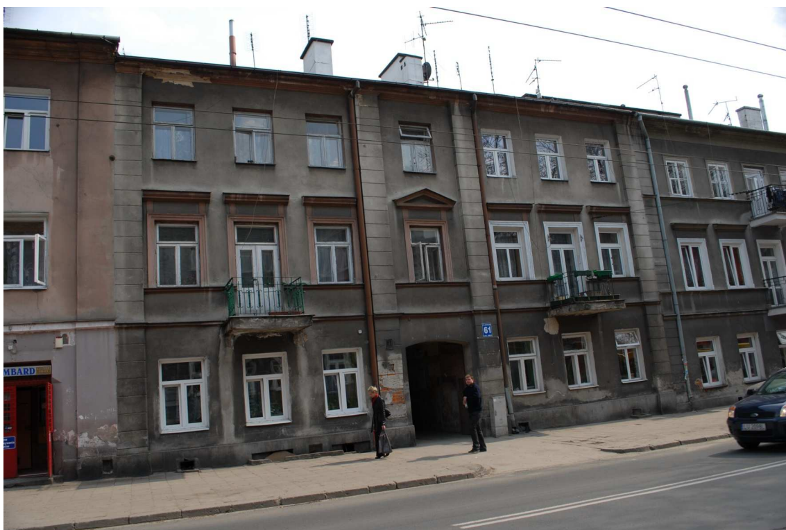
Fasada, Lubartowska 61 dawna Lubartowska 35, fot. Piotr Sztajdel, 2010.