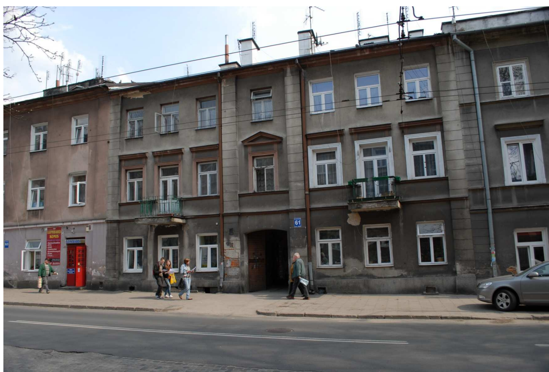
Fasada, Lubartowska 61 dawna Lubartowska 35, fot. Piotr Sztajdel, 2010.