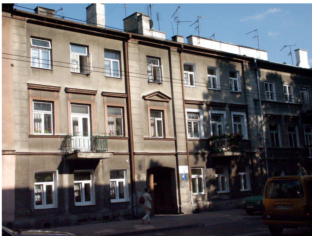
Fasada, Lubartowska 61 dawna Lubartowska 35, fot. Piotr Sztajdel, 2003.