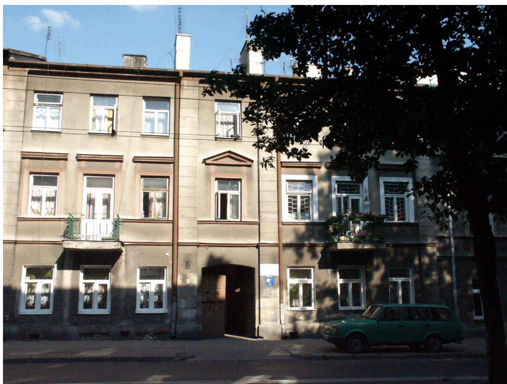
Fasada, Lubartowska 61 dawna Lubartowska 35, fot. Piotr Sztajdel, 2003.