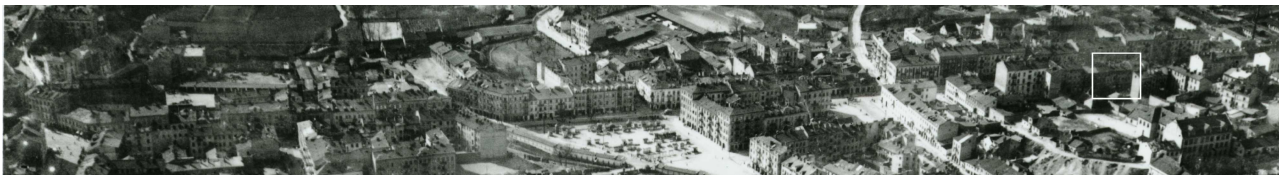
Fragment panoramy Lublina, lata 30., ul. Lubartowska/A fragment of panorama of Lublin in the 1930s, Lubartowska street,