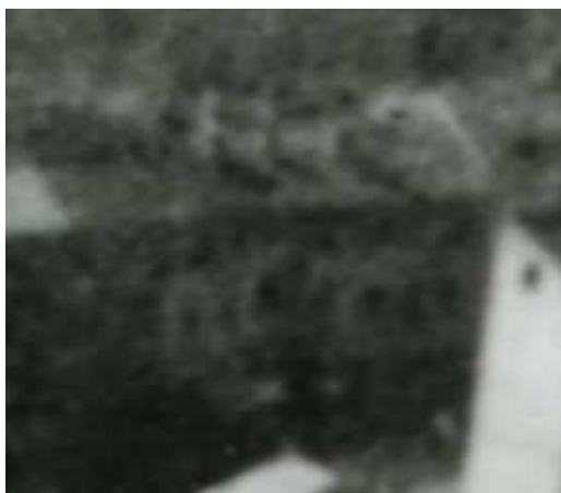
Fragment panoramy Lublina, lata 30., Lubartowska 35/A fragment of panorama of Lublin in the 1930s, Lubartowska 35,