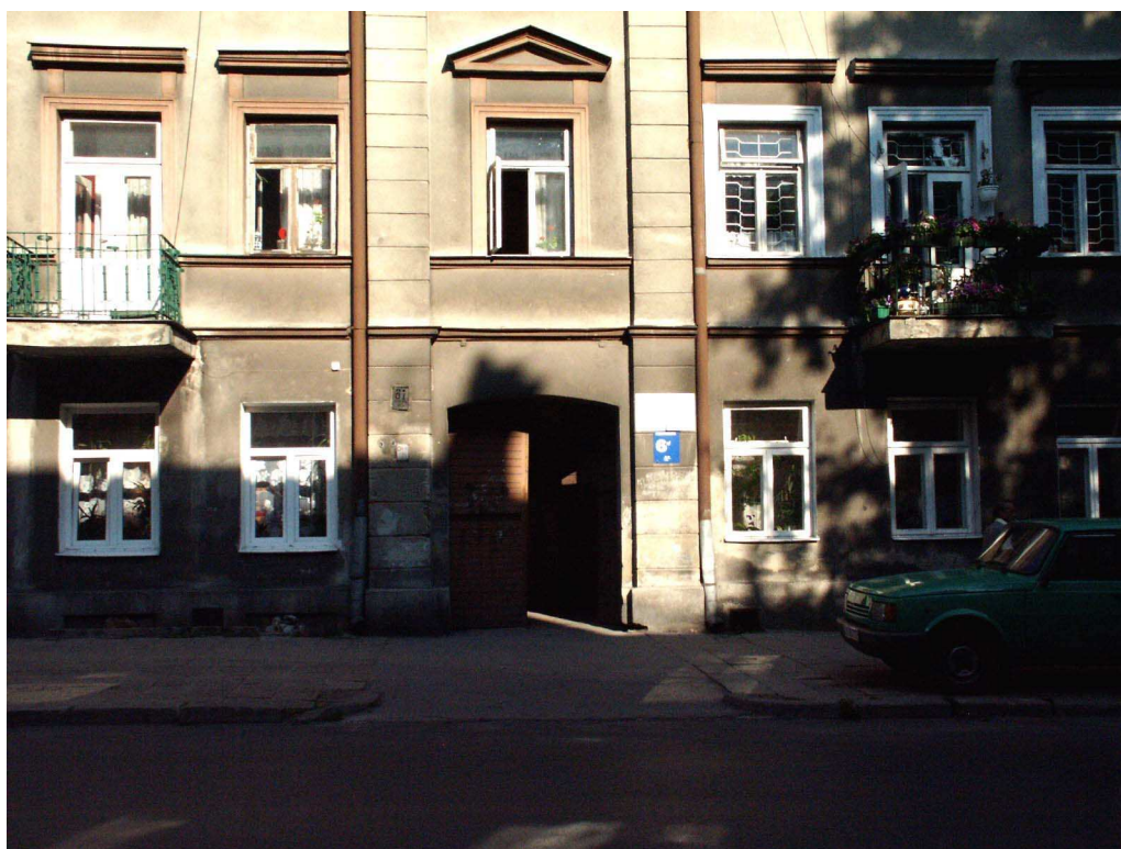
Fasada fragment, Lubartowska 61 dawna Lubartowska 35, 2003.