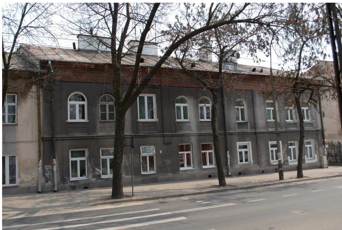
Fasada, Lubartowska 71 dawna Lubartowska 45 47, fot. Piotr Sztajdel, 2010.