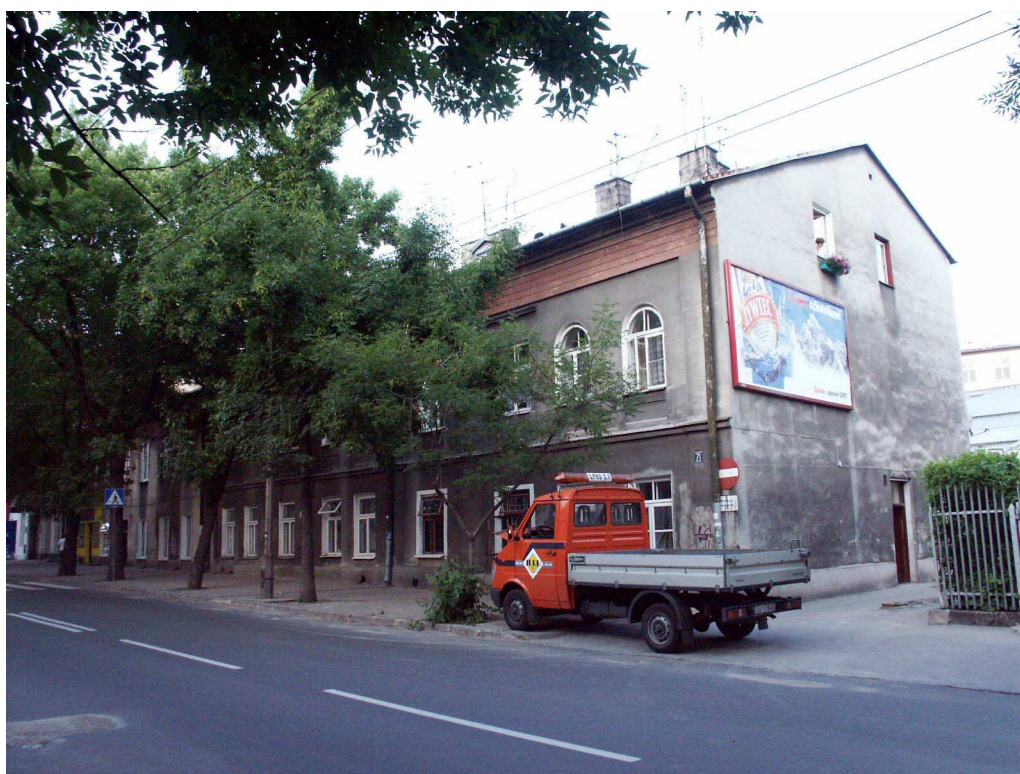
Fasada, Lubartowska 71 dawna Lubartowska 45 47, fot. Piotr Sztajdel, 2003.