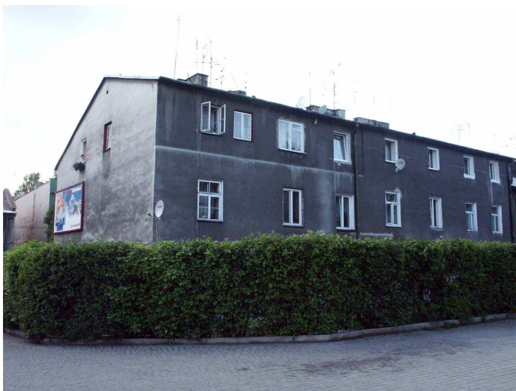
Widok od podwórka, Lubartowska 71 dawna Lubartowska 45 47, fot. Piotr Sztajdel, 2003.