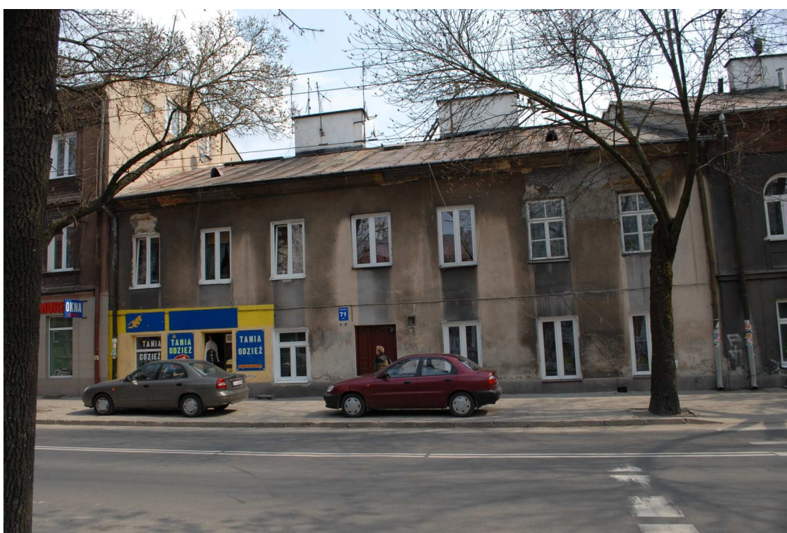
Fasada, Lubartowska 71 dawna Lubartowska 45 47, fot. Piotr Sztajdel, 2010.