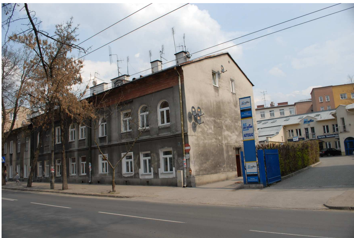
Fasada, Lubartowska 71 dawna Lubartowska 45 47, 2010.