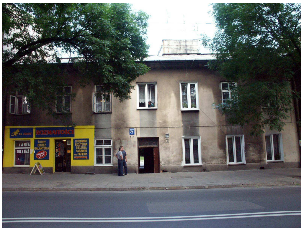
Wejście, Lubartowska 71 dawna Lubartowska 45 47, fot. Piotr Sztajdel, 2003.