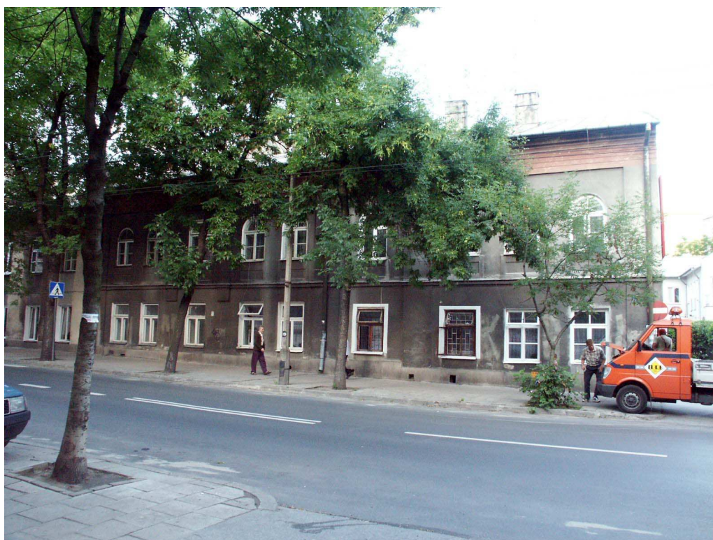
Fasada, Lubartowska 71 dawna Lubartowska 45 47, fot. Piotr Sztajdel, 2003.