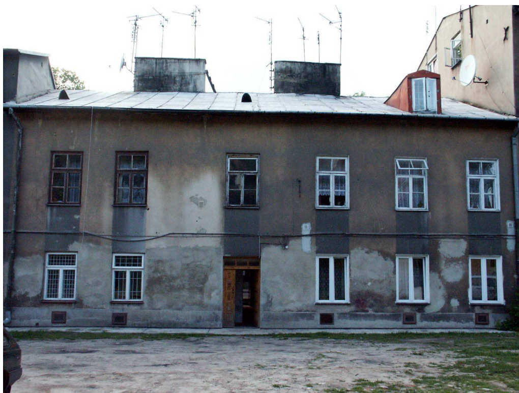
Widok od podwórka, Lubartowska 71 dawna Lubartowska 45 47, fot. Piotr Sztajdel, 2003.