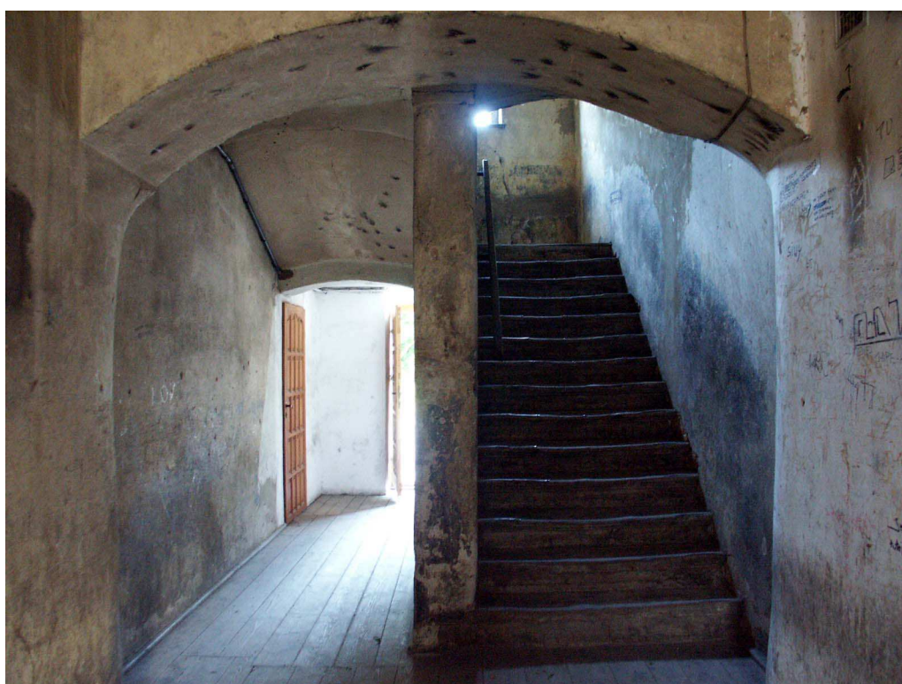
Klatka schodowa, Lubartowska 71 dawna Lubartowska 45 47, fot. Piotr Sztajdel, 2003.