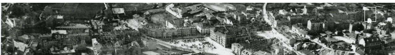
Fragment panoramy Lublina, lata 30., ul. Lubartowska/A fragment of panorama of Lublin in the 1930s, Lubartowska street,