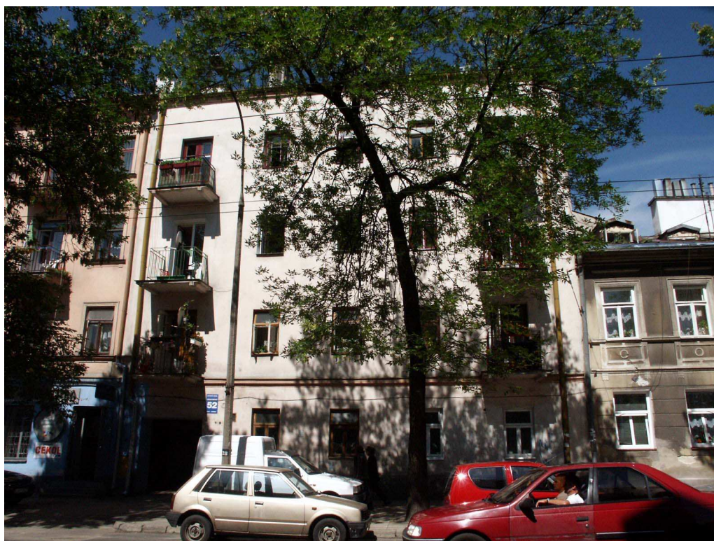
Fasada, Lubartowska 52, fot. Piotr Sztajdel, 2003.