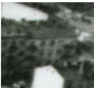
Fragment panoramy Lublina, lata 30., Lubartowska 46/A fragment of panorama of Lublin in the 1930s, Lubartowska 46,