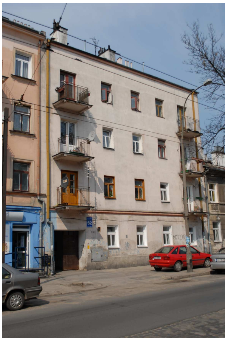
Fasada, Lubartowska 52, fot. Piotr Sztajdel, 2010.