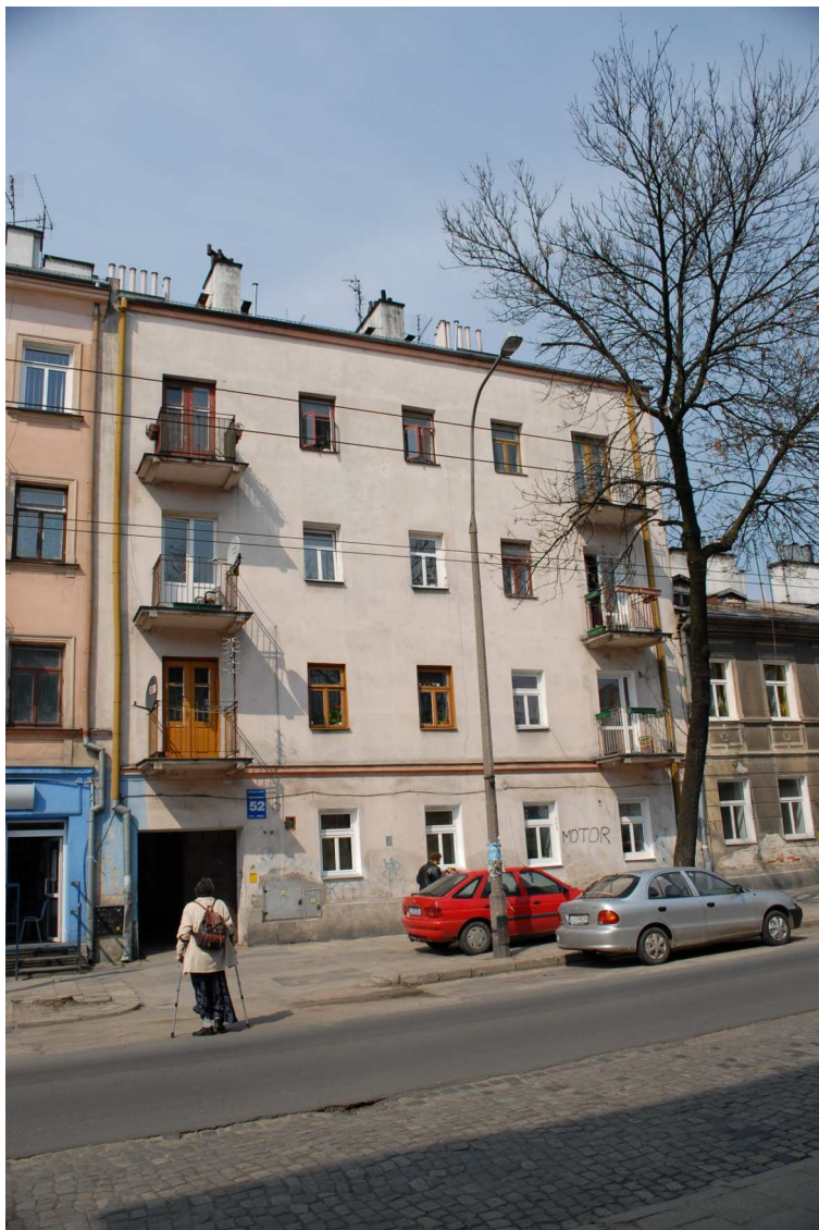
Fasada, Lubartowska 52, fot. Piotr Sztajdel, 2010.