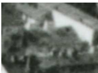
Fragment panoramy Lublina, lata 30., Lubartowska 48/A fragment of panorama of Lublin in the 1930s, Lubartowska 48,