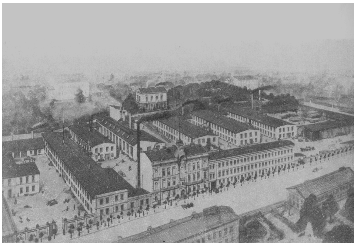
Lubartowska 50, fabryka wag W. Hessa, autor nieznany, początek XX wieku.