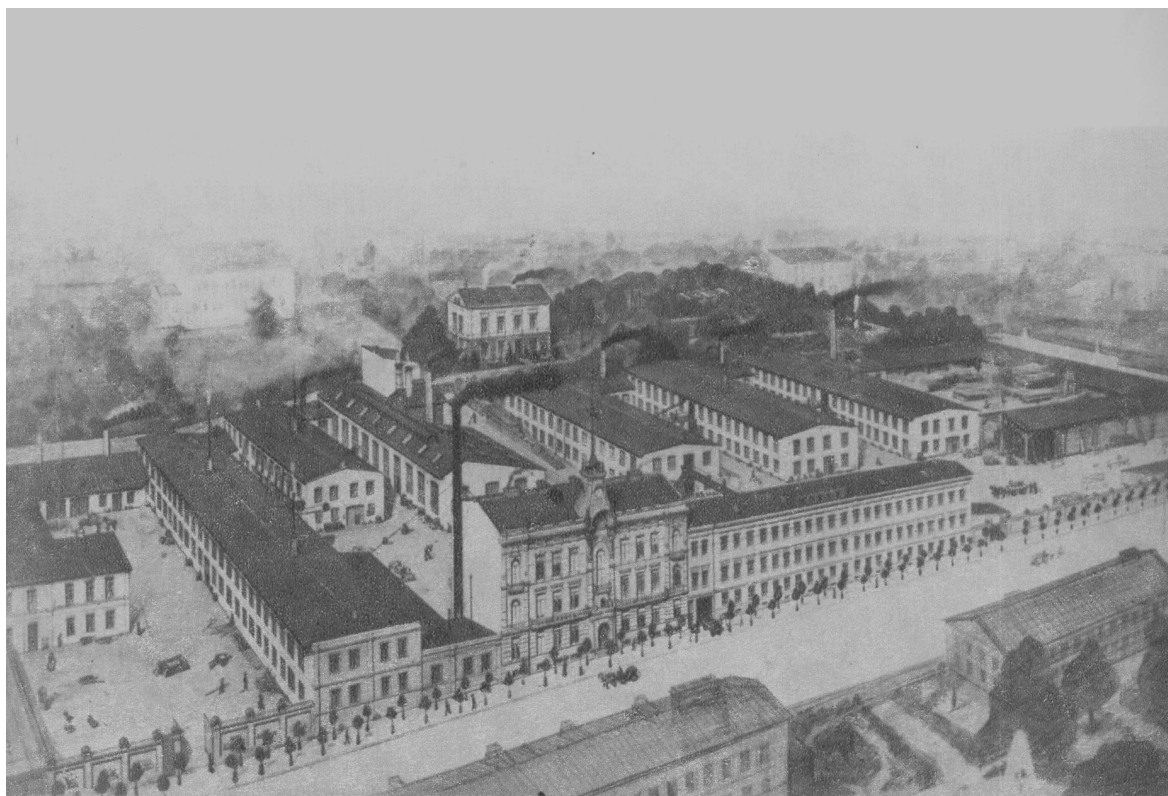
Lubartowska 50b i c, fabryka wag W. Hessa, autor nieznany, początek XX wieku.