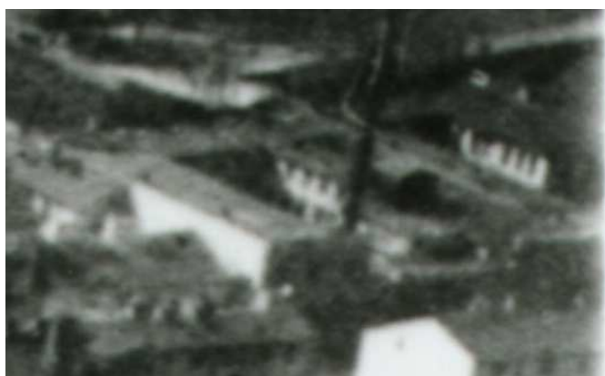
Fragment panoramy Lublina, lata 30., Lubartowska 50/A fragment of panorama of Lublin in the 1930s, Lubartowska 50,