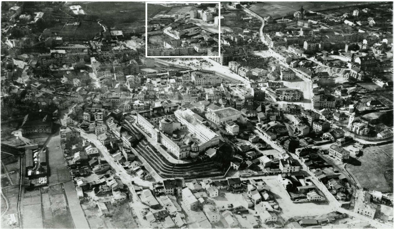
Panorama Lublina, lata 30./Panorama of Lublin in the 1930s,