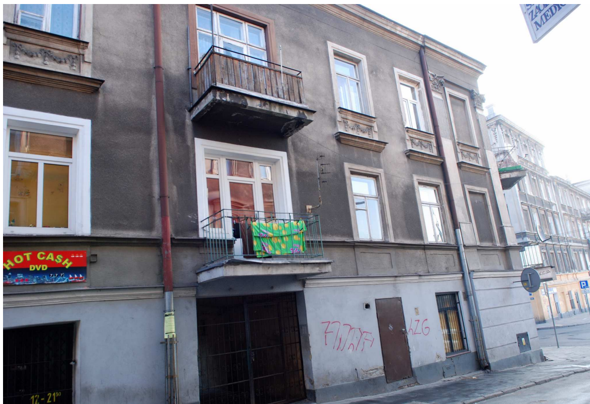
Fragment elewacji, Probostwo 1, 2010.