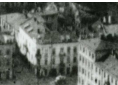
Fragment panoramy Lublina, lata 30., Probostwo 1/A fragment of panorama of Lublin in the 1930s, Probostwo 1,