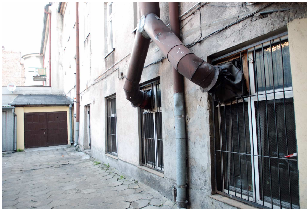
Podwórko, Probostwo 1, 2010.