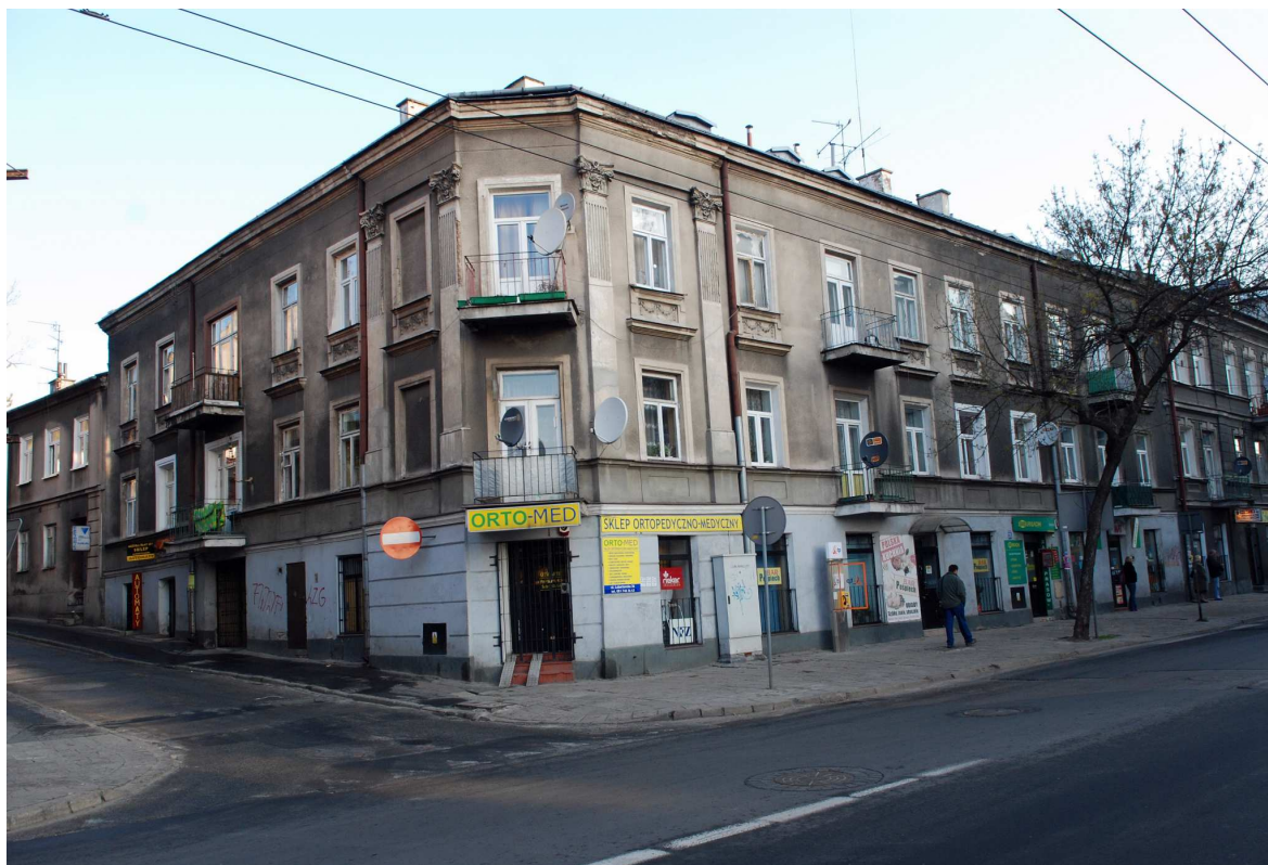
Fasada, Probostwo 1, fot. Marcin Moszyński, 2010.