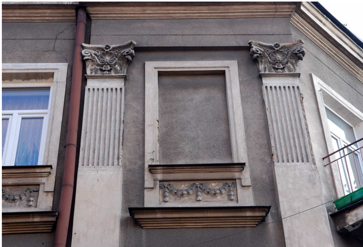
Detal, Probostwo 1, 2010.