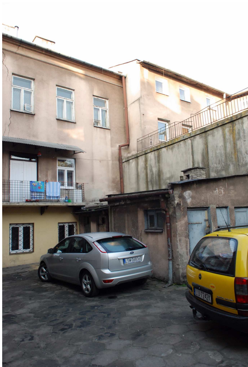
Elewacja tylna, Probostwo 1, fot. Marcin Moszyński, 2010.