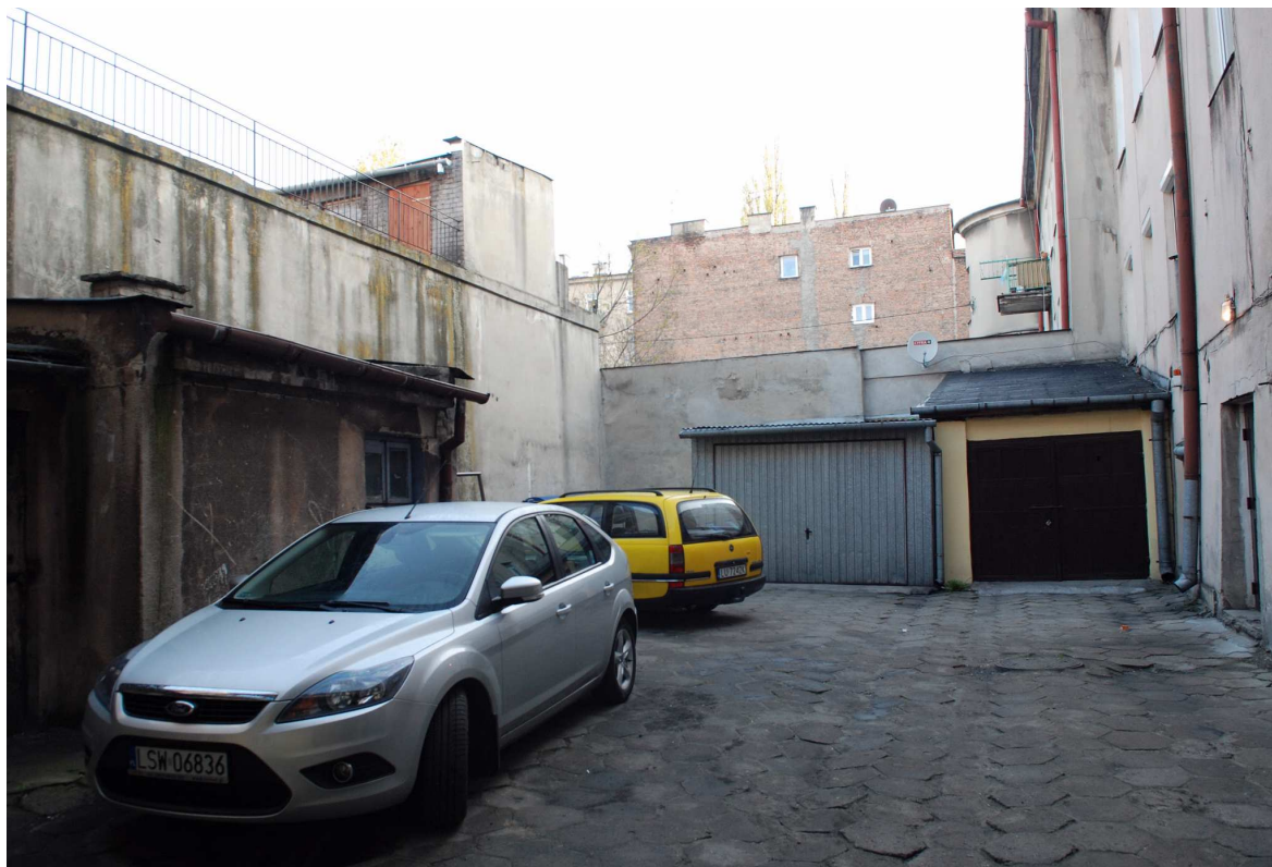
Podwórko, Probostwo 1, fot. Marcin Moszyński, 2010.