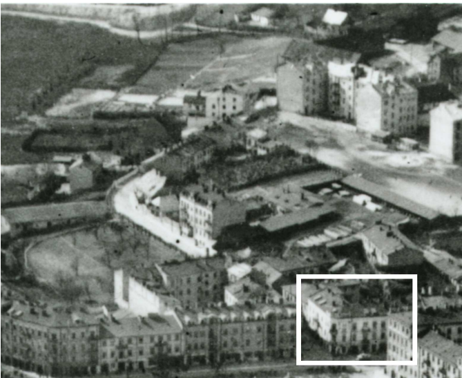
Fragment panoramy Lublina, lata 30., ul. Probostwo/A fragment of panorama of Lublin in the 1930s, Probostwo street,