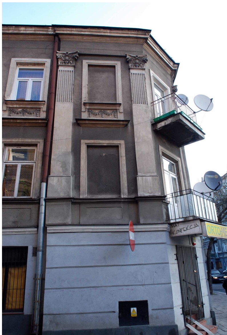
Fragment elewacji, Probostwo 1, fot. Marcin Moszyński 2010.