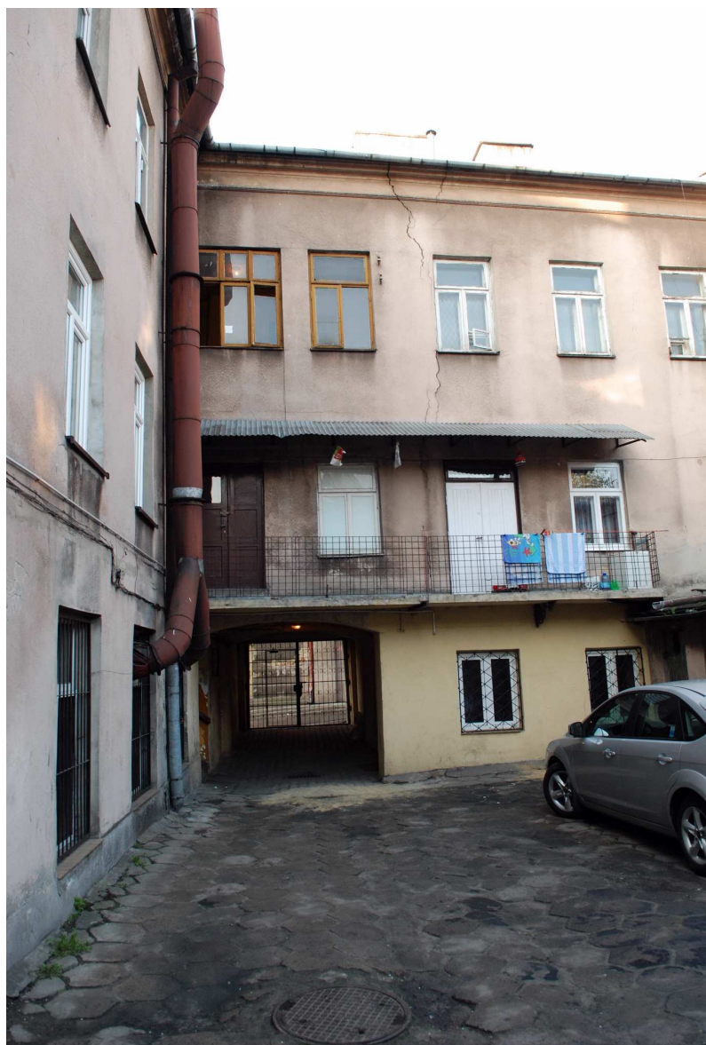
Elewacja tylna, Probostwo 1, fot. Marcin Moszyński, 2010.