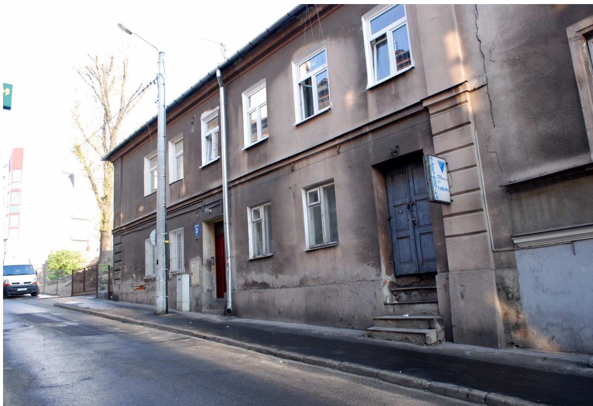
Fasada, Probostwo 3, fot. Marcin Moszyński, 2010.