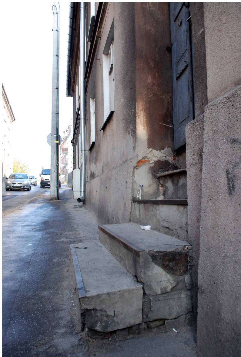
Detal, Probostwo 3, fot. Marcin Moszyński, 2010.