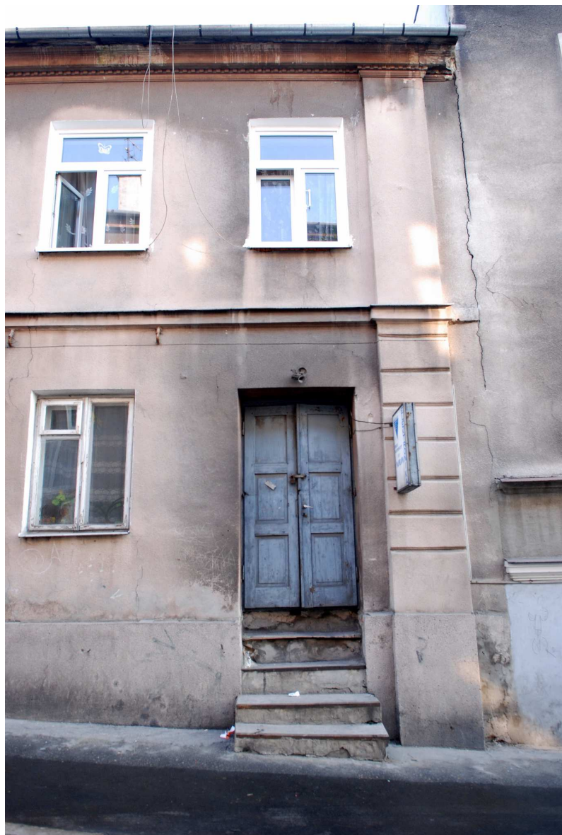
Detal, Probstwo 3, 2010.