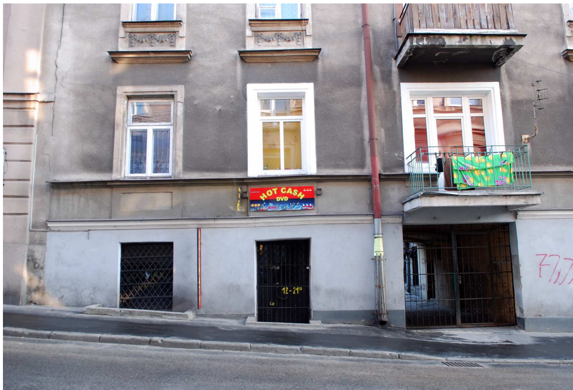
Fragment elewacji, Probstwo 3, fot. Marcin Moszyński, 2010.