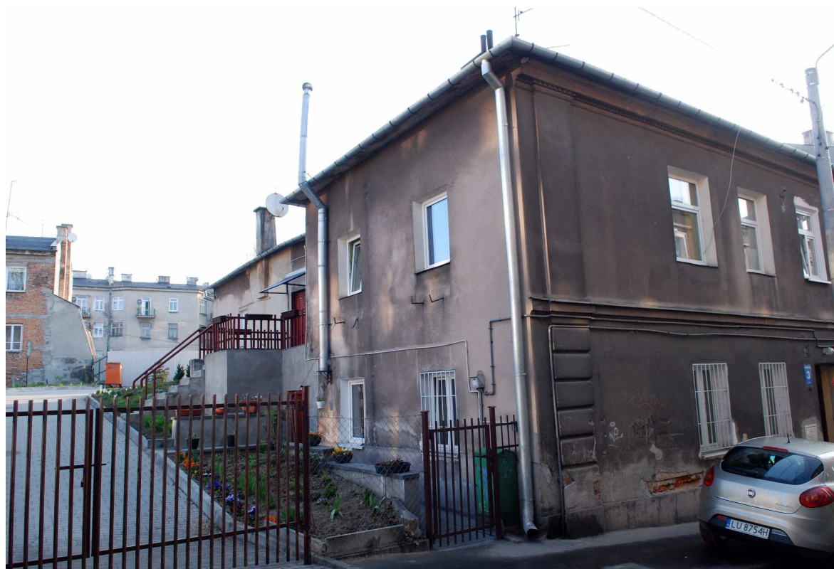
Oficyna, Probostwo 3, fot. Marcin Moszyński 2010.