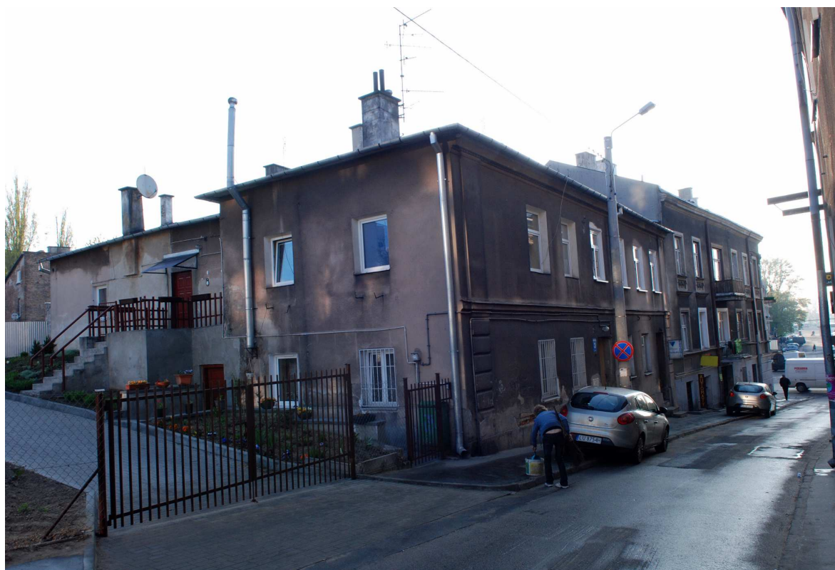
Oficyna, Probostwo 3, 2010.