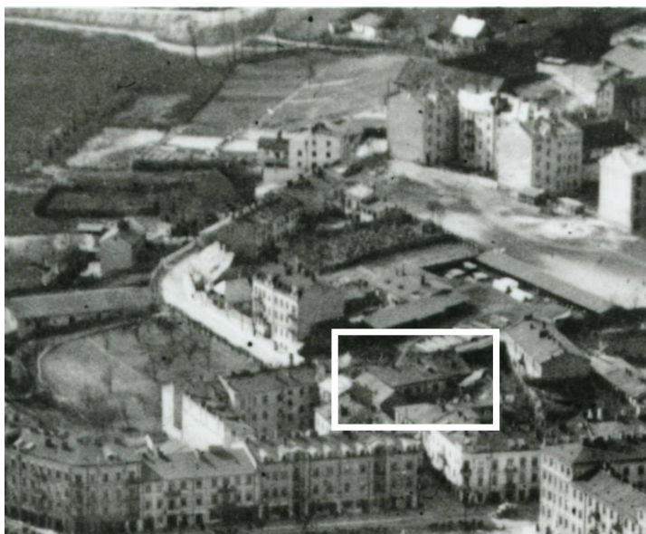
Fragment panoramy Lublina, lata 30., ul. Probostwo/A fragment of panorama of Lublin in the 1930s, Probostwo street,