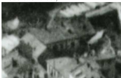
Fragment panoramy Lublina, lata 30., Probostwo 3/A fragment of panorama of Lublin in the 1930s, Probostwo 3,