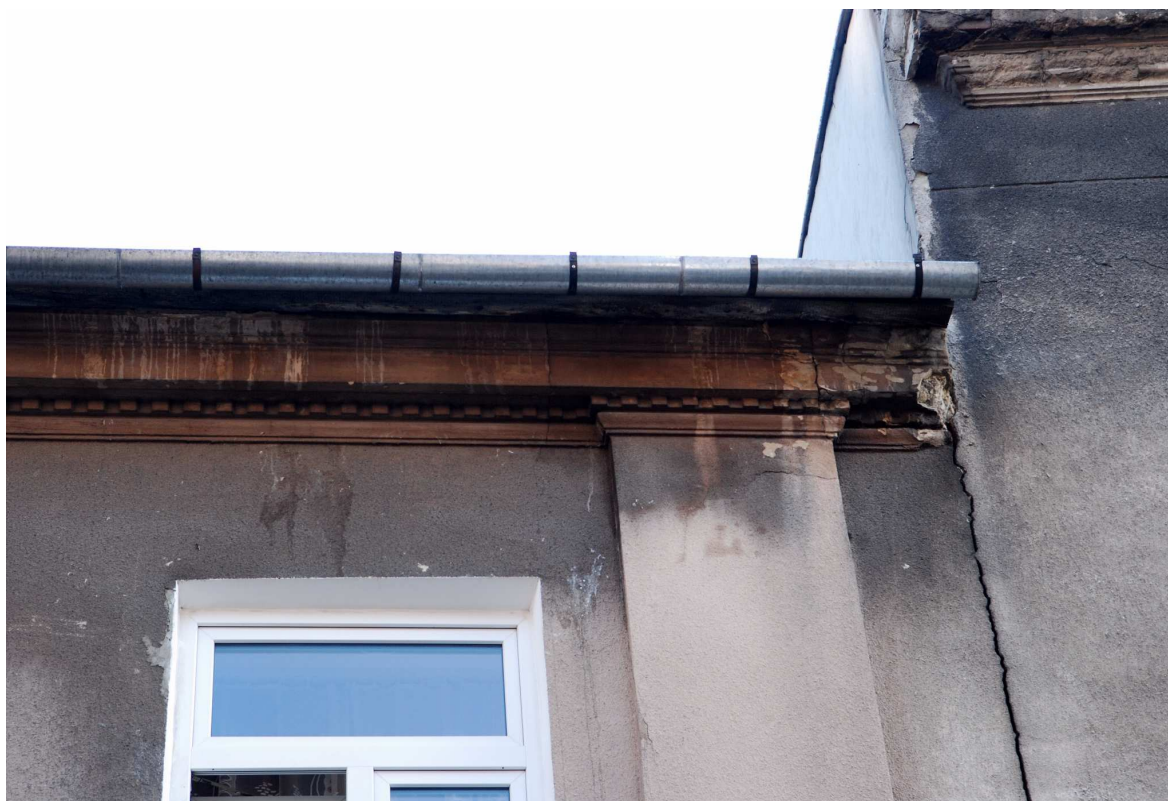
Detal, Probostwo 3, fot. Marcin Moszyński, 2010.