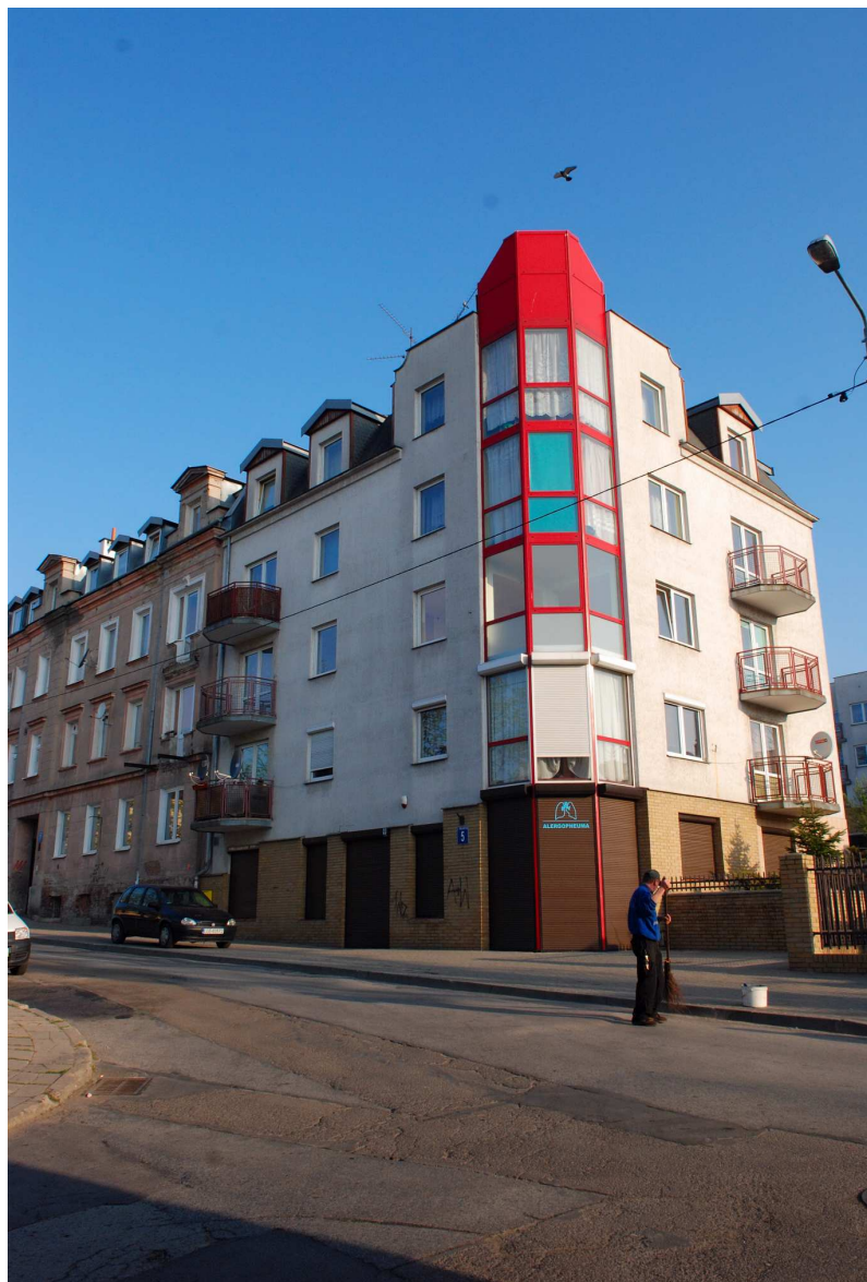
Fasada, Probostwo 5, fot. Marcin Moszyński, 2010.