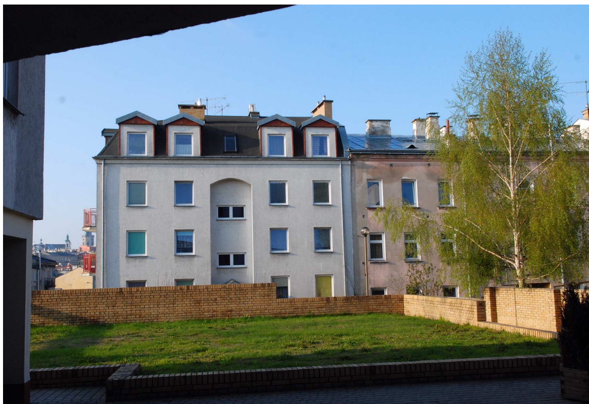
Podwórk, Probostwo 5, fot. Marcin Moszyński, 2010.