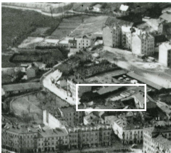
Fragment panoramy Lublina, lata 30., ul. Probostwo/A fragment of panorama of Lublin in the 1930s, Probostwo street,