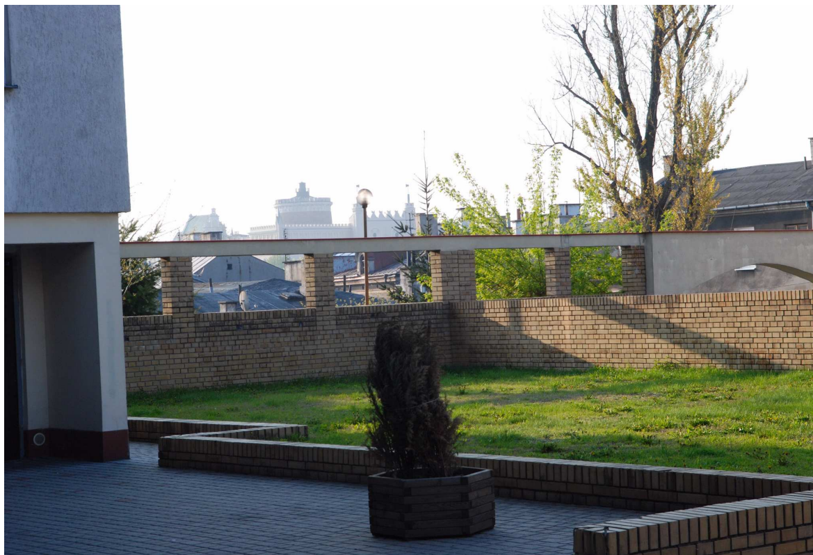
Podwórk, Probstwo 5, fot. Marcin Moszyński, 2010.