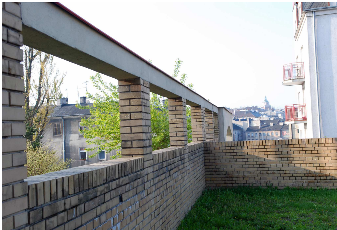
Podwórko, Probostwo 5, fot. Marcin Moszyński 2010.