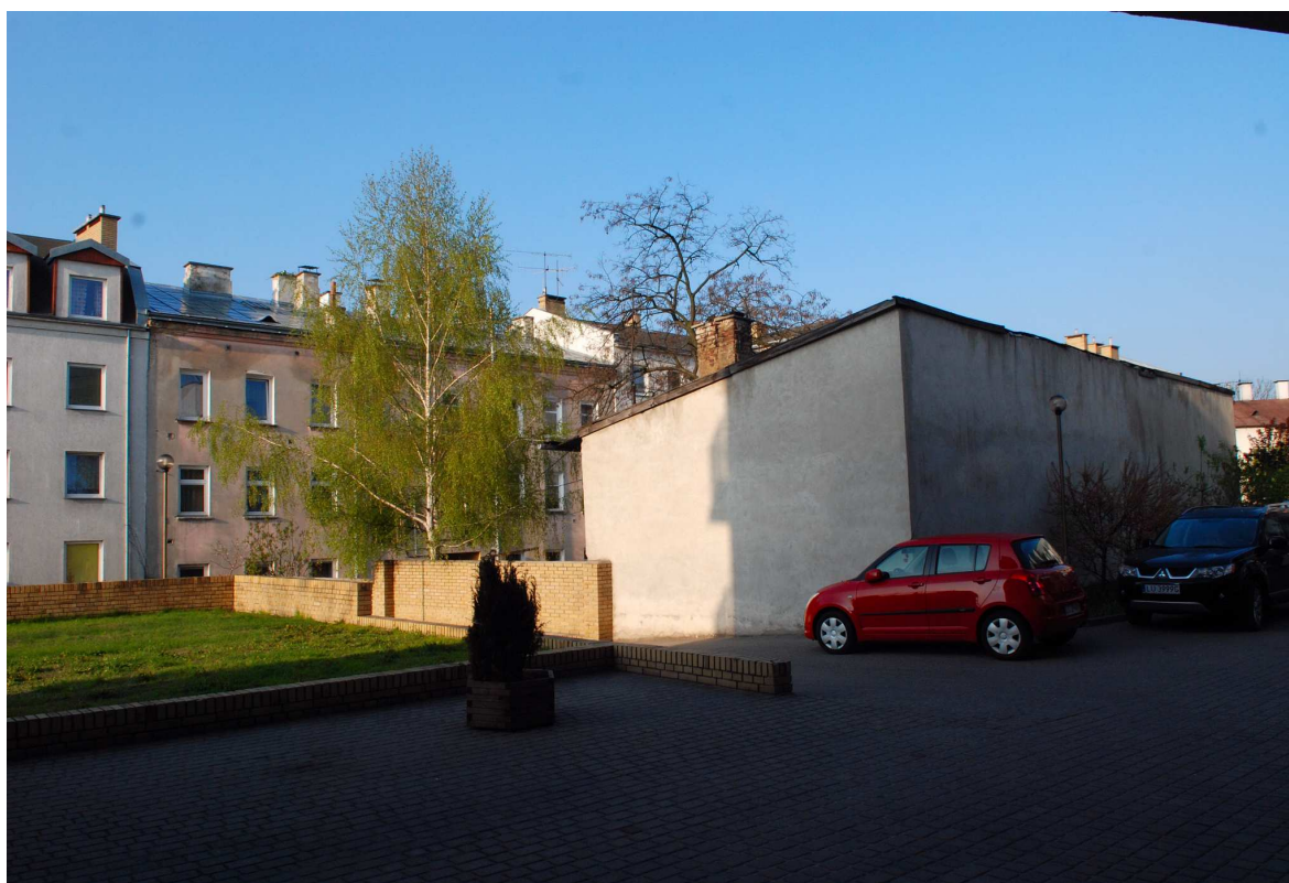
Podwórko, Probostwo 5, fot. Marcin Moszyński, 2010.