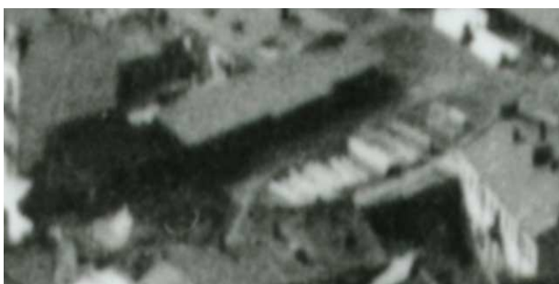
Fragment panoramy Lublina, lata 30., Probostwo 5/A fragment of panorama of Lublin in the 1930s, Probostwo 5,