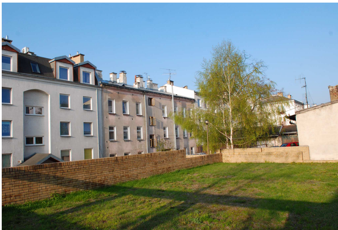
Podwórko, Probostwo 5, fot. Marcin Moszyński, 2010.