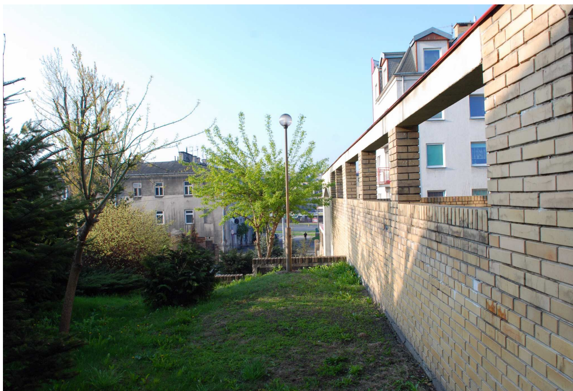
Podwórko, Probostwo 5, fot. Marcin Moszyński 2010.