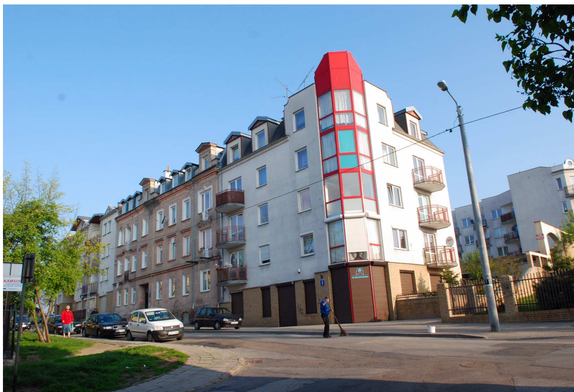
Fasada, Probostwo 5, fot. Marcin Moszyński, 2010.