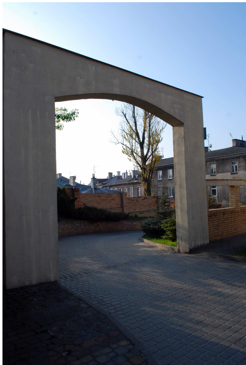
Podwórko, Probostwo 5, fot. Marcin Moszyński 2010.