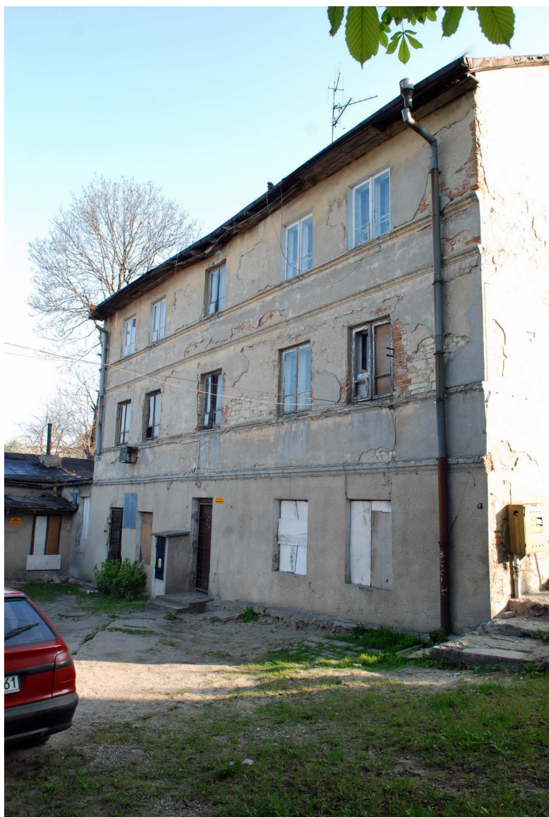
Elewacja tylna, Probostwo 6, fot. Marcin Moszyński, 2010.