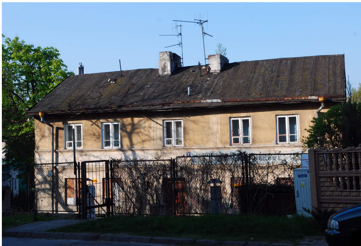
Fasada, Probostwo 6 2010.