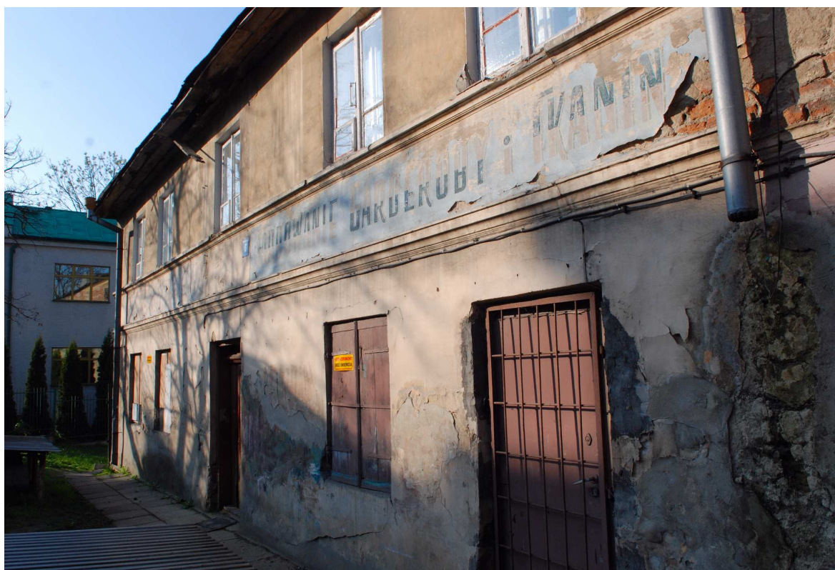
Fasada, Probostwo 6, fot. Marcin Moszyński, 2010.