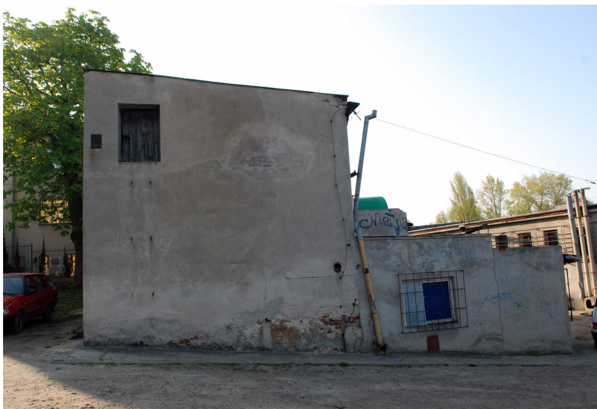
Elewacja boczna, Probostwo 6, fot. Marcin Moszyński, 2010.