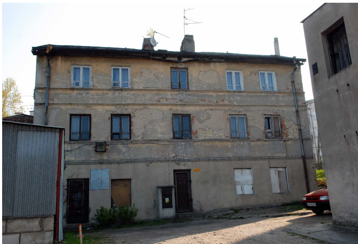
Podwórko, Probostwo 6, fot. Marcin Moszyński, 2010.