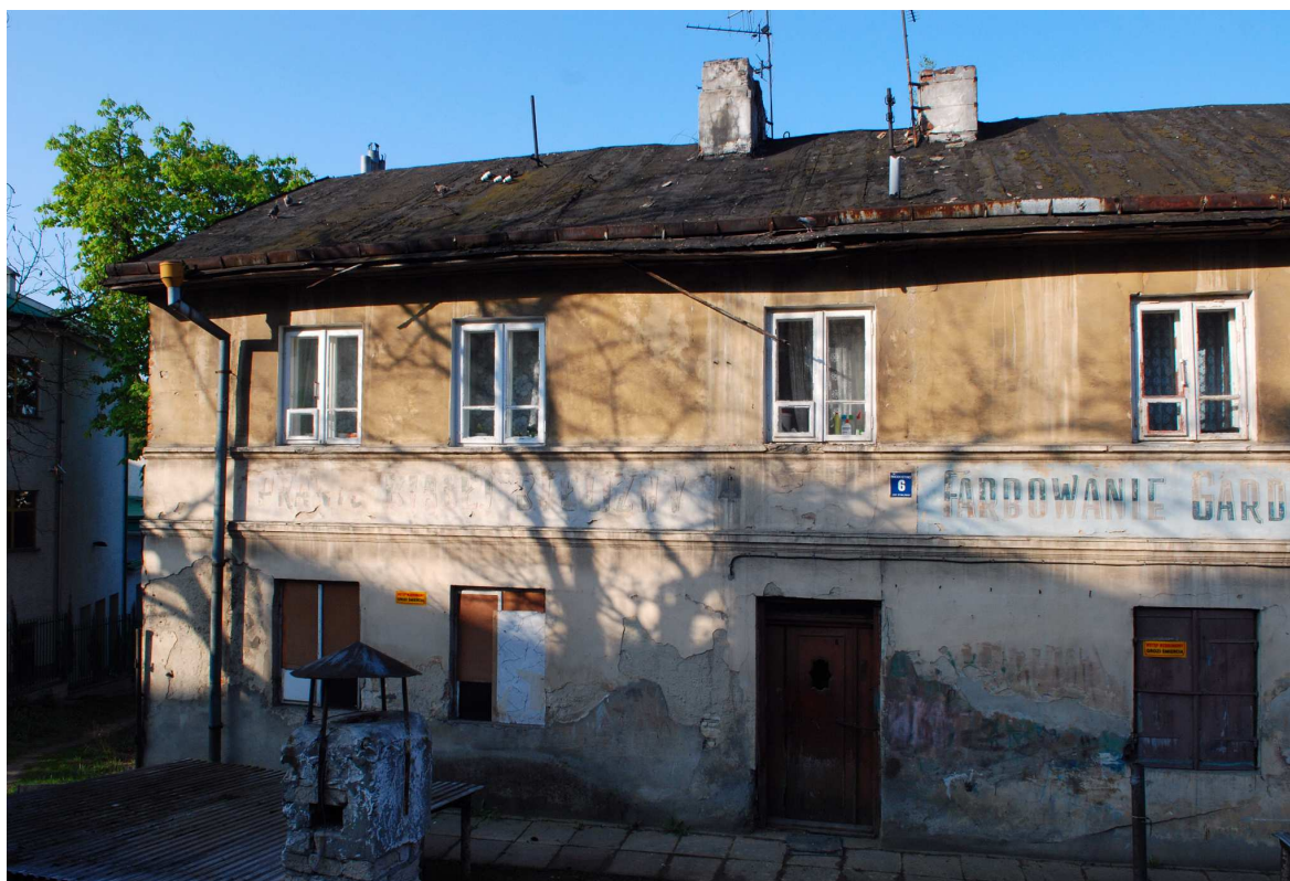
Fasada, Probostwo 6, fot. Marcin Moszyński, 2010.