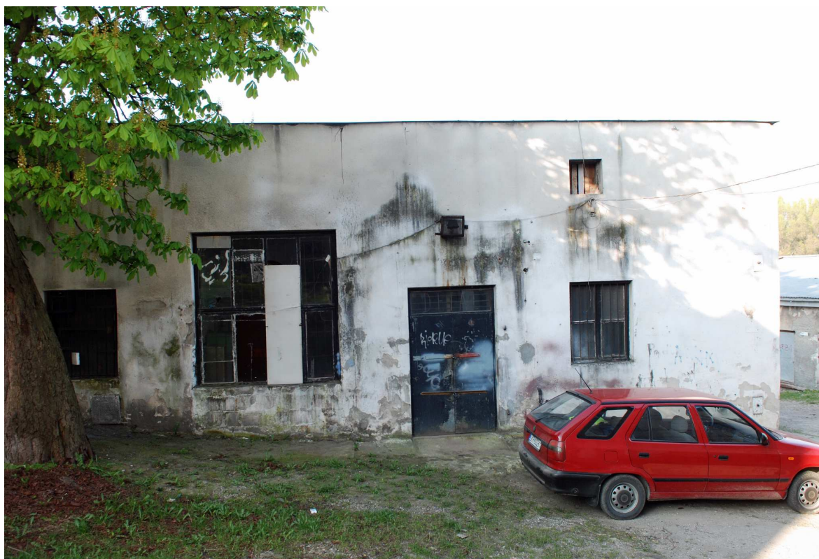
Podwórko, Probostwo 6, 2010.