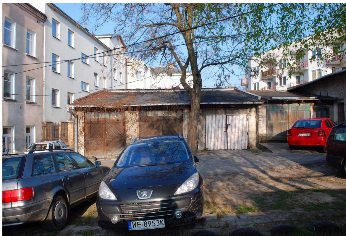
Podwórko, Probostwo 7, fot. Marcin Moszyński, 2010.