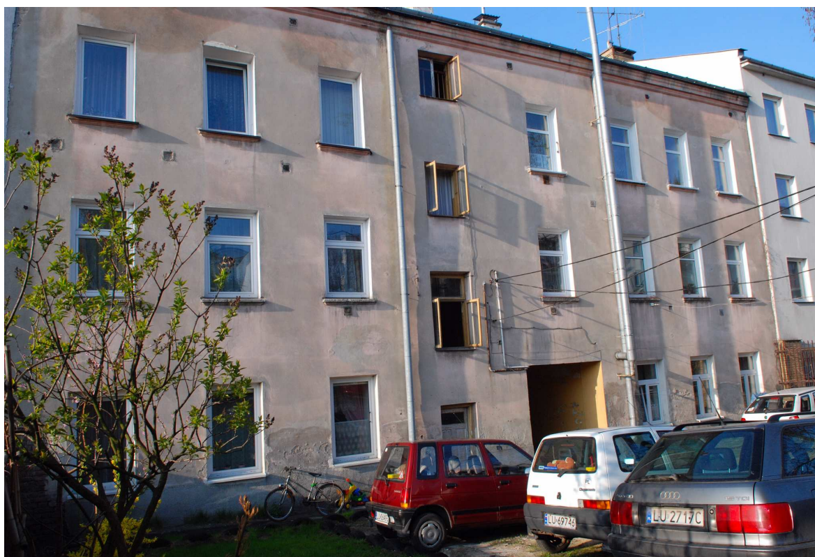
Elewacja tylna Probostwo 7, fot. Marcin Moszyński, 2010.