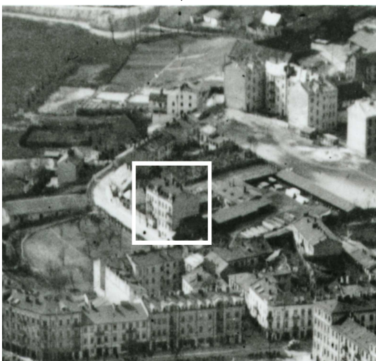
Fragment panoramy Lublina, lata 30., ul. Probostwo/A fragment of panorama of Lublin in the 1930s, Probostwo street,