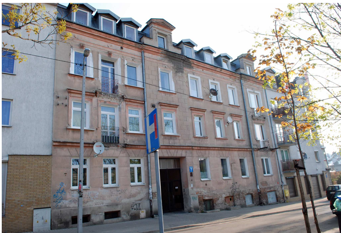
Fasada, Probostwo 7, fot. Marcin Moszyński, 2010.