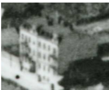
Fragment panoramy Lublina, lata 30., Probostwo 7/A fragment of panorama of Lublin in the 1930s, Probostwo 7,