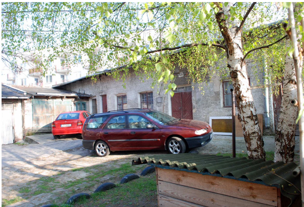
Podwórko, Probstwo 7, fot. Marcin Moszyński, 2010.