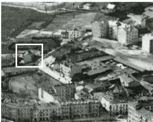
Fragment panoramy Lublina, lata 30., ul. Probostwo/A fragment of panorama of Lublin in the 1930s, Probostwo street,