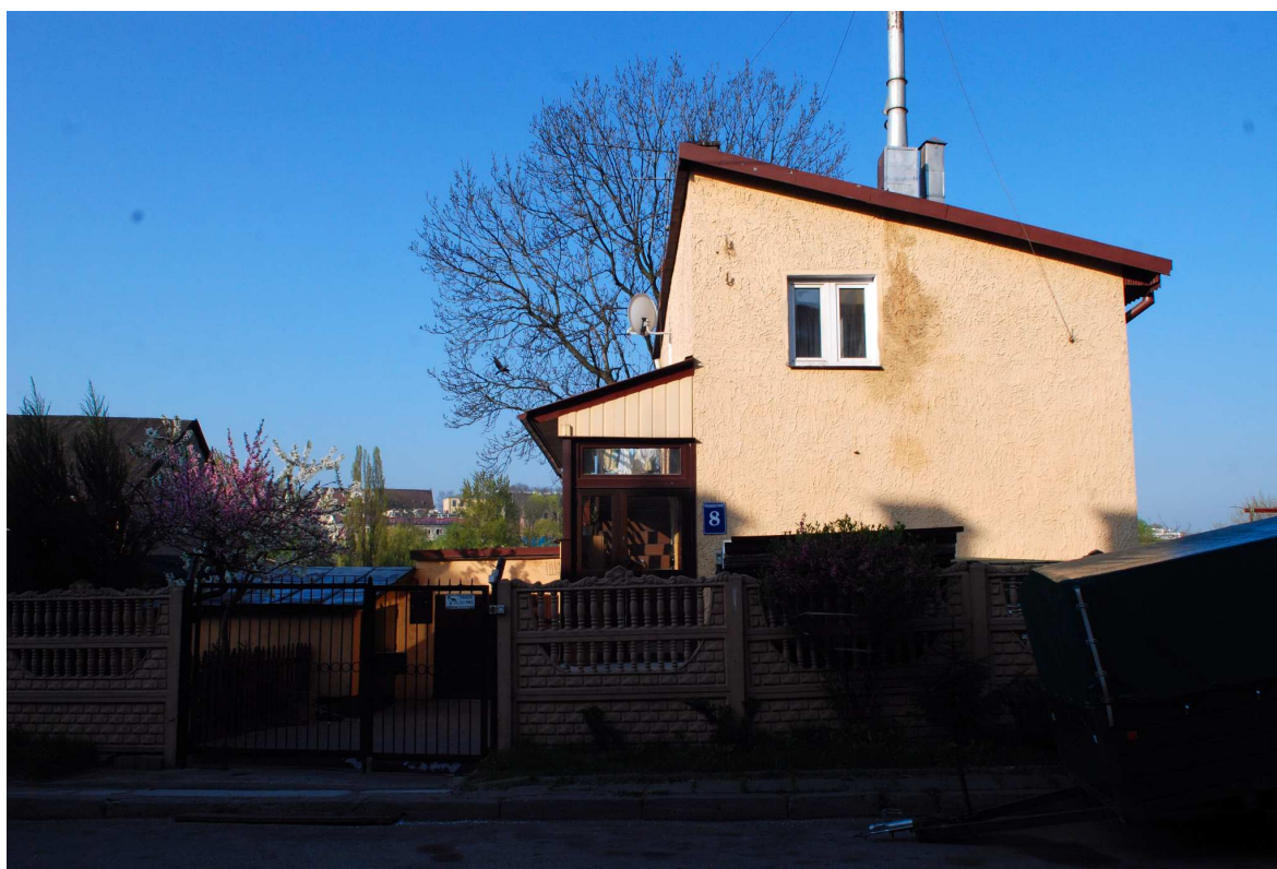
Fasada, Probostwo 8, fot. Marcin Moszyński, 2010.