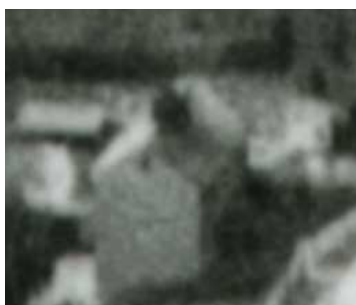
Fragment panoramy Lublina, lata 30., Probostwo 8/A fragment of panorama of Lublin in the 1930s, Probostwo 8,