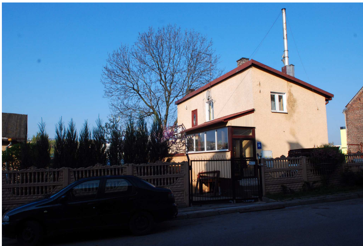
Fasada, Probostwo 8, fot. Marcin Moszyński, 2010.