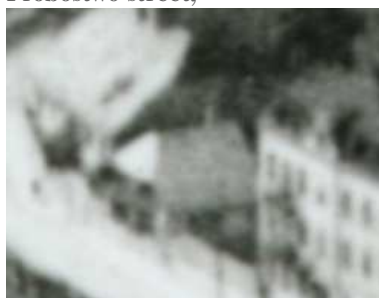
Fragment panoramy Lublina, lata 30., Probostwo 9/A fragment of panorama of Lublin in the 1930s, Probostwo 9,