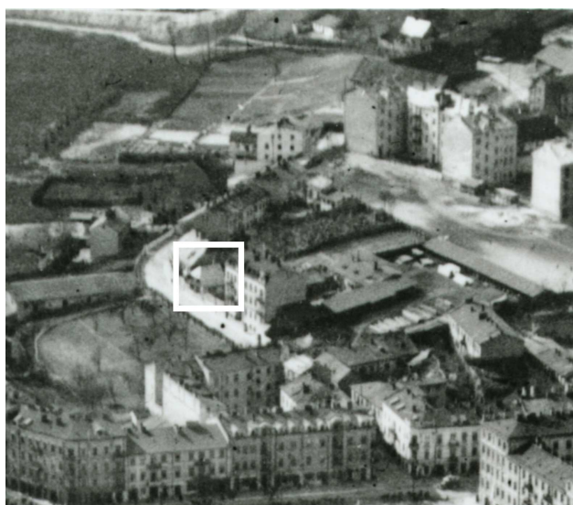
Fragment panoramy Lublina, lata 30., ul. Probostwo/A fragment of panorama of Lublin in the 1930s, Probostwo street,