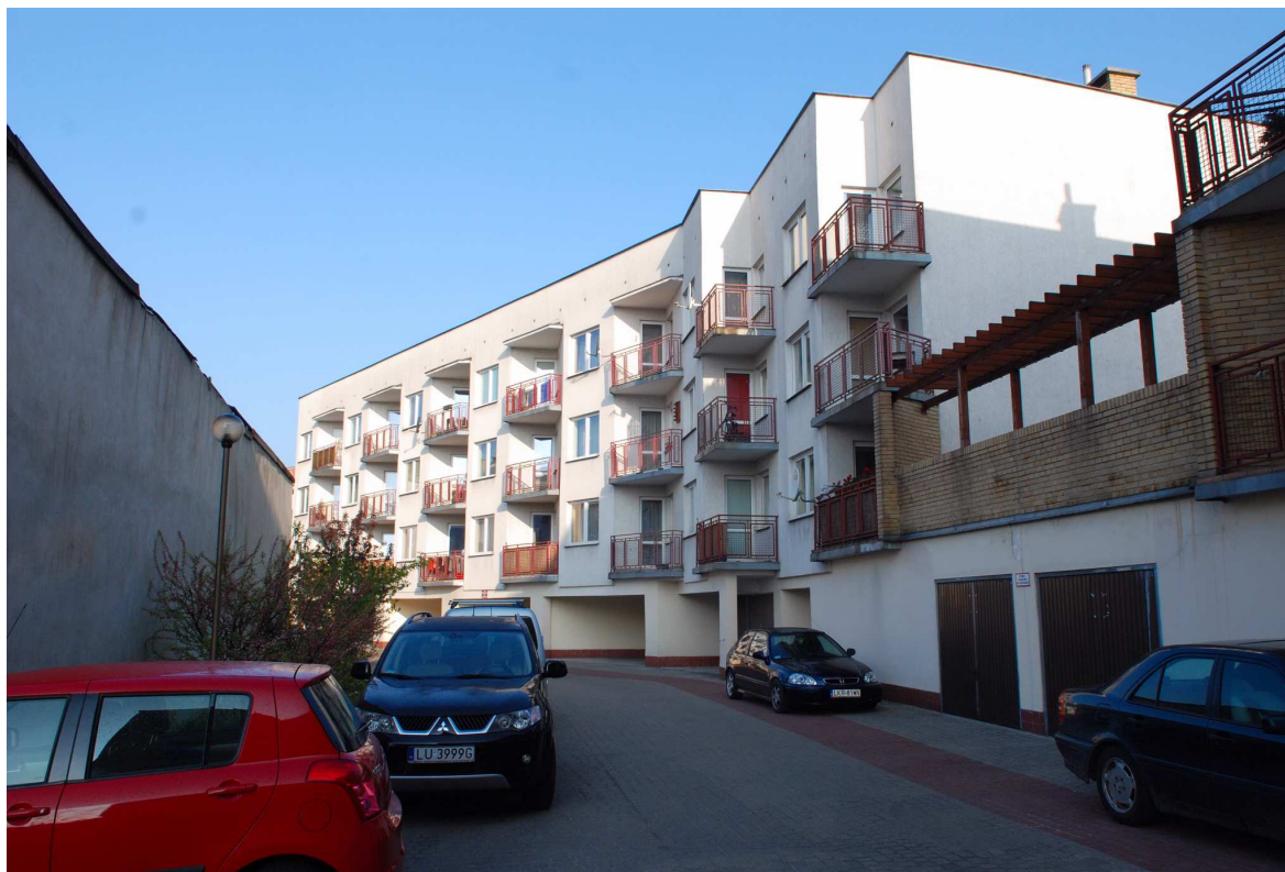
Fasada, Probostwo 9, 2010.