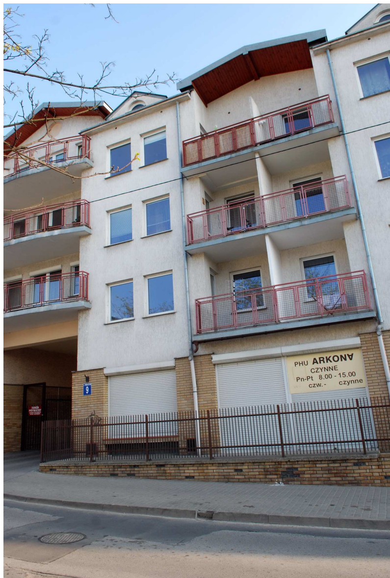
Fasada, Probstwo 9, 2010.