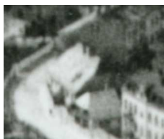
Fragment panoramy Lublina, lata 30., Probstwo 11/A fragment of panorama of Lublin in the 1930s, Probstwo 11,