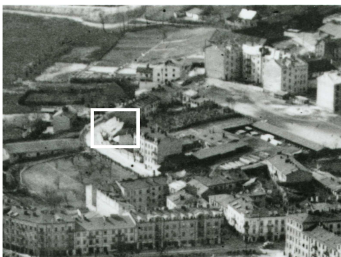
Fragment panoramy Lublina, lata 30., ul. Probstwo/A fragment of panorama of Lublin in the 1930s, Probstwo street,