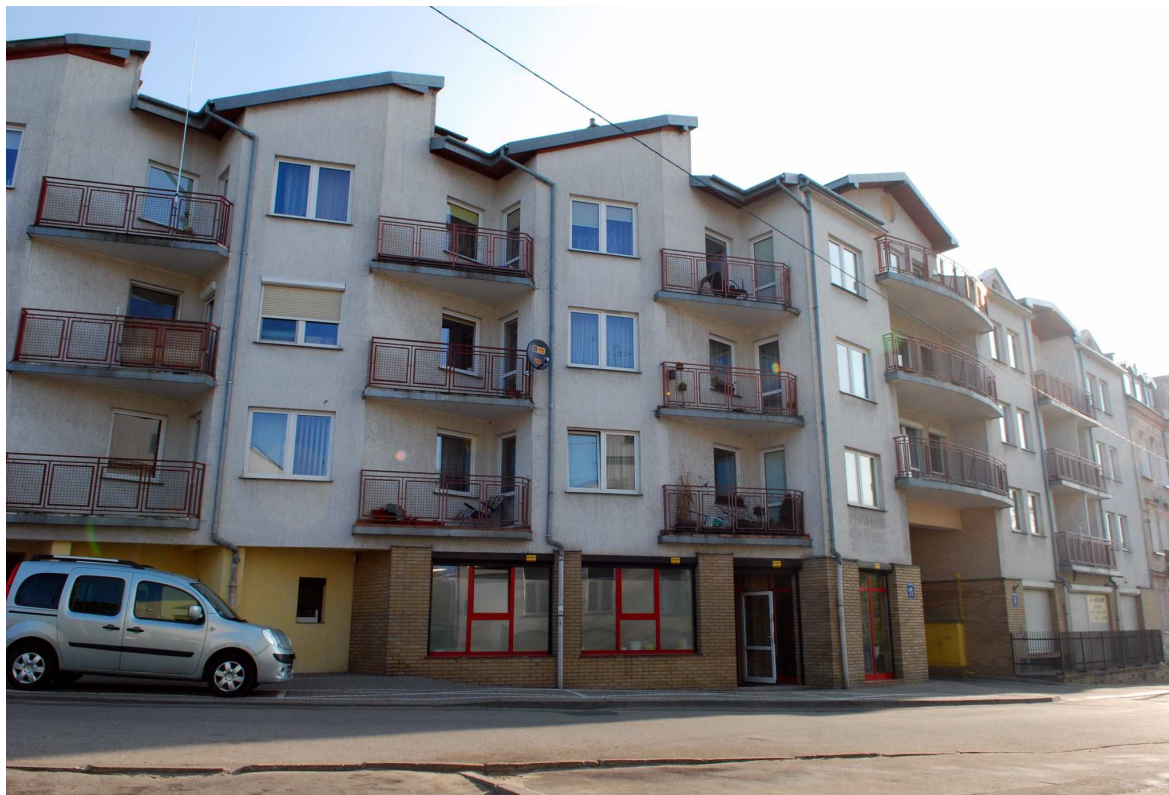
Fasada, Probostwo 11, fot. Marcin Moszyński, 2010.