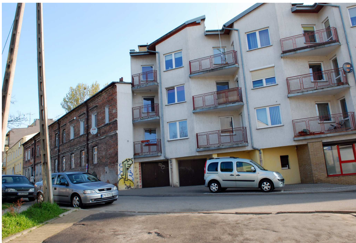
Fasada, Probostwo 11 fot. Marcin Moszyński, 2010.