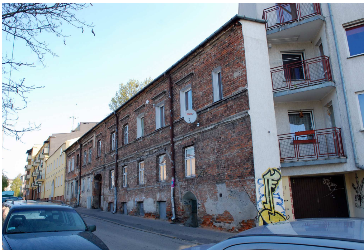
Fasada, Probstwo 13, fot. Marcin Moszyński, 2010.