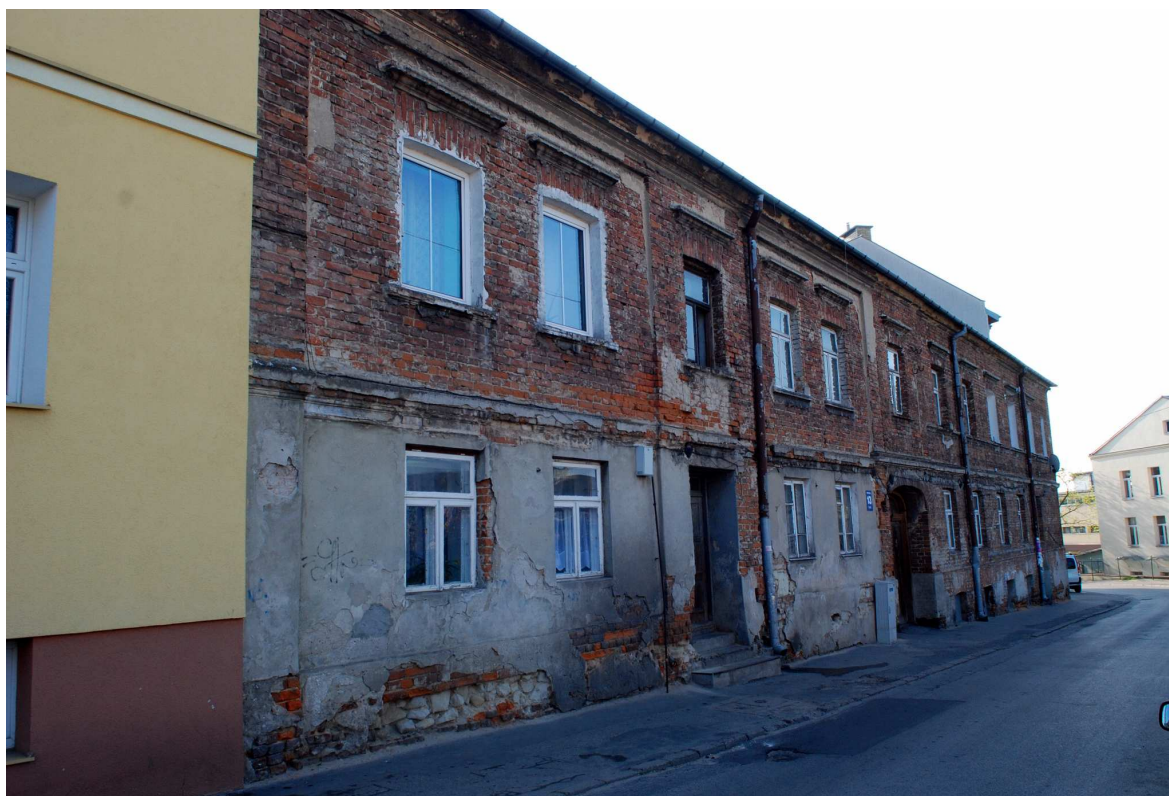
Fasada, Probostwo 13, fot. Marcin Moszyński, 2010.