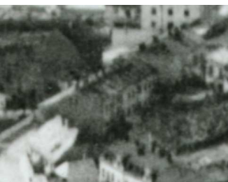
Fragment panoramy Lublina, lata 30., Probostwo 13/A fragment of panorama of Lublin in the 1930s, Probostwo 13,