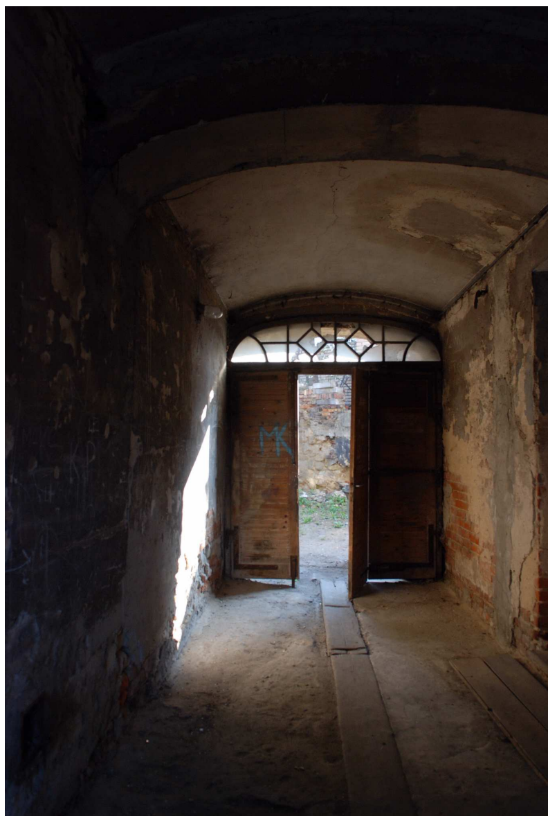
Brama, Probostwo 13, fot. Marcin Moszyński, 2010.