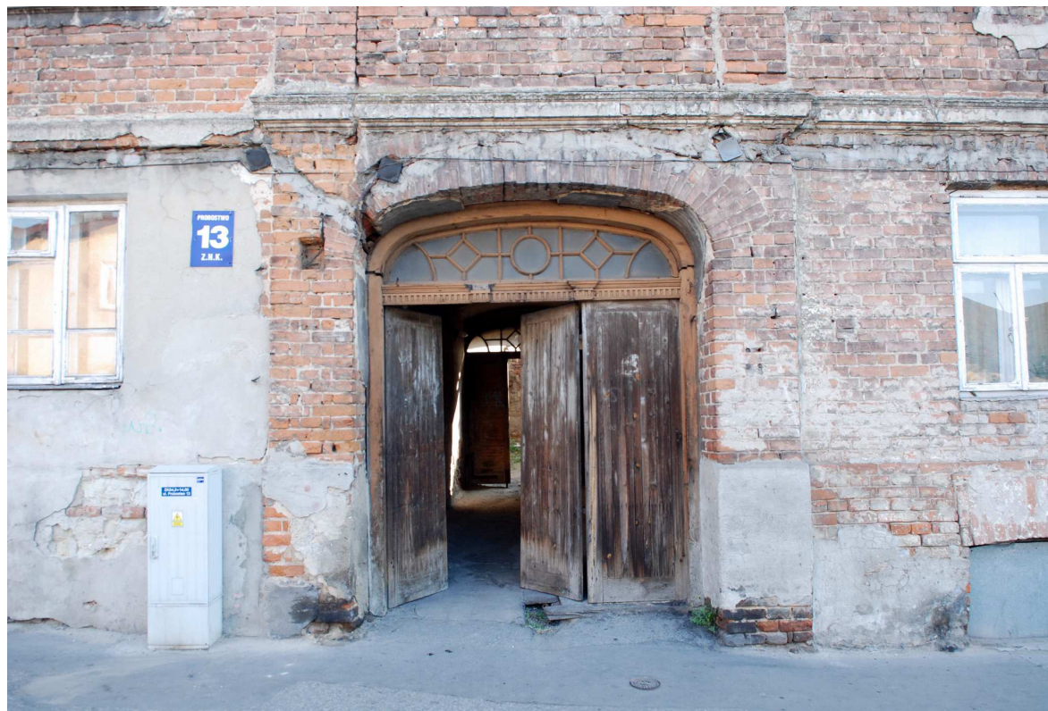
Brama, Probostwo 13, fot. Marcin Moszyński, 2010.