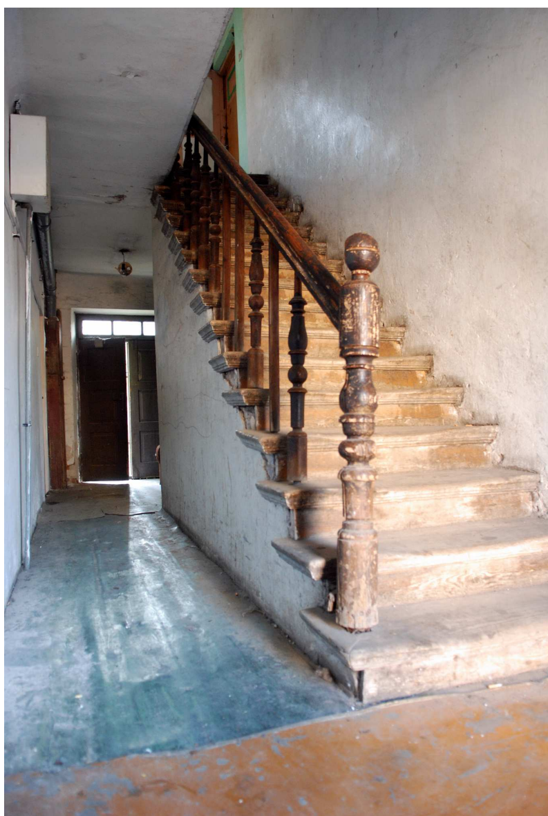
Klatka schodowa, Probostwo 13, fot. Marcin Moszyński, 2010.