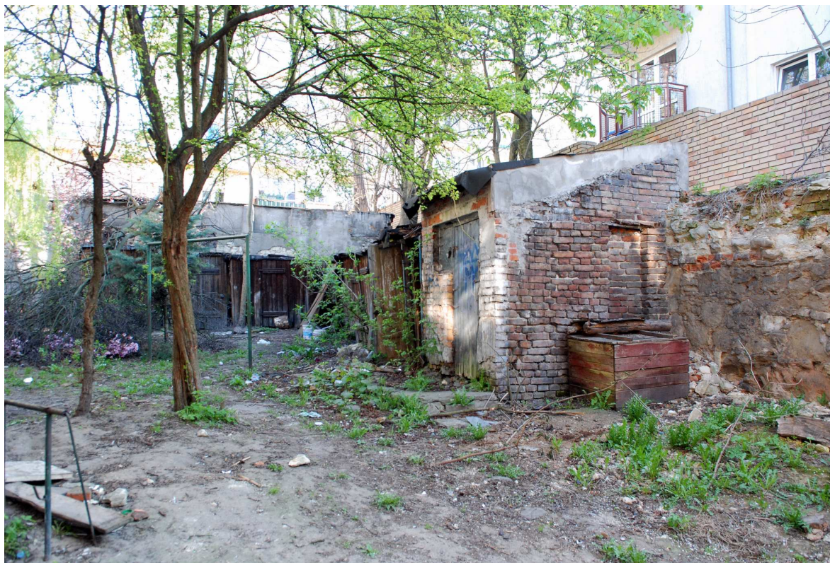
Podwórko, Probostwo 13, fot. Marcin Moszyński, 2010.