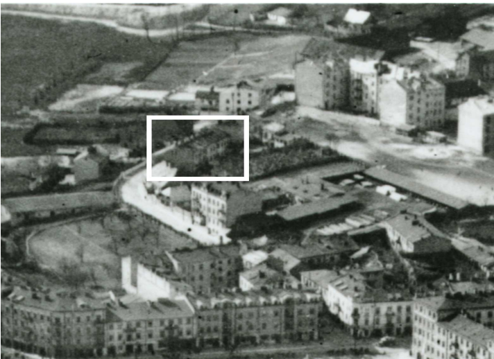
Fragment panoramy Lublina, lata 30., ul. Probostwo/A fragment of panorama of Lublin in the 1930s, Probostwo street,