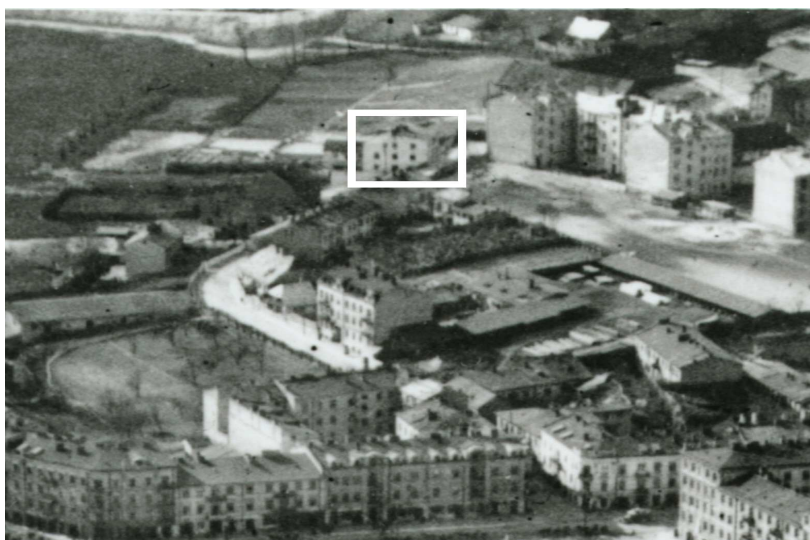
Fragment panoramy Lublina, lata 30., ul. Probostwo/A fragment of panorama of Lublin in the 1930s, Probostwo street,