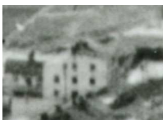
Fragment panoramy Lublina, lata 30., Probostwo 14/A fragment of panorama of Lublin in the 1930s, Probostwo 14,