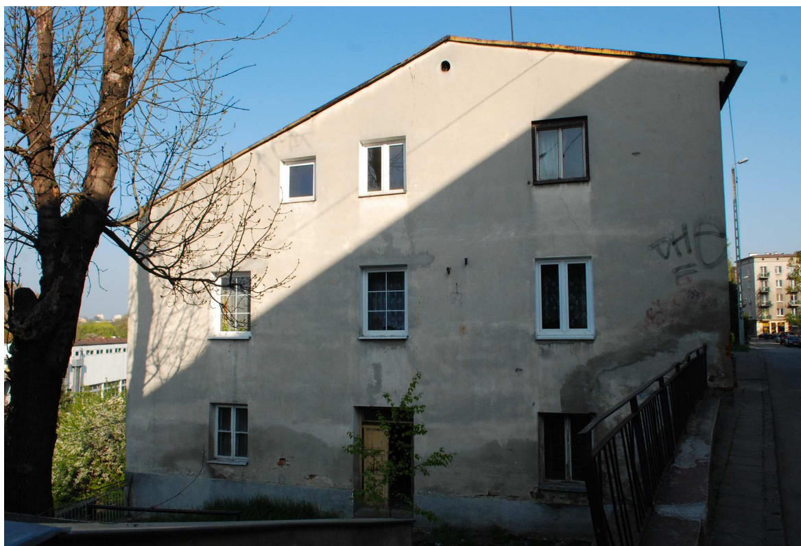
Elewacja boczna, Probostwo 14, fot. Marcin Moszyński, 2010.