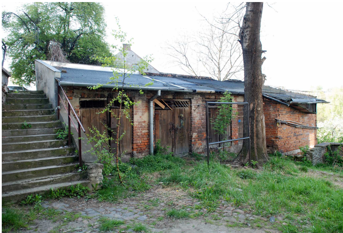
Komórki, Probostwo 14, fot. Marcin Moszyński, 2010.