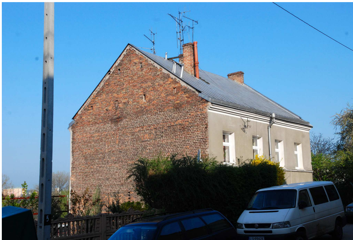
Fasada, Probostwo 14, fot. Marcin Moszyński, 2010.