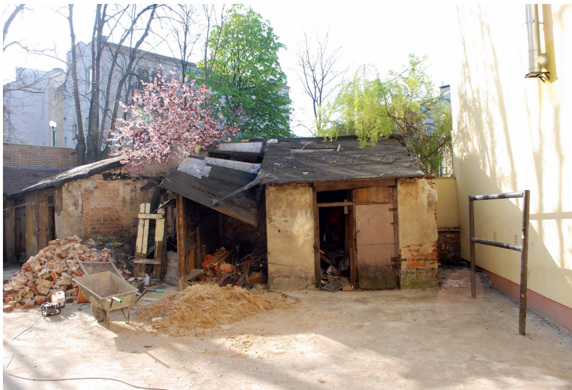
Komórki, Probostwo 15, fot. Marcin Moszyński, 2010.