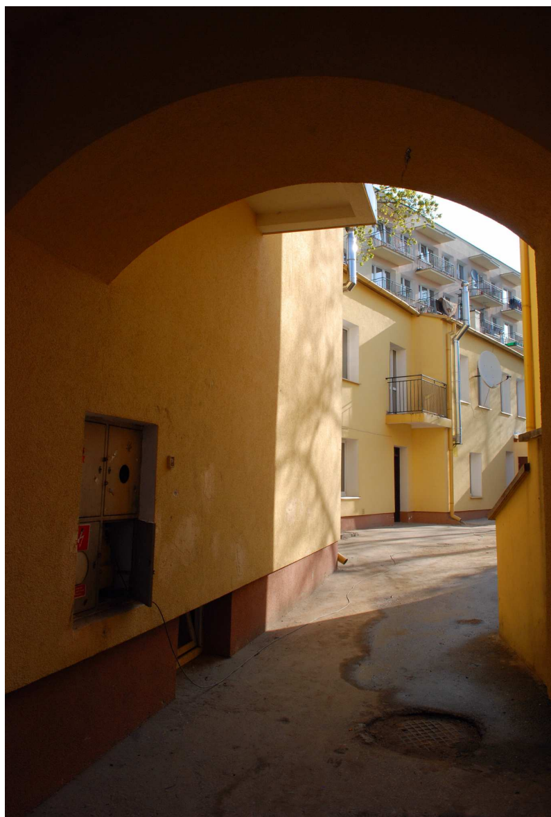
Brama, Probostwo 15, fot. Marcin Moszyński, 2010.