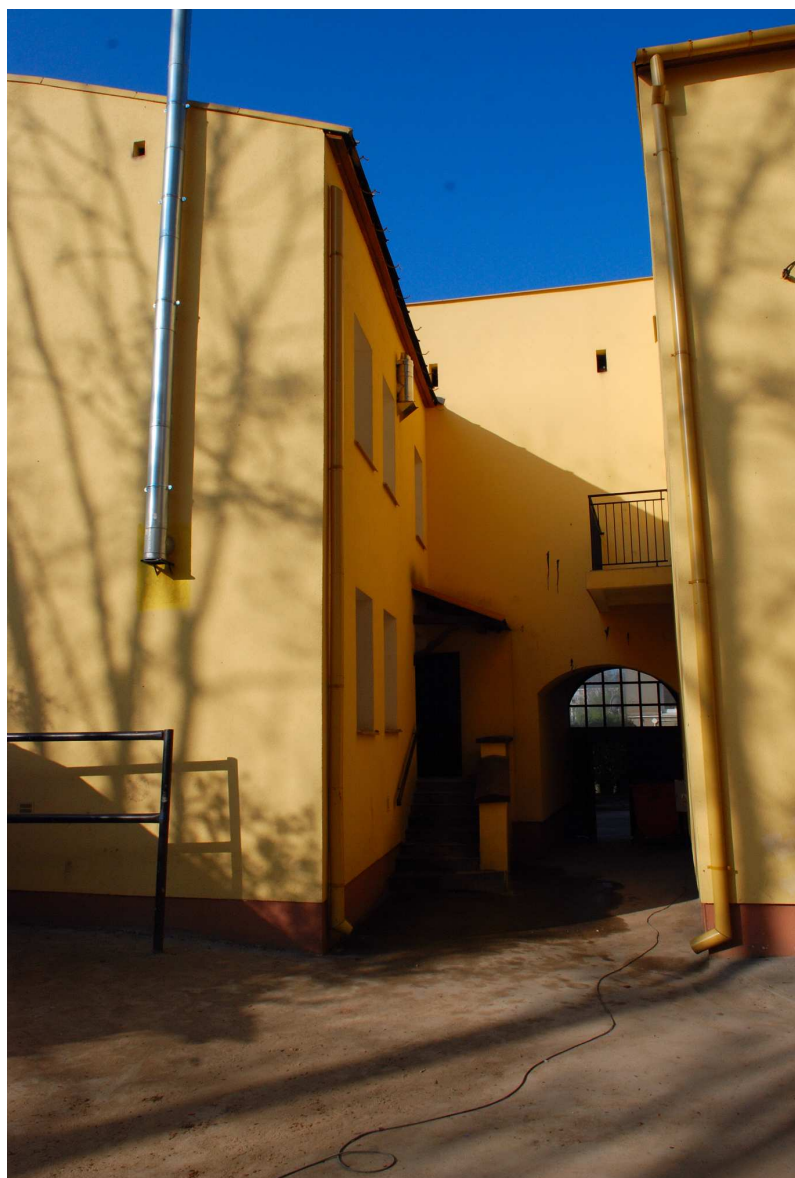
Podwórko, Probostwo 15, fot. Marcin Moszyński, 2010.