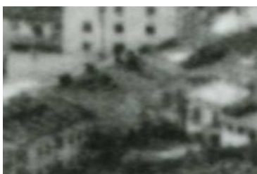
Fragment panoramy Lublina, lata 30., Probostwo 15/A fragment of panorama of Lublin in the 1930s, Probostwo 15,