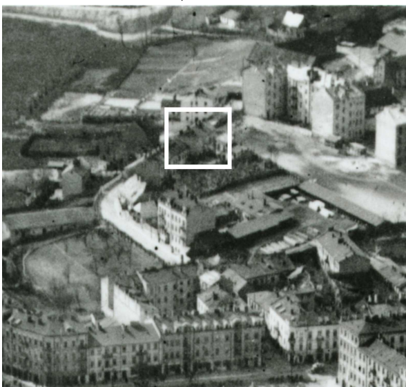
Fragment panoramy Lublina, lata 30., ul. Probostwo/A fragment of panorama of Lublin in the 1930s, Probostwo street,