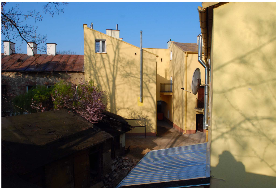
Podwórko, Probostwo 15, fot. Marcin Moszyński, 2010.