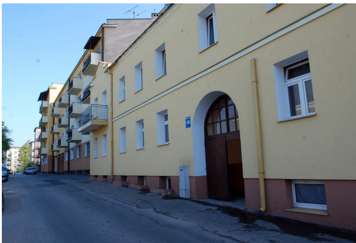
Fasada, Probostwo 15, fot. Marcin Moszyński, 2010.