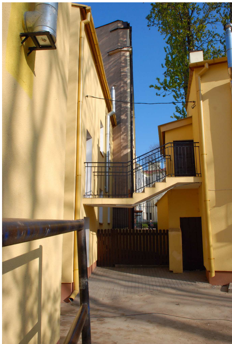
Podwórko, Probostwo 15, fot. Marcin Moszyński, 2010.