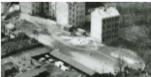
Fragment panoramy Lublina, lata 30., Probostwo 17/A fragment of panorama of Lublin in the 1930s, Probostwo 17,