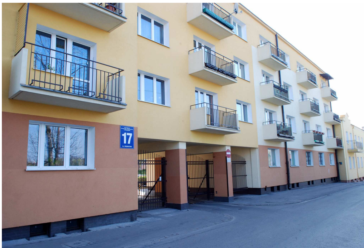
Fasada, Probstwo 17, fot. Marcin Moszyński, 2010.