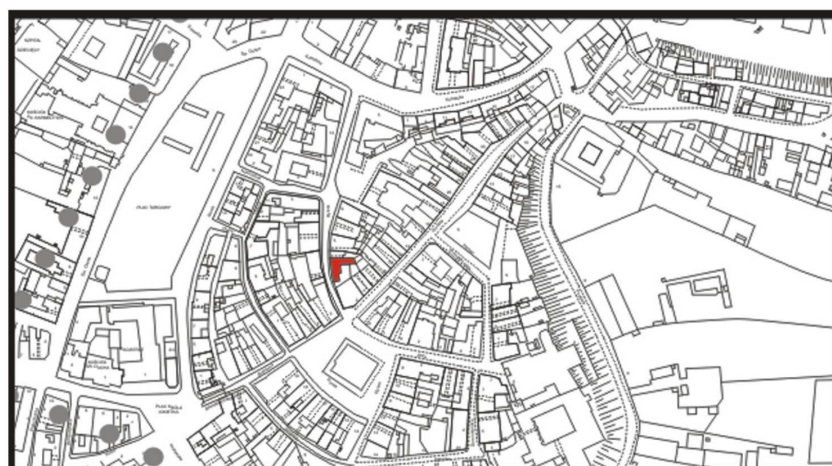
LOKALIZACJA NIERUCHOMOŚCI - Rybna 3 LOCATION OF THE PROPERTY - Rybna 3