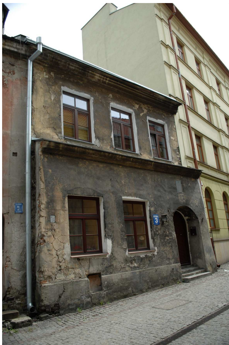
Fasada, Rybna 3, fot. Piotr Sztajdel, 2010.