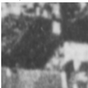
Fragment panoramy Lublina, lata 30., Rybna 3/A fragment of panorama of Lublin in the 1930s, Rybna 3,