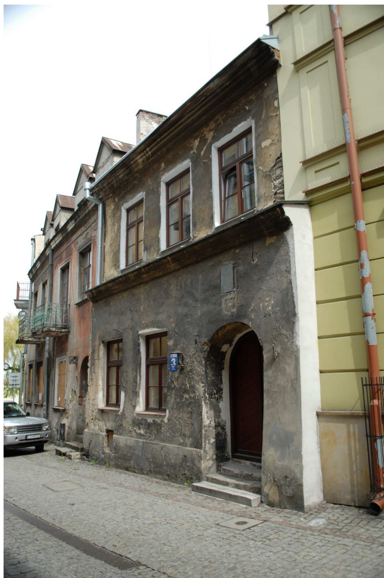
Fasada, Rybna 3, fot. Piotr Sztajdel, 2010.