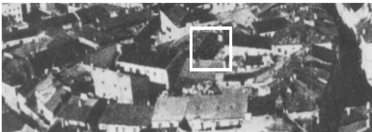
Fragment panoramy Lublina, lata 30., ul. Rybna/A fragment of panorama of Lublin in the 1930s, Rybna street,