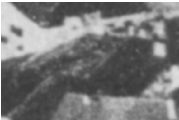
Fragment panoramy Lublina, lata 30., Rybna 5/A fragment of panorama of Lublin in the 1930s, Rybna 5,