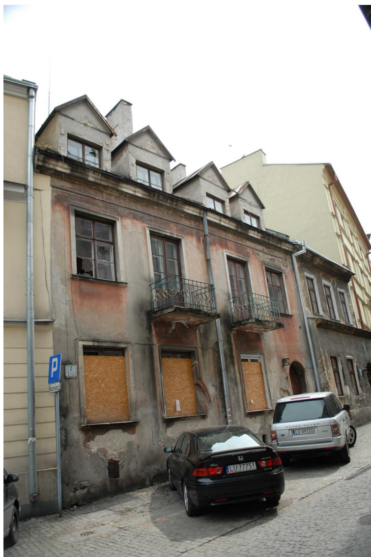
Fasada, Rybna 5, fot. Piotr Sztajdel, 2010.