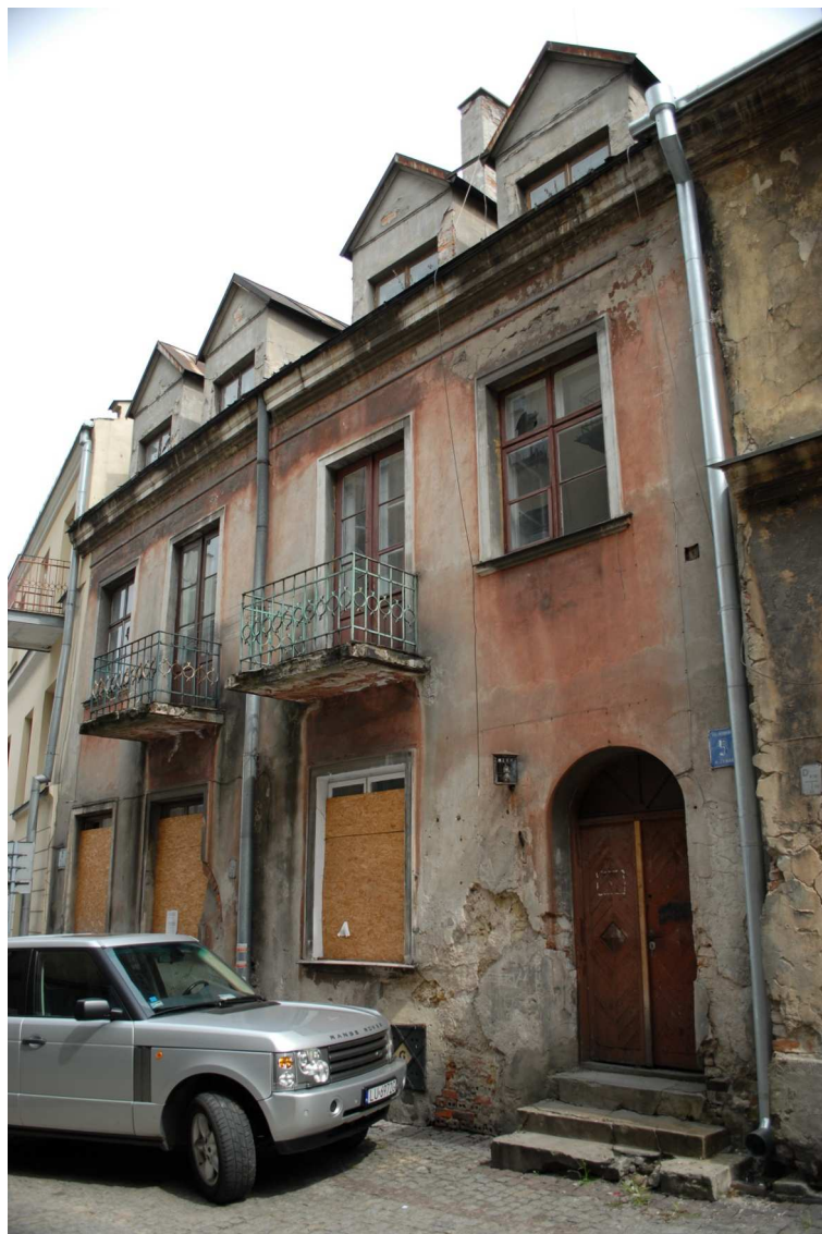
Fasada, Rybna 5, fot. Piotr Sztajdel, 2010.