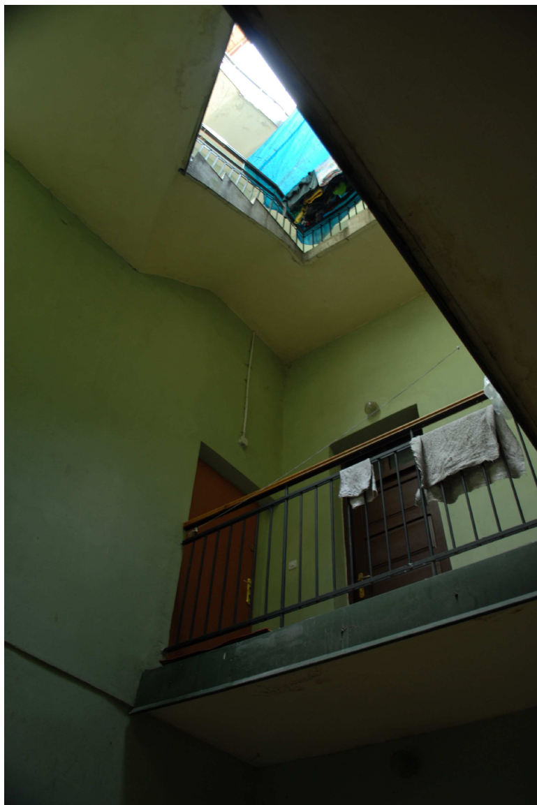
Klatka schodowa, Rybna 8/Noworybna3, fot. Piotr Sztajdel, 2010.