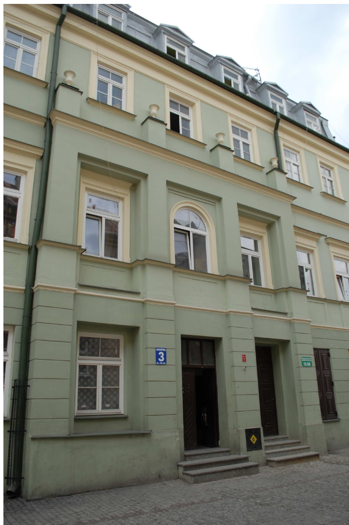
Fasada, Rybna 8/Noworybna3, fot. Piotr Sztajdel, 2010.