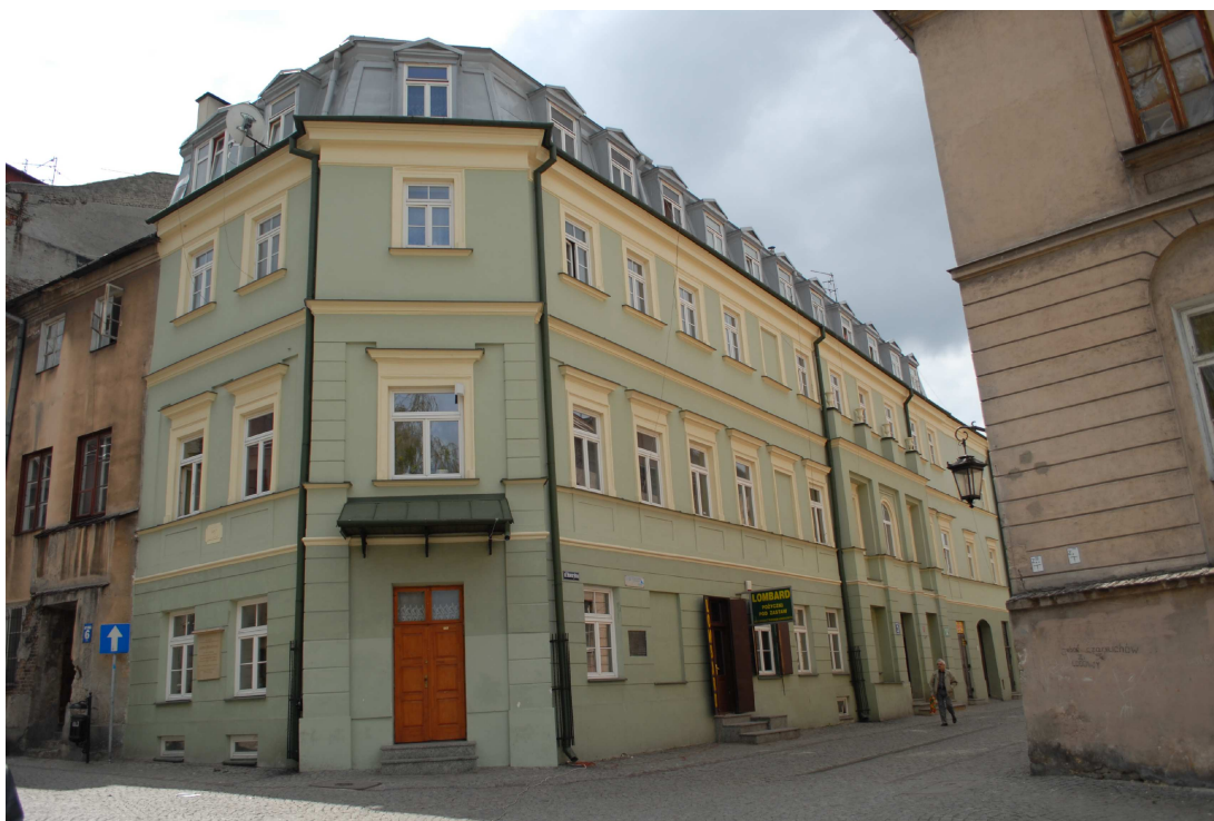
Fasada, Rybna 8/Noworybna3, fot. Piotr Sztajdel, 2010.