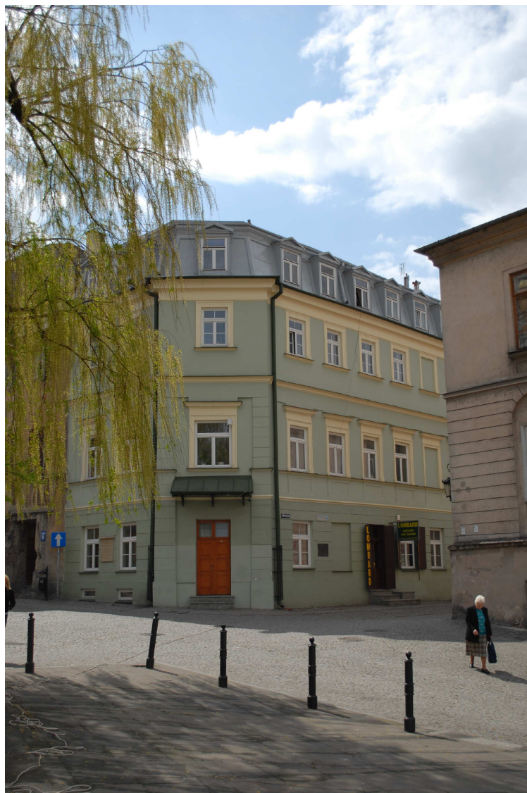
Fasada, Rybna 8/Noworybna3, fot. Piotr Sztajdel, 2010.