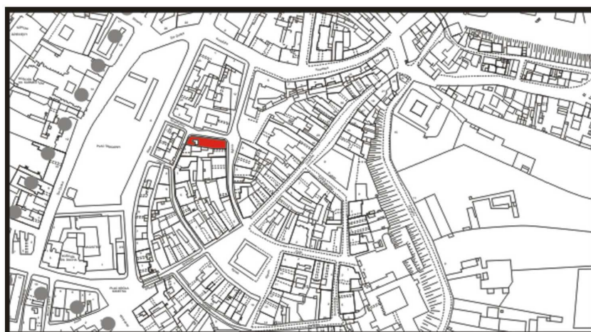
LOKALIZACJA NIERUCHOMOŚCI - Rybna 8 LOCATION OF THE PROPERTY - Rybna 8