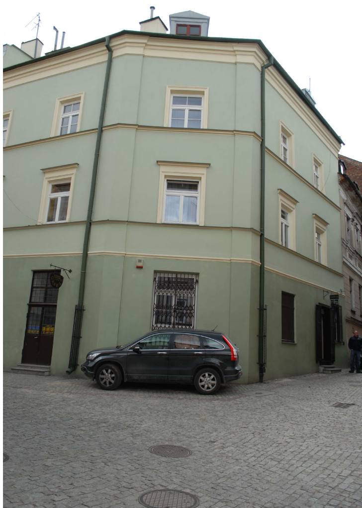
Fasada, Rybna 8/Noworybna3, fot. Piotr Sztajdel, 2010.