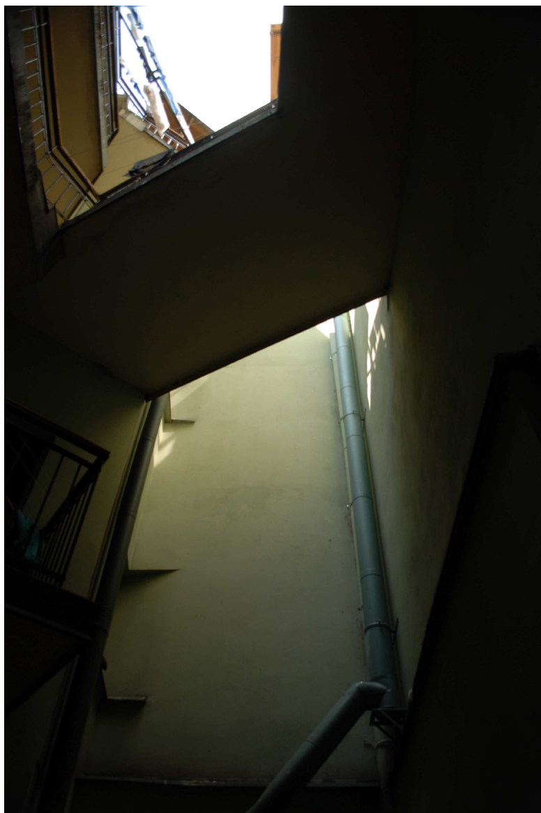
Klatka schodowa, Rybna 8/Noworybna3, fot. Piotr Sztajdel, 2010.