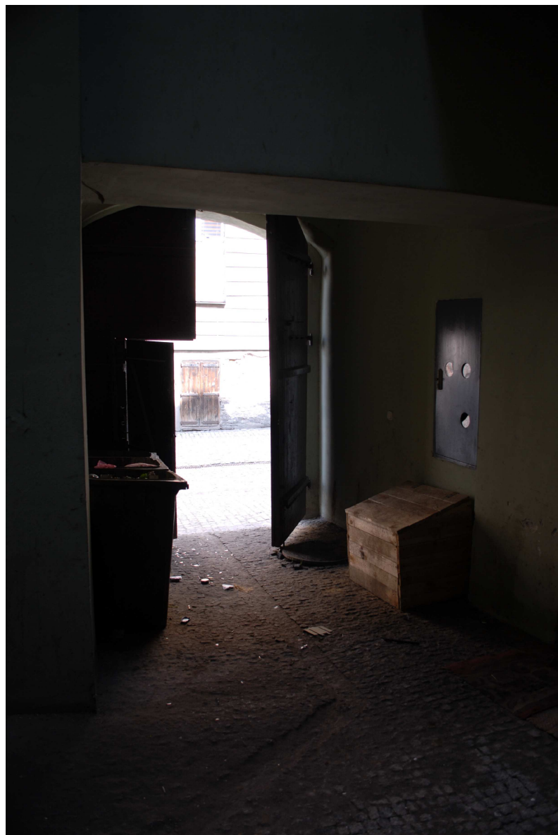
Brama, Rybna 8/Noworybna3, fot. Piotr Sztajdel, 2010.