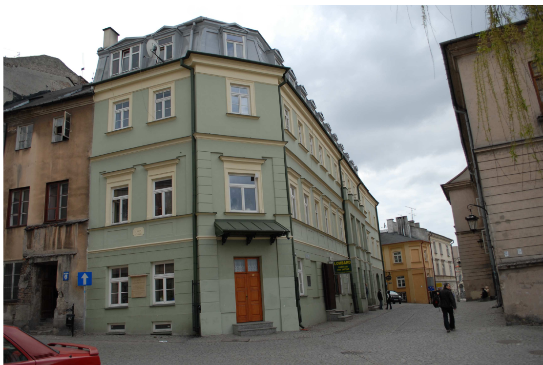
Fasada, Rybna 8/Noworybna3, fot. Piotr Sztajdel, 2010.