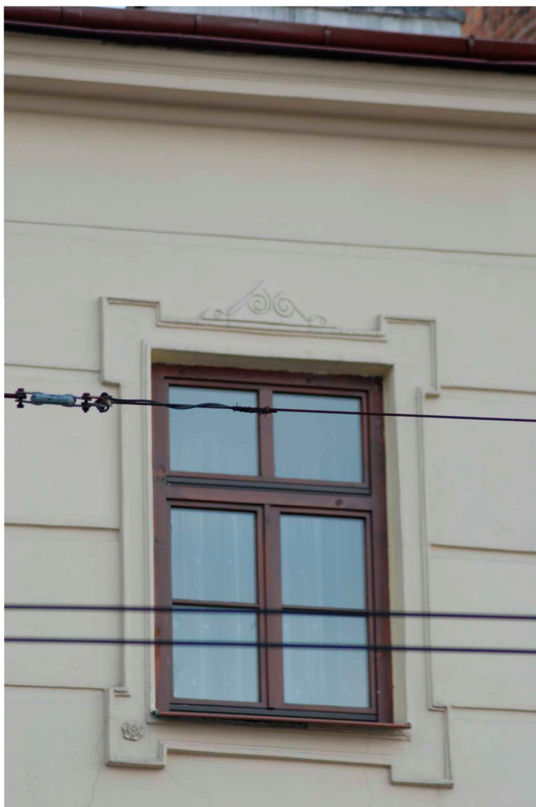
Detal, Lubartowska 1 dawna Nowa 1, fot. Piotr Sztajdel, 2010.