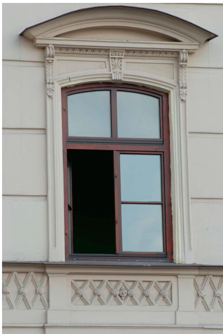
Detal, Lubartowska 1 dawna Nowa 1, fot. Piotr Sztajdel, 2010.