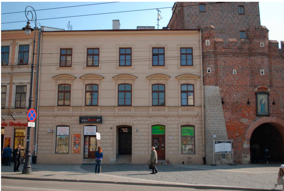
Fasada, Lubartowska 1 dawna Nowa 1, 2010.