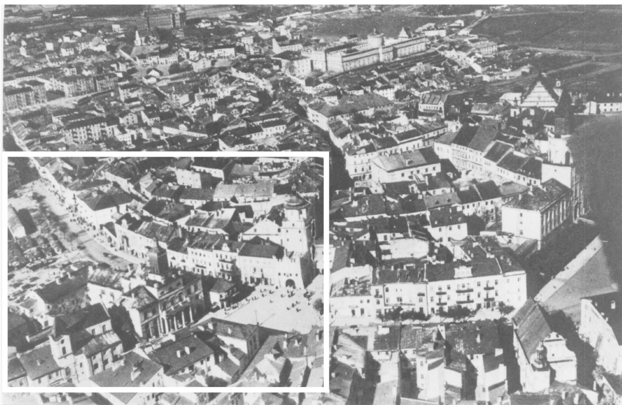
Panorama Lublina, lata 30./Panorama of Lublin in the 1930s,