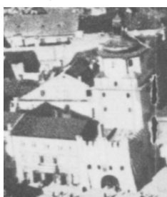
Fragment panoramy Lublina, lata 30., Nowa 1/A fragment of panorama of Lublin in the 1930s, Nowa 1,