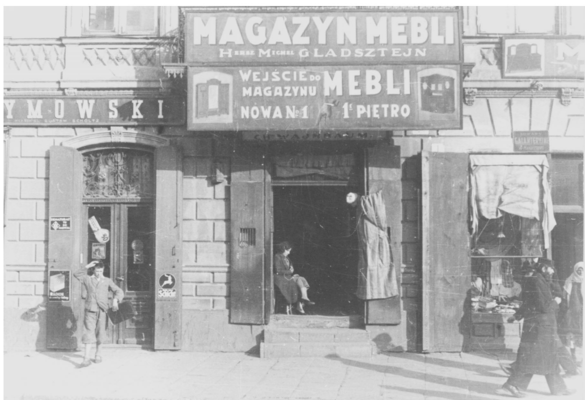
Nowa 1, autor Stefan Kielszna, 1938, własność Jerzy Kielsznia.