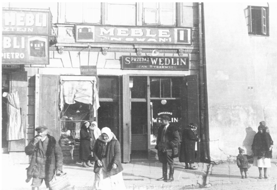
Nowa 1, autor Stefan Kielszna, 1938, własność Jerzy Kielsznia.