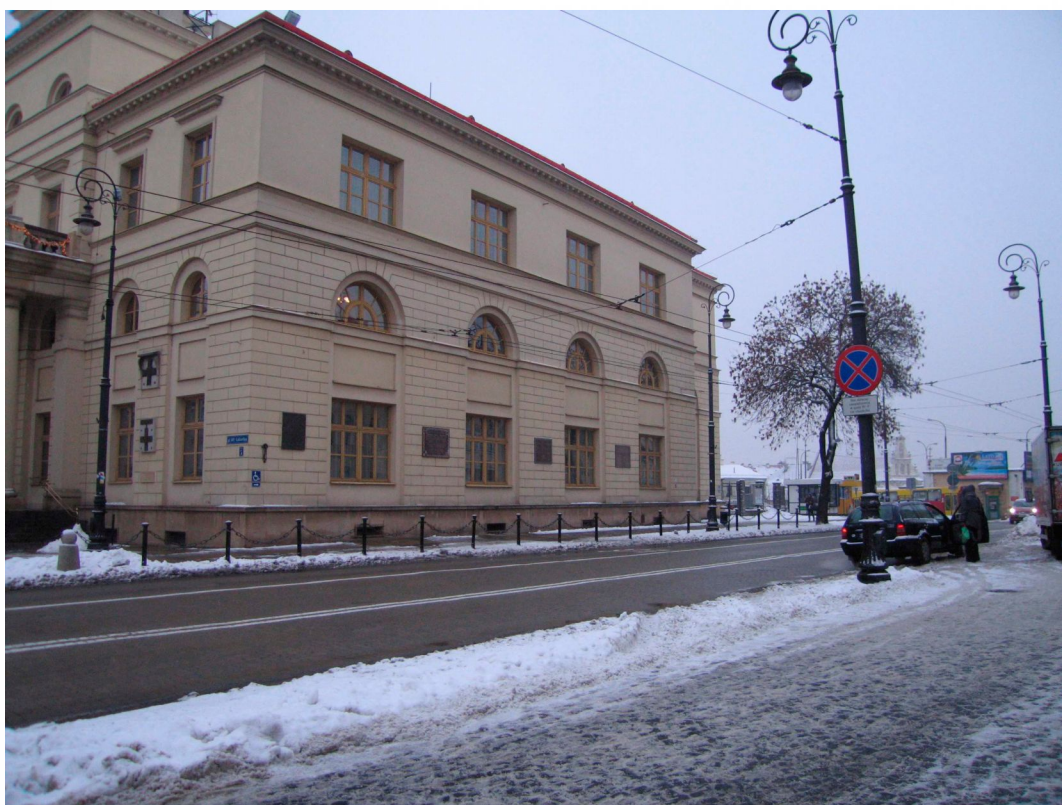
Widok na ul. Lubartowską i Magistrat, dawna Nowa 2, fot. Alicja Magiera, 2010.