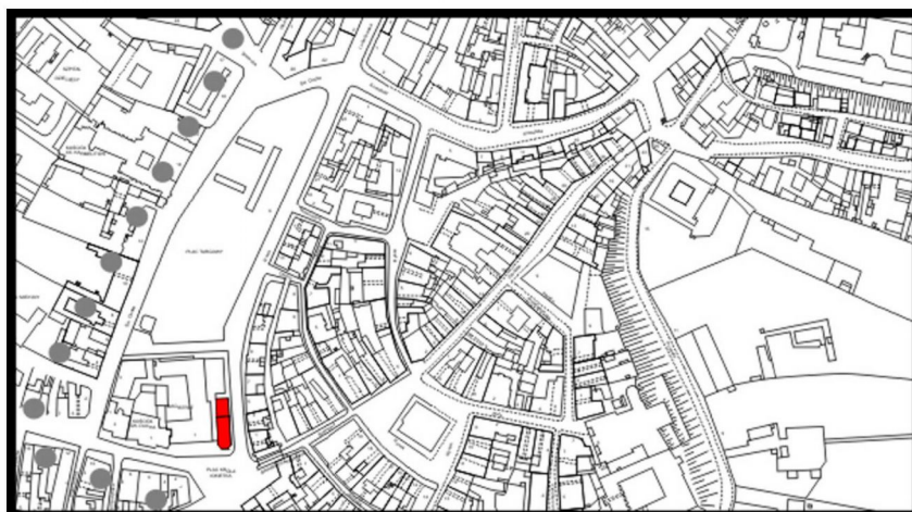
LOKALIZACJA NIERUCHOMOŚCI - Nowa 2/4 LOCATION OF THE PROPERTY - Nowa 2/4