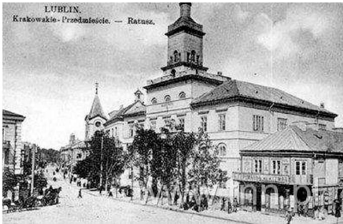
Widok na ul. Krakowskie Przedmieście kamienica pierwsza od prawej – Nowa 2, obecnie nie istnieje, autor nieznany, rok ??, pocztówka.