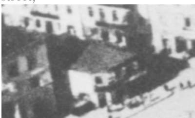
Fragment panoramy Lublina, lata 30., Nowa 2/4/ A fragment of panorama of Lublin in the 1930s, Nowa 2/4,