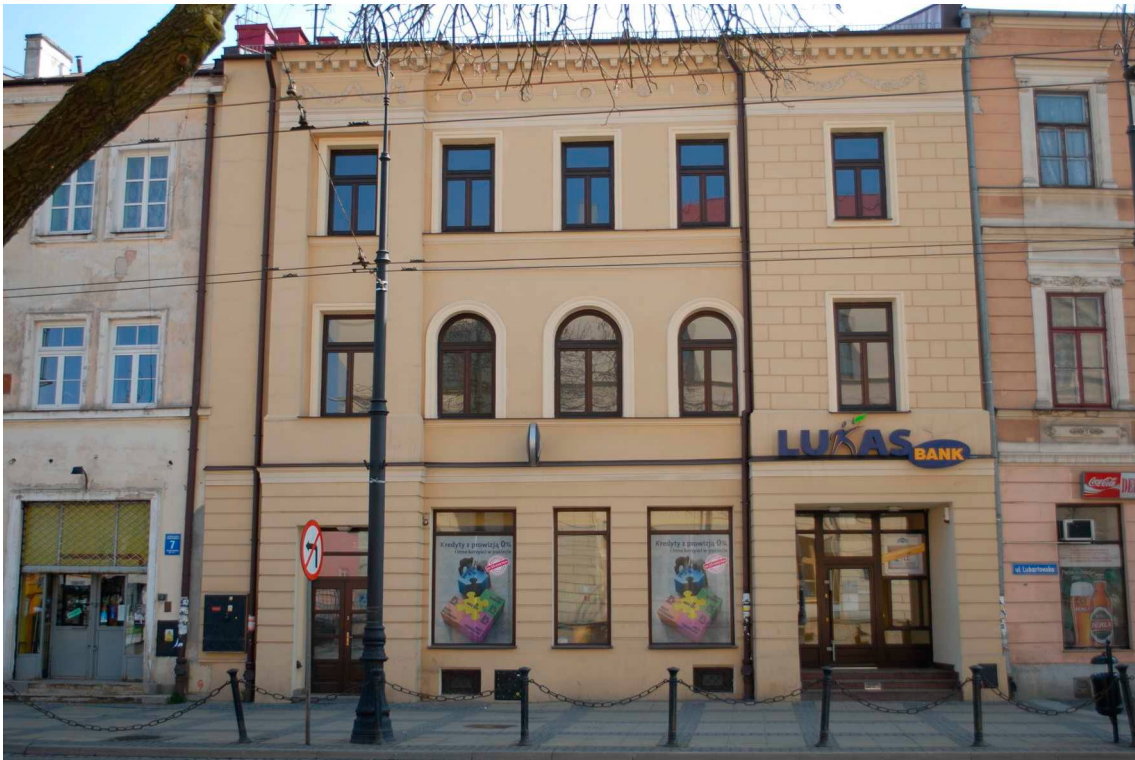
Fasada, Lubartowska 5 dawna Nowa 5, 2010.