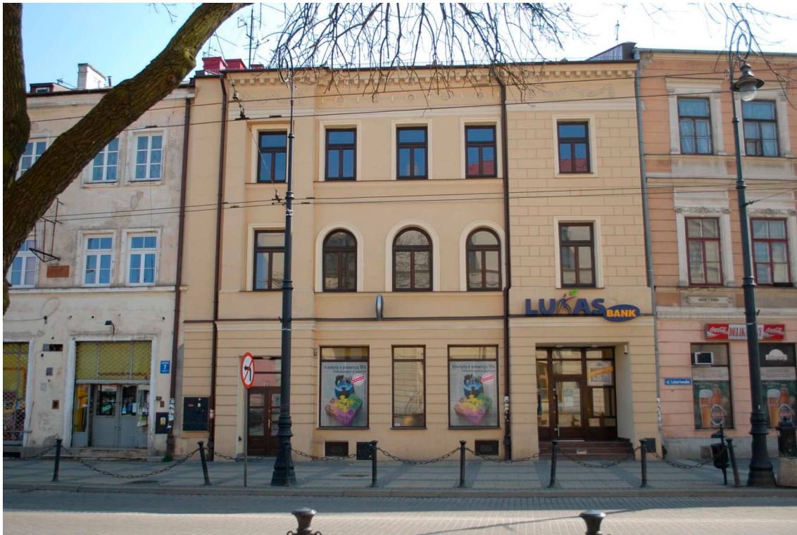
Fasada, Lubartowska 5 dawna Nowa 5, fot. Piotr Sztajdel, 2010.