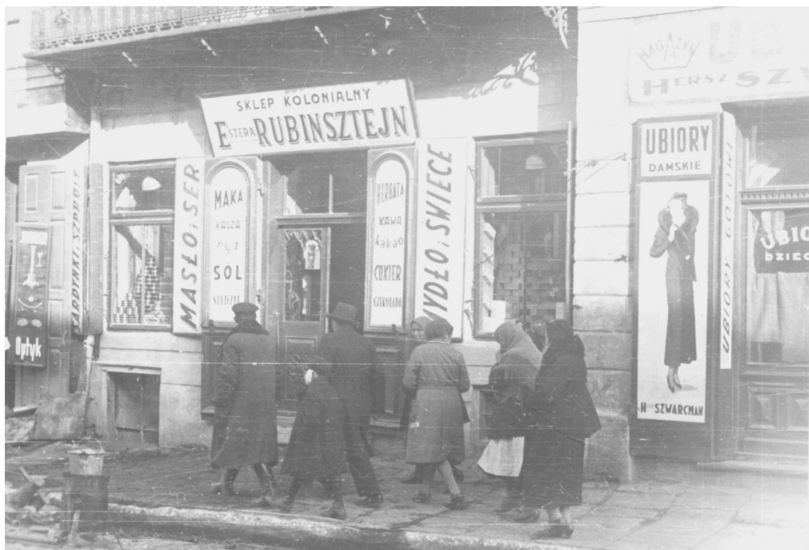
Nowa 5, autor Stefan Kielszna, 1938, własność Jerzy Kielsznia.