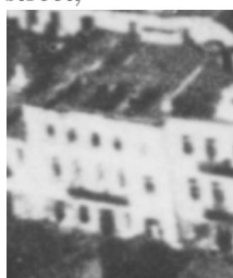
Fragment panoramy Lublina, lata 30., Nowa 5/A fragment of panorama of Lublin in the 1930s, Nowa 5,