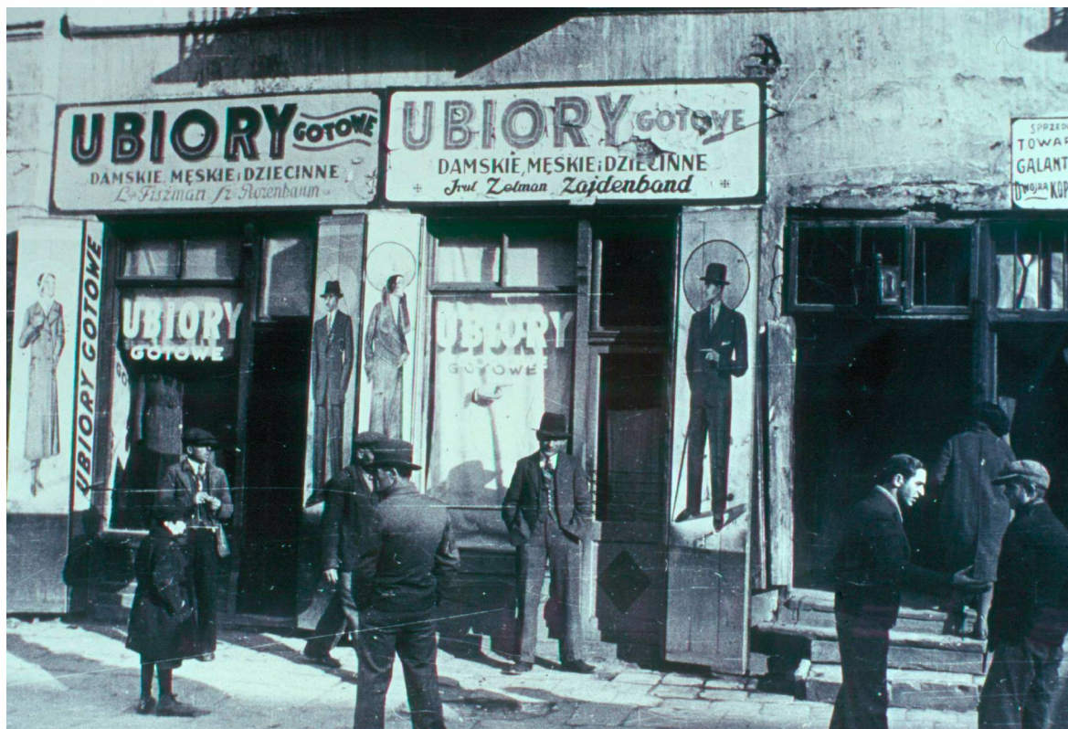
Nowa 7, autor Stefan Kielszna, 1938, własność Jerzy Kielsznia.