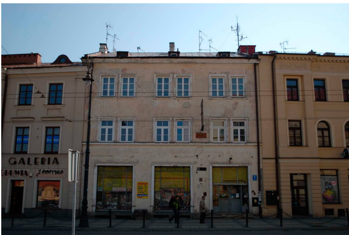
Fasada, Lubartowska 7 dawna Nowa 7, fot. Piotr Sztajdel, 2010.