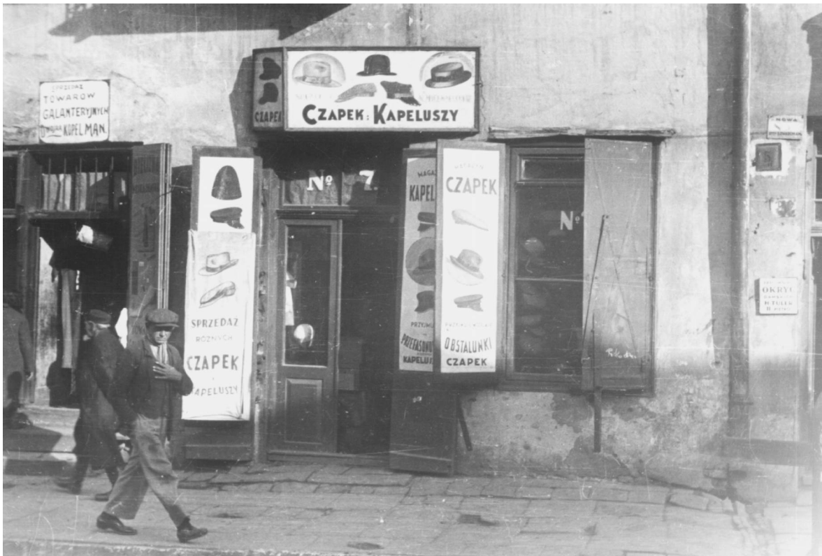
Nowa 7, autor Stefan Kielszna, 1938, własność Jerzy Kielsznia.