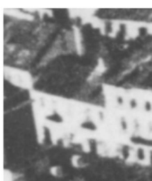
Fragment panoramy Lublina, lata 30., Nowa 7/ A fragment of panorama of Lublin in the 1930s, Nowa 7,