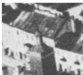
Fragment panoramy Lublina, lata 30., Nowa 9/ A fragment of panorama of Lublin in the 1930s, Nowa 9,