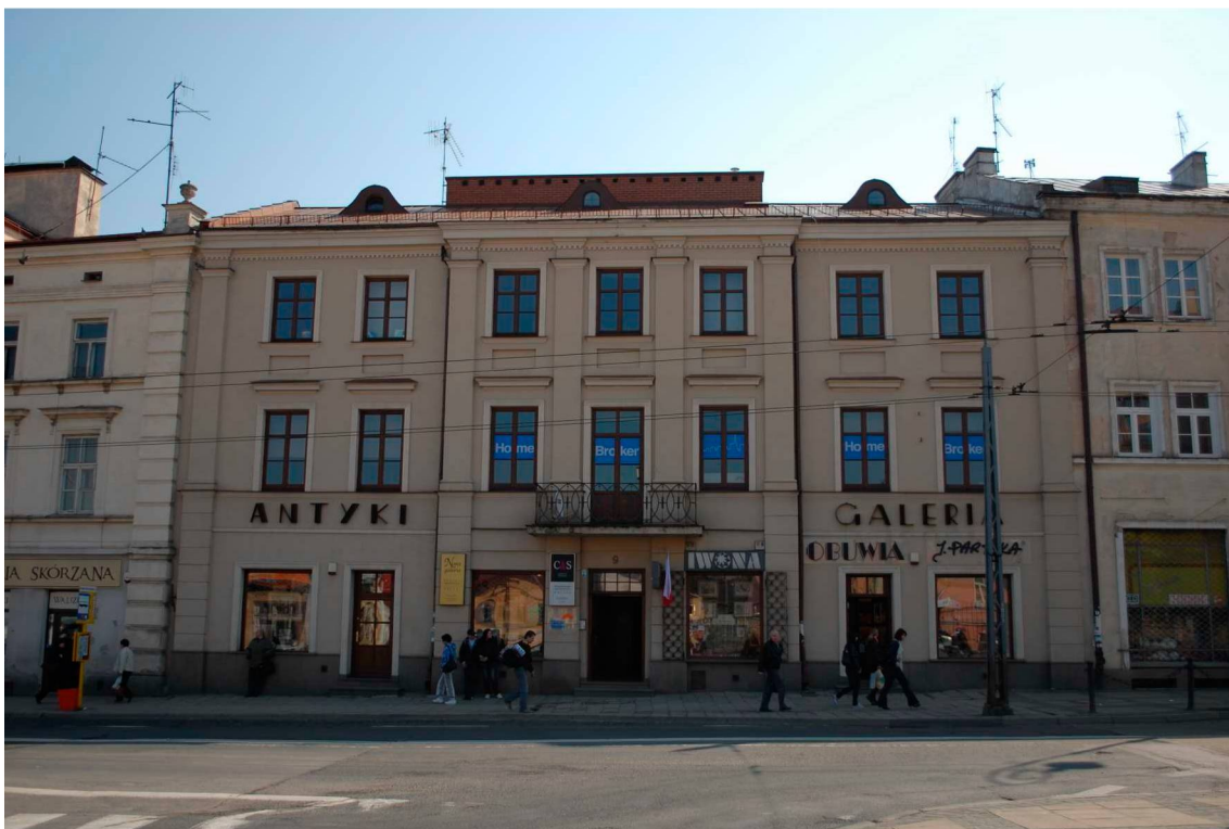
Fasada, Lubartowska 9 dawna Nowa 9, fot. Piotr Sztajdel, 2010.