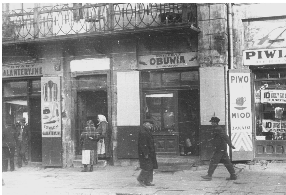
Nowa 9, autor Stefan Kielszna, 1938, własność Jerzy Kielsznia.