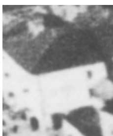
Fragment panoramy Lublina, lata 30., Nowa 13/ A fragment of panorama of Lublin in the 1930s, Nowa 13,