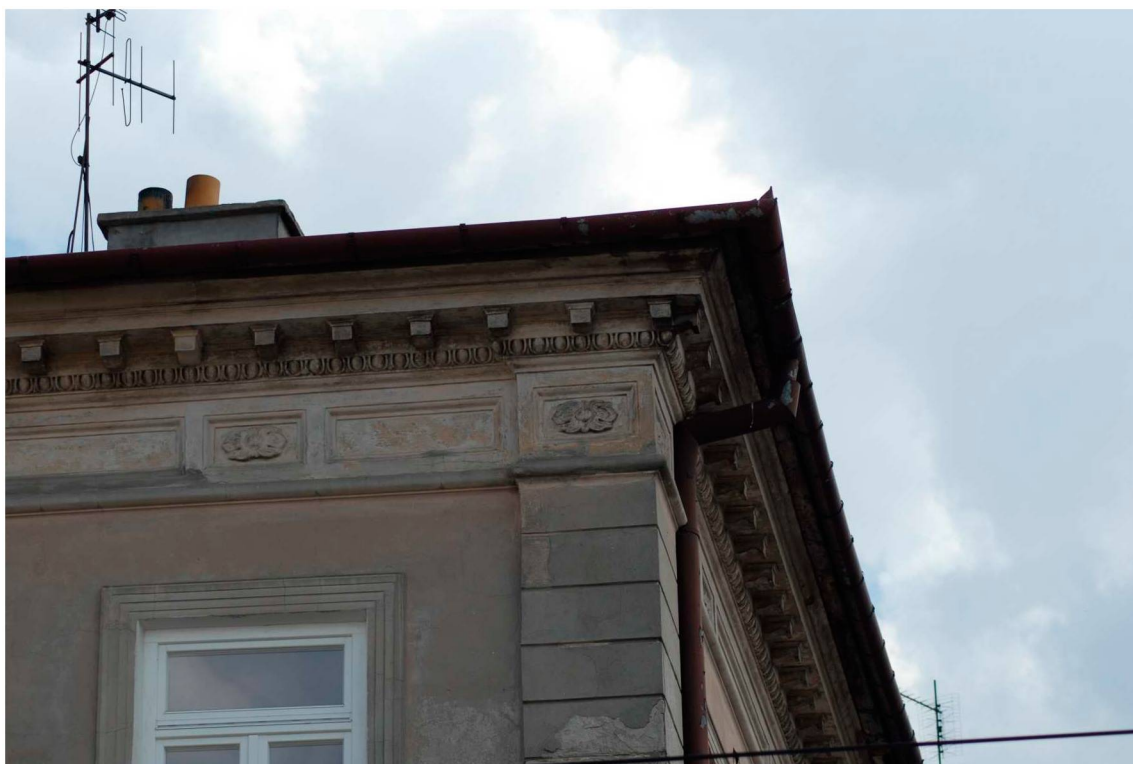
Detale, Lubartowska 15 dawna Nowa 13, fot. Piotr Sztajdel, 2010.