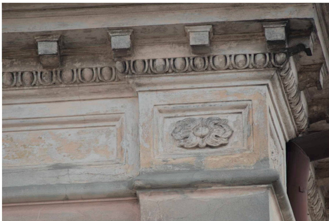
Detale, Lubartowska 15 dawna Nowa 13, fot. Piotr Sztajdel, 2010.