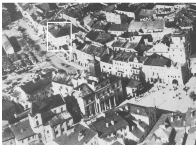
Fragment panoramy Lublina, lata 30., ul. Nowa/ A fragment of panorama of Lublin in the 1930s, Nowa street,