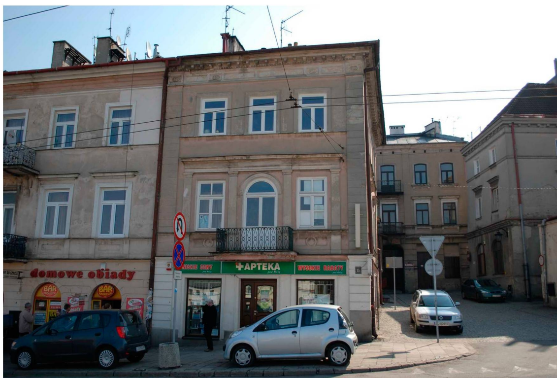
Fasada, Lubartowska 15 dawna Nowa 13, fot. Piotr Sztajdel, 2010.